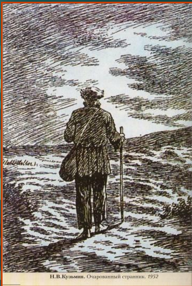
Н.В.Кузьмин. Очарованный странник. 1952

Вся жизнь Флягина прошла в пути, он странник, и странствия его ещё далеко не закончены. Его жизненный путь – путь к вере, к тому миропониманию и душевному состоянию, в котором мы видим героя на последних страницах повести: