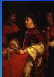
Папа Лев X Медичи(1517-1519)