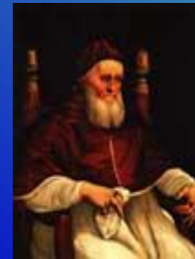
Папа Юлий II делла Ровере'