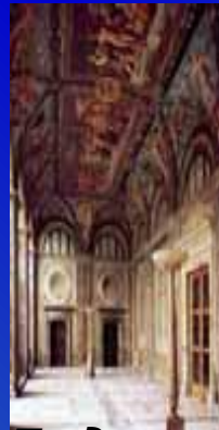
Лоджия Психеи в вилле Фарнезина (1515-17)