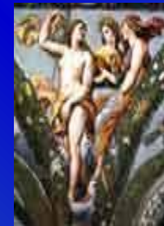
Венера, Церера и Юнона в лоджии Виллы Фарнезина (1569)