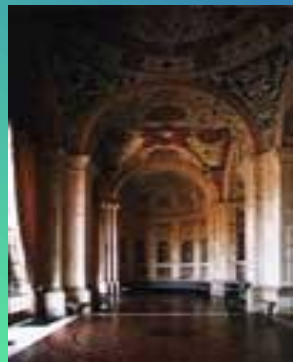
Лоджия виллы Мадама, Рим (начата в 1516)