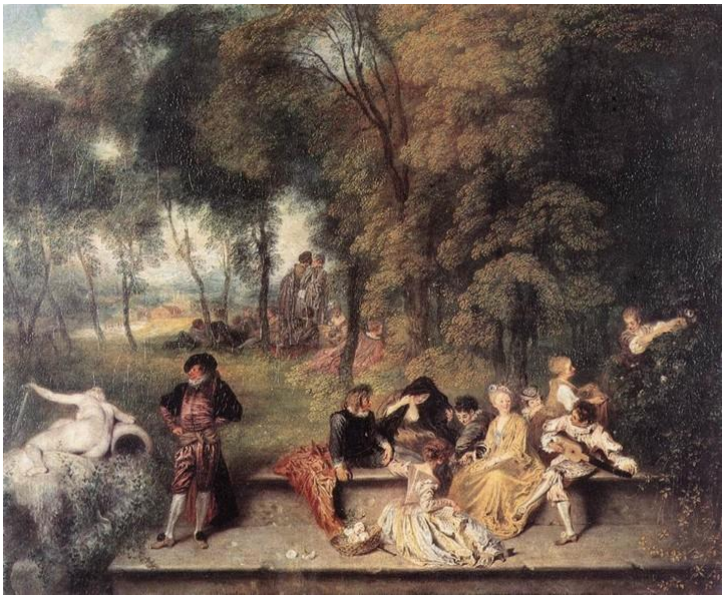
Общество в парке