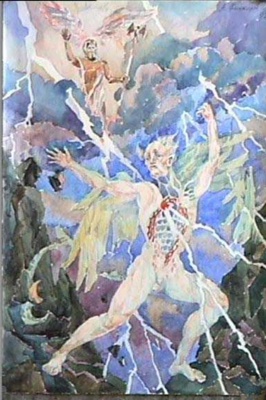
Зевс поражает титана акварель, 1992

Титаны являлись предшественниками олимпийских богов и в этом они сходны с етунами- хримтурсами (скандинавская мифология) и асурами (индийская мифология)