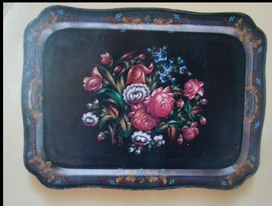
Поднос прямоугольный крылатый. И.С. Леонтьев. 1973г.