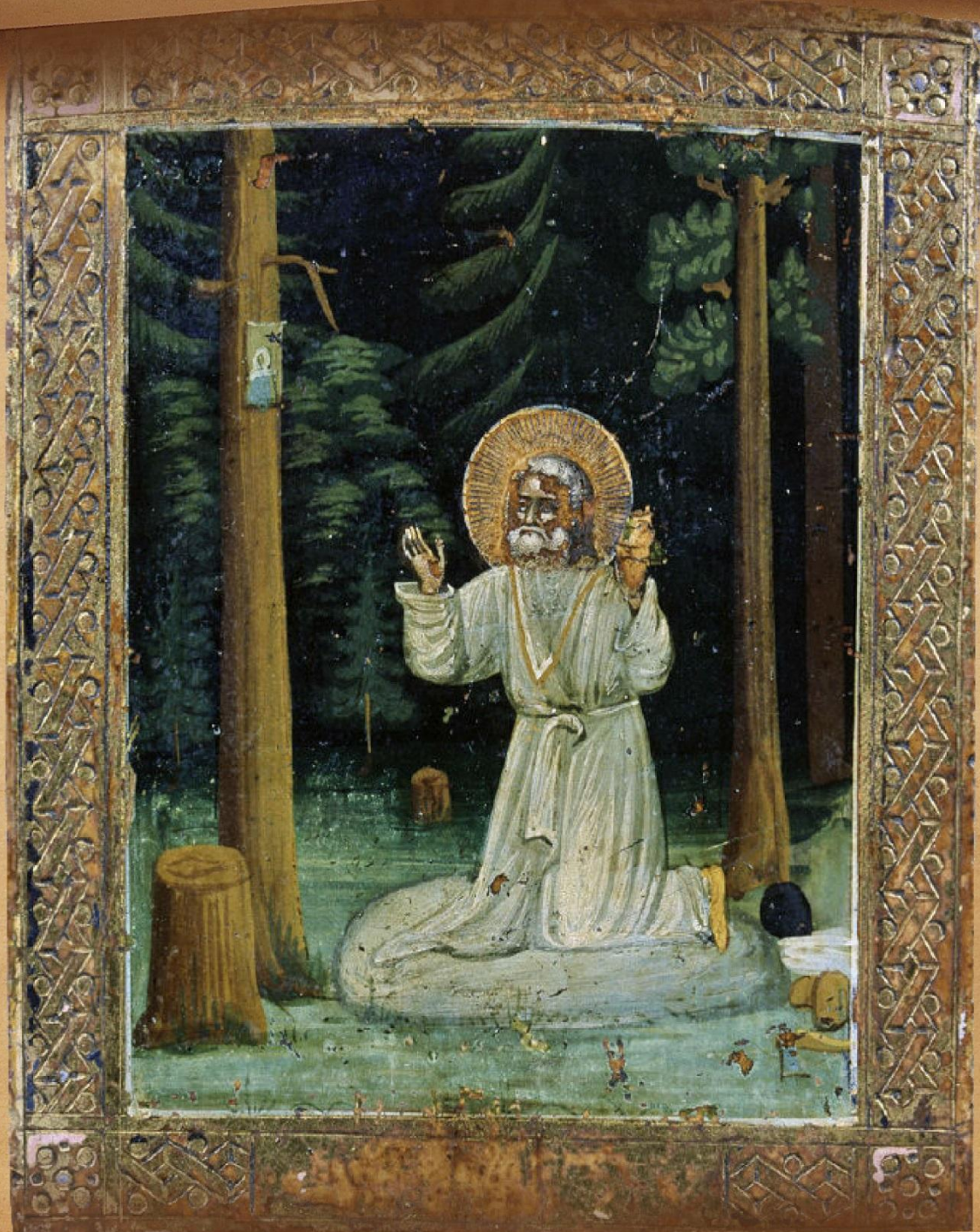
Серафим Саровский молящийся на камне.