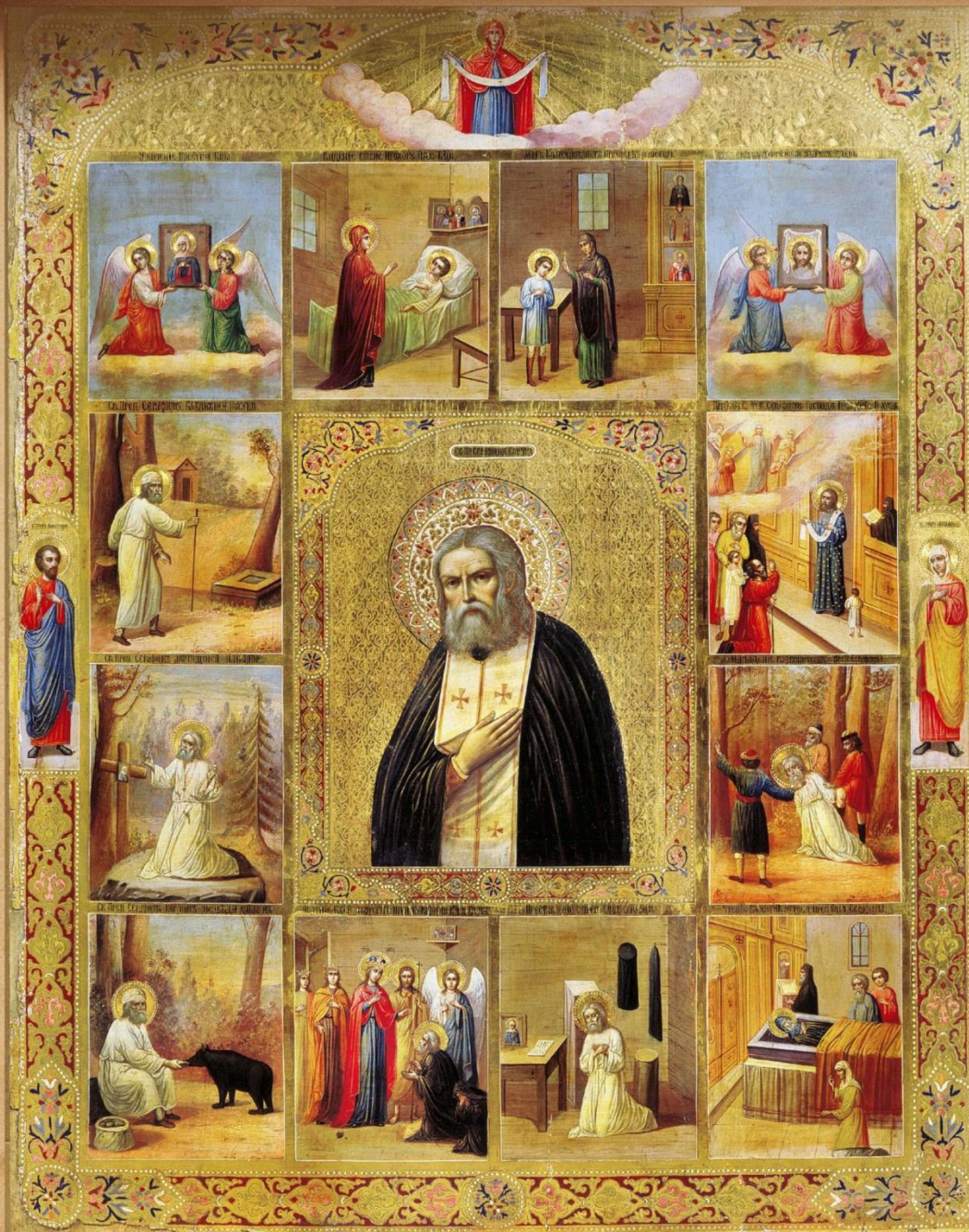
Образ Серафима Саровского с клеймами ЖИТИЯ