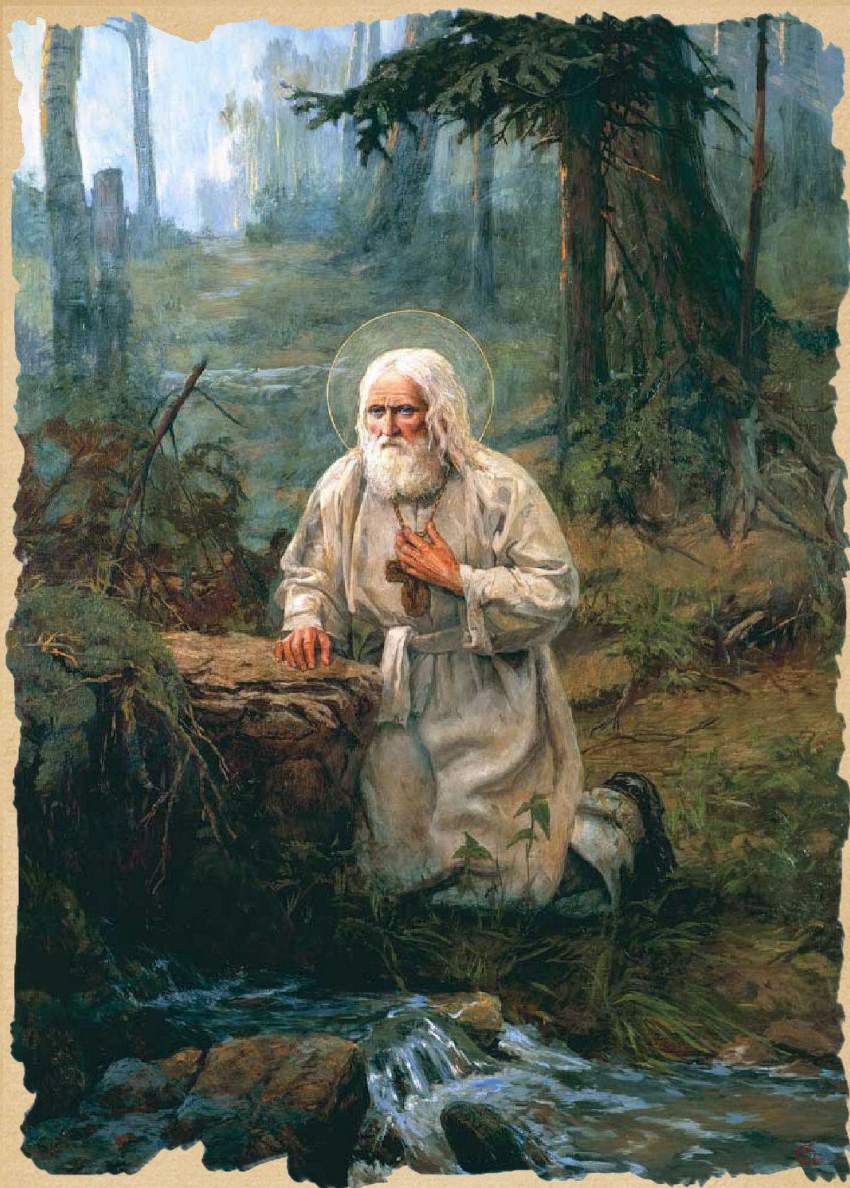
Серафим Саровский у святого источника