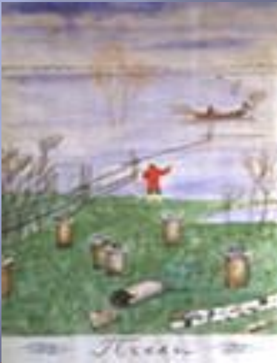
Иллюстрация к стихотворению «Пчелы» Н.А. Некрасова. 1921г. Кустодиев

"Натко медку! с караваем покушай, Притчу про пчелок послушай! Нынче не в меру вода разлилась, Думали, просто идет наводнение, Только и сухо, что наше селение По огороды, где ульи у нас. Пчелка осталась водой окруженная, Видит и лес, и луга вдалеке, Ну и летит, - ничего налегке, А как назад полетит нагруженная, Сил не хватает у милой. Беда! Пчелами вся запестрела вода, Тонут работницы, тонут сердечные! Горю помочь мы не чаяли, грешные, Не догадаться самим бы вовек! Да нанесло человека хорошего, Под благовещенье помнишь прохожего? Он надоумил, христов человек! Слушай, сынок, как мы пчелок избавили: Я при прохожем тужил-тосковал; "Вы бы им до суши вежи поставили", - Это он слово сказал! Веришь: чуть первую вежу зеленую На воду вывезли, стали втыкать, Поняли пчелки сноровку мудреную: Так и валят и валят отдыхать!