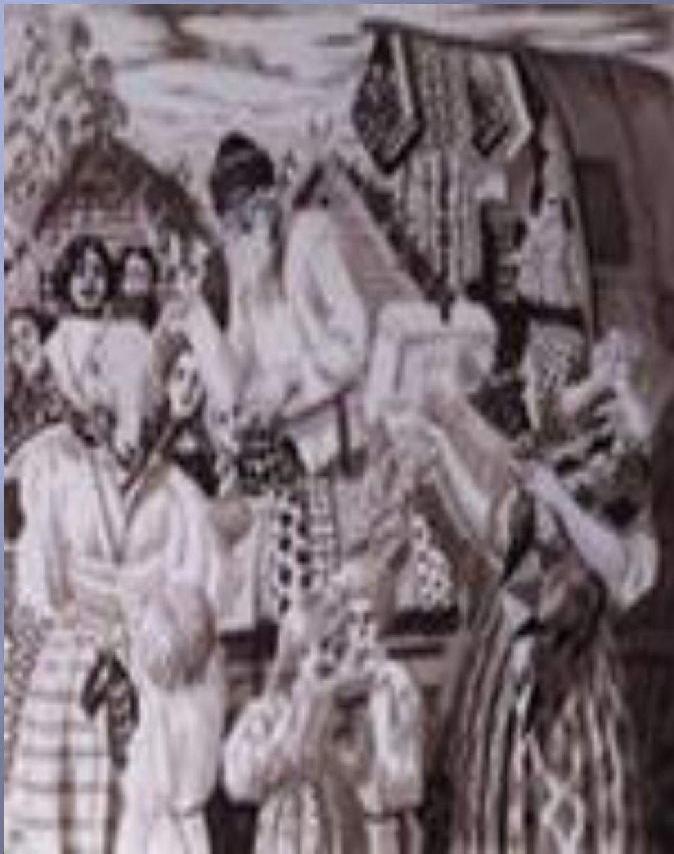
Иллюстрация к стихотворению «Дядюшка Яков» Н.А. Некрасова

Дом - не тележка у дядюшки Якова. Господи боже! чего-то в ней нет! Седенький сам, а лошадка каракова; Вместе обоим сто лет. Ездит старик, продает понемногу, Рады ему, да и он-то того: Выпито вечно и сыт, слава богу. Пусто в деревне, ему ничего, Знает, где люди: и куплю, и мену На полосах поведет старина; Дай ему свеклы, картофельку, хрену, Он тебе всё, что полюбится, - на! Бог, видно, дал ему добрую душу. Ездит - кричит то и знай: