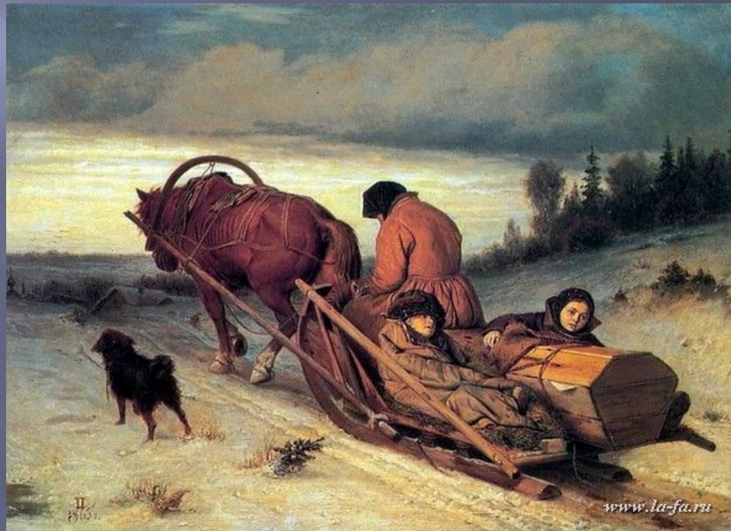
В.Г.Перов. Проводы покойника.

Старуха в больших рукавицах Савраску сошла понукать. Сосульки у ней на ресницах, С морозу - должно полагать.