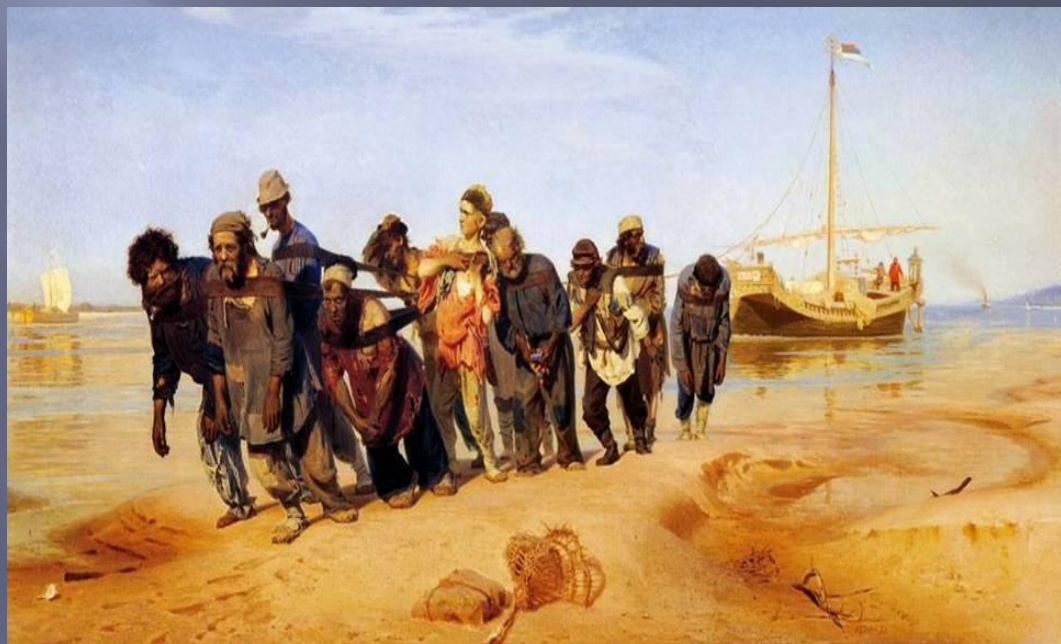
И.Е.Репин. Бурлаки на Волге

..... Выдь на Волгу: чей стон раздаётся Над великою русской рекой? Этот стон у нас песней зовется – То бурлаки идут бечевою!.. Волга! Волга!.. Весной многоводной Ты не так заливаешь поля, Как великою скорбью народной Переполнилась наша земля, - Где народ, там и стон... Эх, сердечный! Что же значит твой стон бесконечный? Ты проснешься ль, исполненный сил, Иль, судеб повинясь закону, Всё, что мог, ты уже совершил, - Создал песню, подобную стону, И духовно навеки почил?..