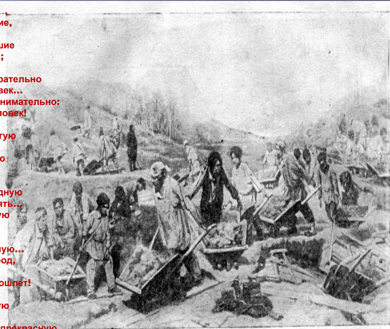
Ремонтные работы на железной дороге. С картины художника К. А. Савицкого,

Вынесет всё - и широкую, ясную Грудью дорогу проложит себе. Жаль только - жить в эту пору прекрасную Уж не придется - ни мне, ни тебе.