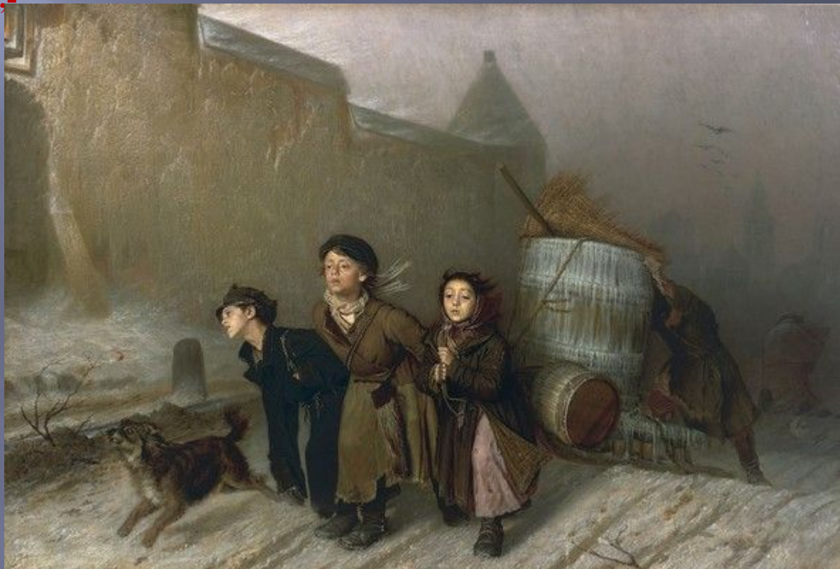
В.Г.Перов . Тройка.

..... Где уж нам, измученным в неволе, Ликовать, резвиться и скакать! Если б нас теперь пустили в поле Мы в траву попадали бы - спать. Нам домой скорей бы воротиться, Но зачем идем мы и туда?.. Сладко нам и дома не забыться: Встретит нас забота и нужда! Там, припав усталой головою К груди бледной матери своей, Зарыдав над ней и над собою, Разорвем на части сердце ей.