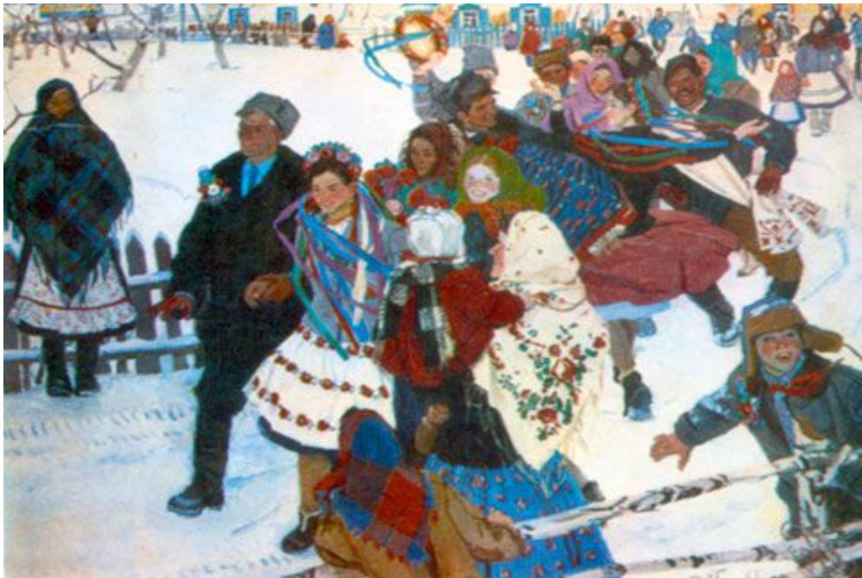
Татьяна Яблонская. «Свадьба», 1963 (оригинал)