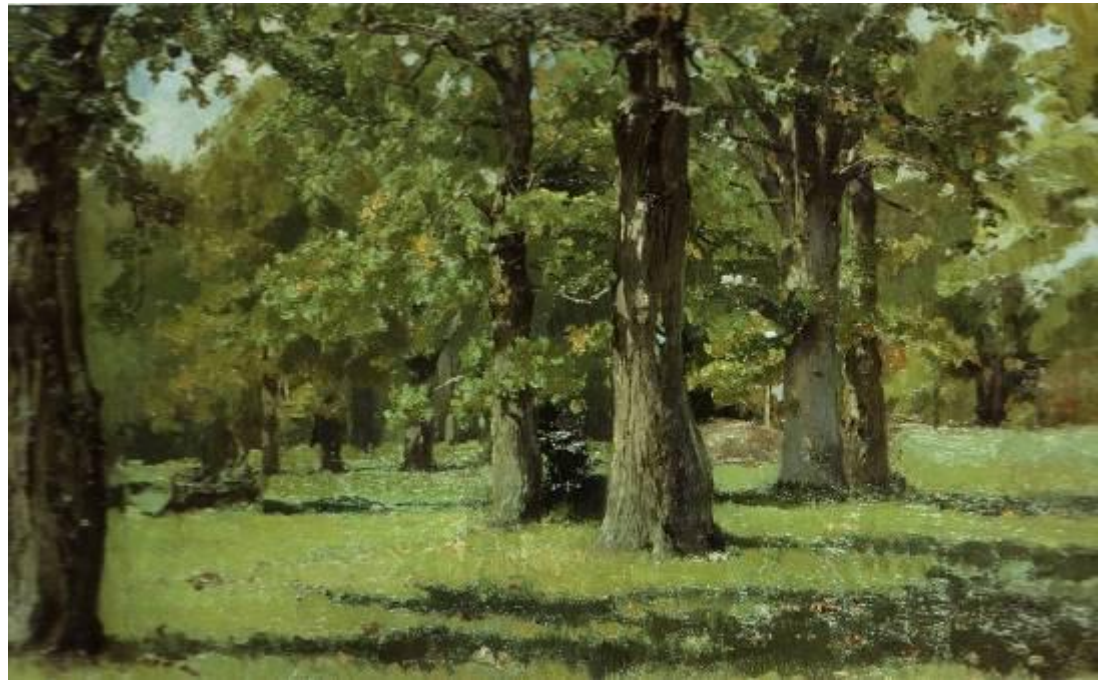
В.М.Васнецов «Дубовая роща в Абрамцево»