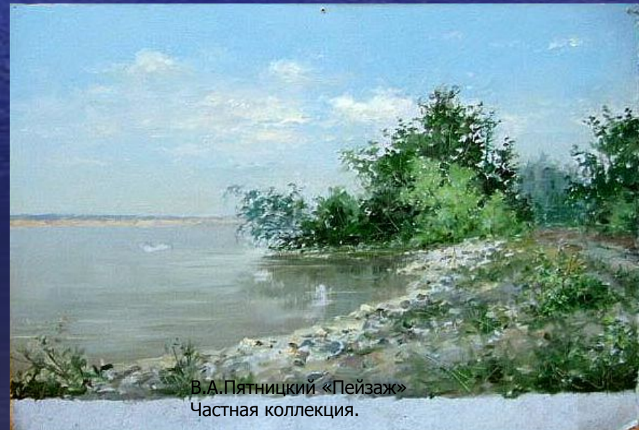
В.А.Пятницкий «Пейзаж» Частная коллекция.