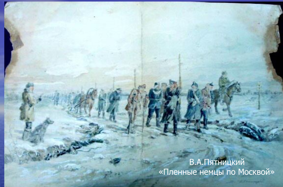
В.А.Пятницкий «Пленные немцы по Москвой»