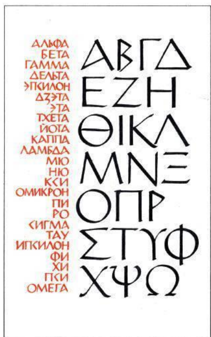
Рис. руко пись Бука