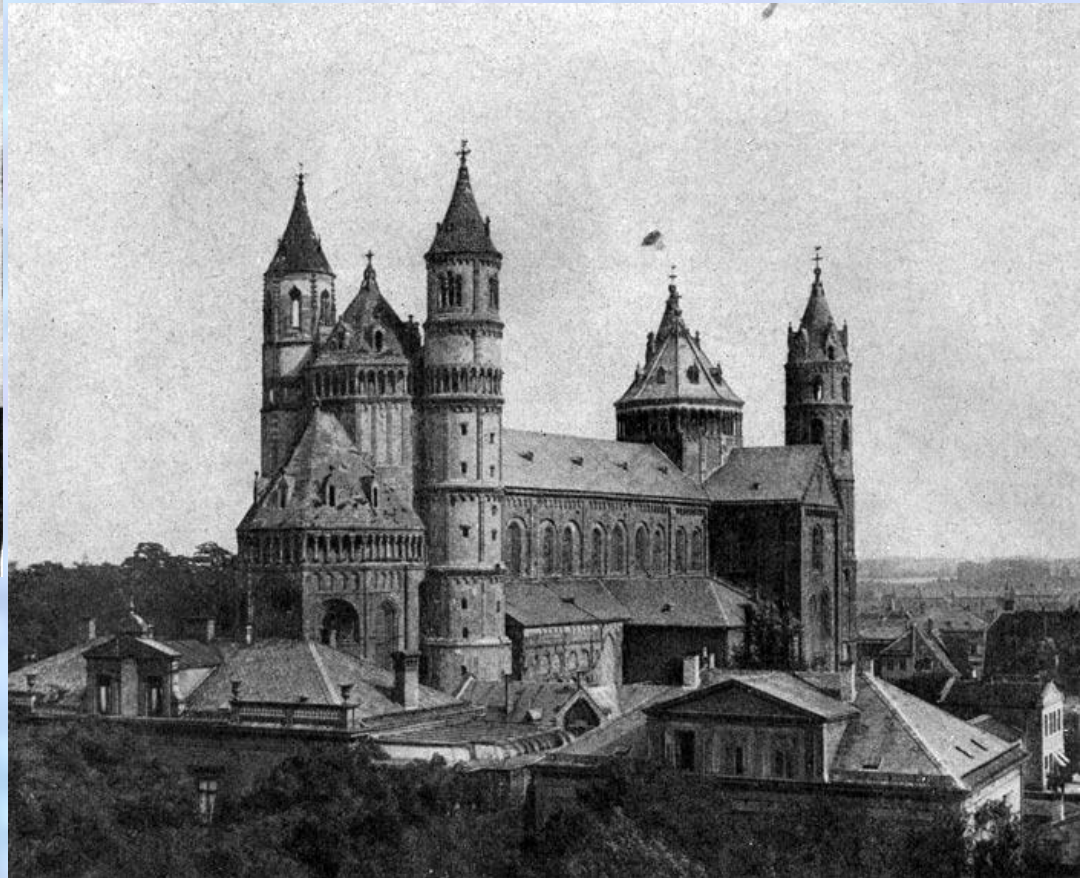
Собор в Вормсе

На средокрестии высится массивная башня. Узкие, высокие башни с шатровыми вершинами сторожат храм с восточной и западной стороны.