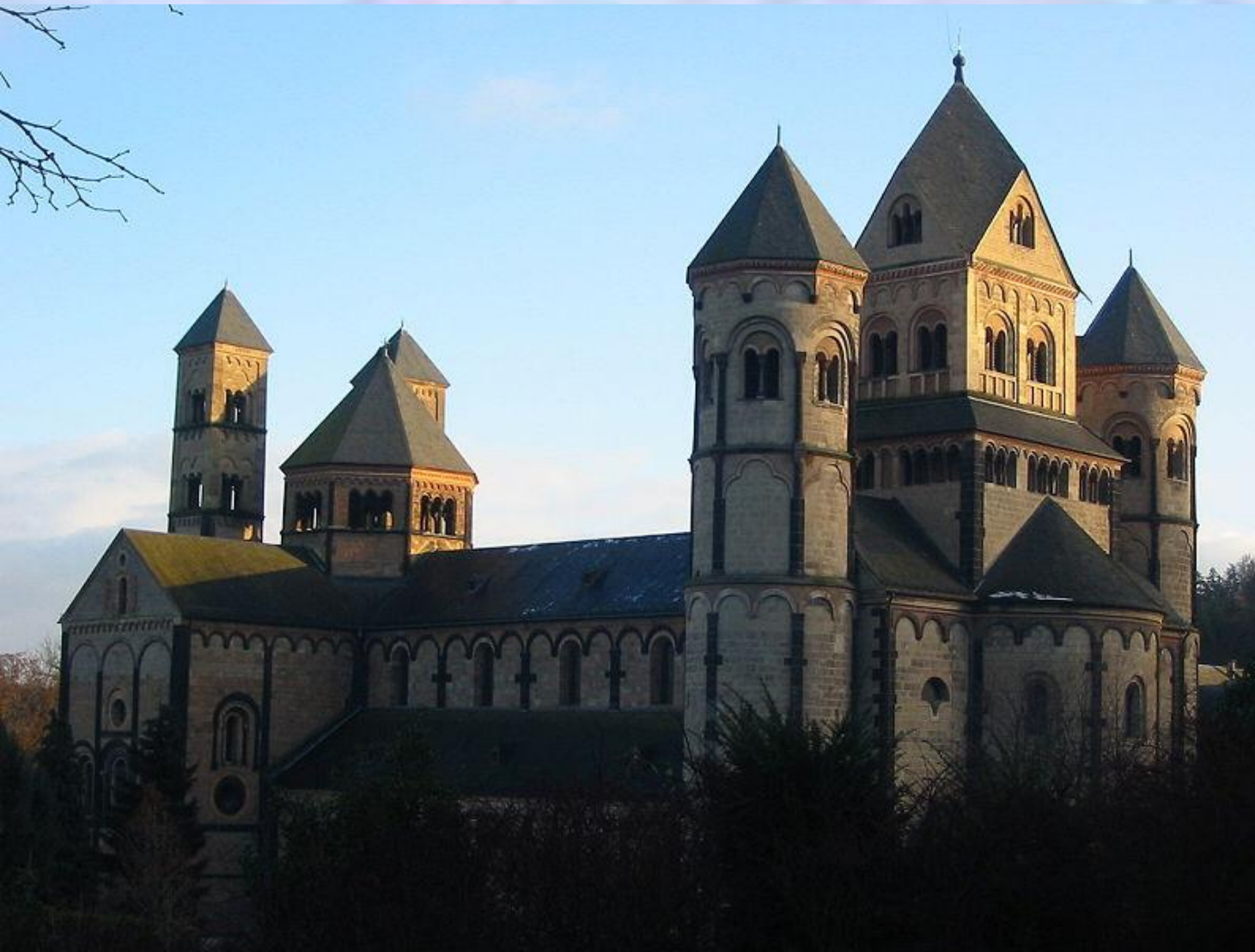
Аббатство Мария Лаах, Германия

Романский стиль (от лат. romanus — римский) развивался в европейском искусстве X-XII веков.