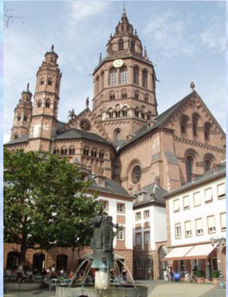
Собор в Майнце