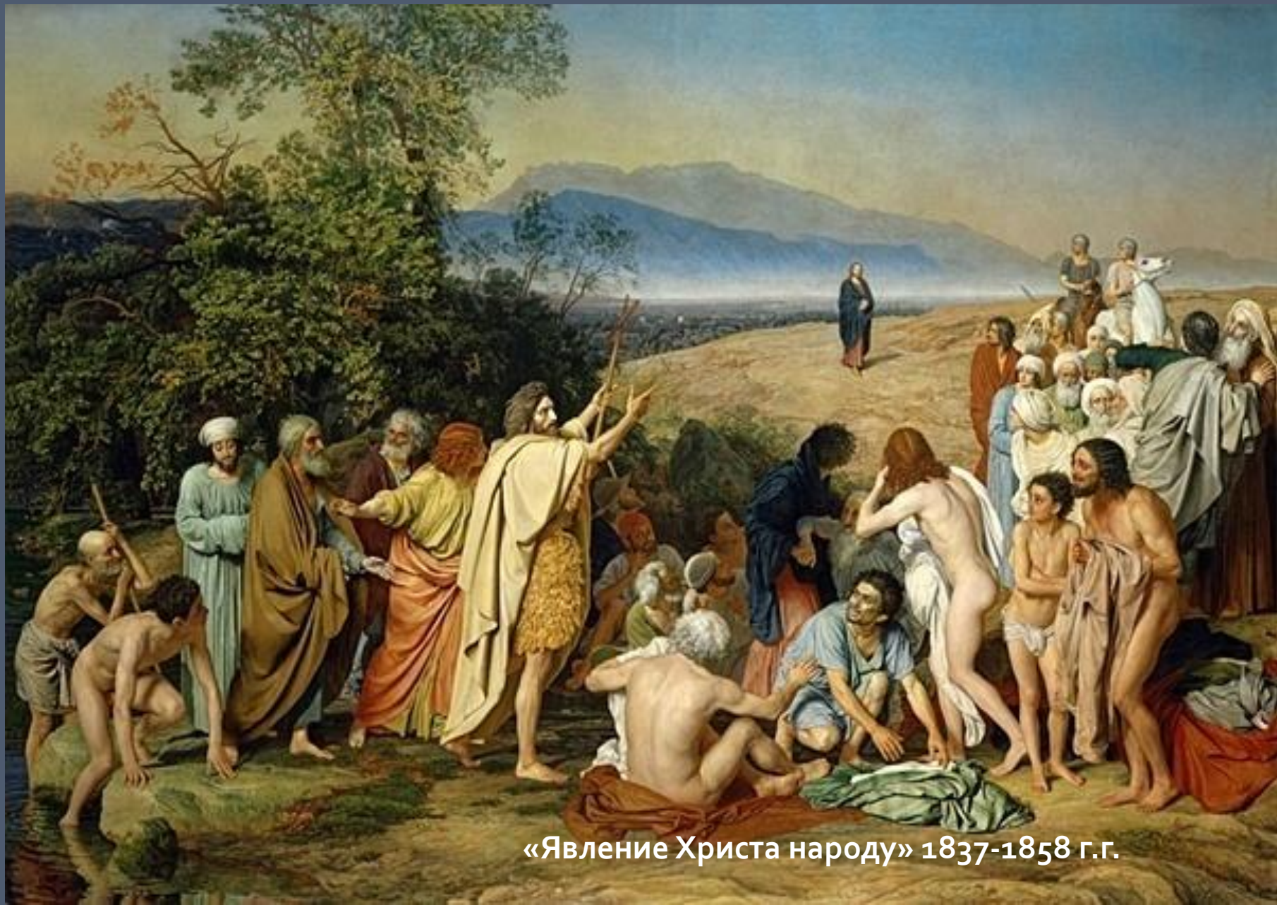
«Явление Христа народу» 1837-1858 г.г.