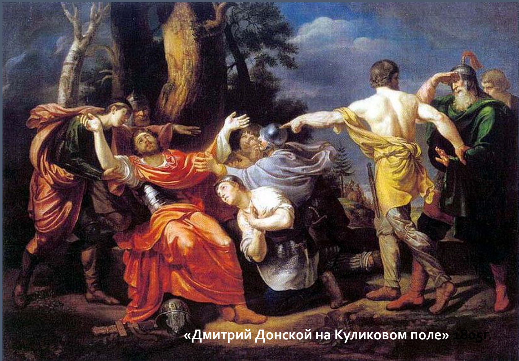
«Дмитрий Донской на Куликовом поле»