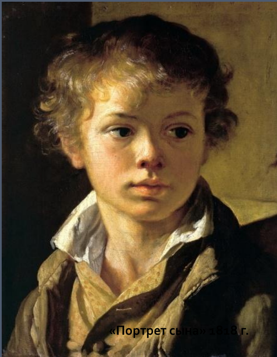
«Портрет сына» 1818 г.