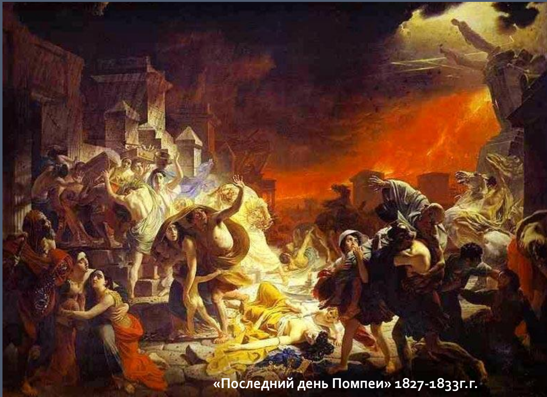
«Последний день Помпеи» 1827-1833г.г.