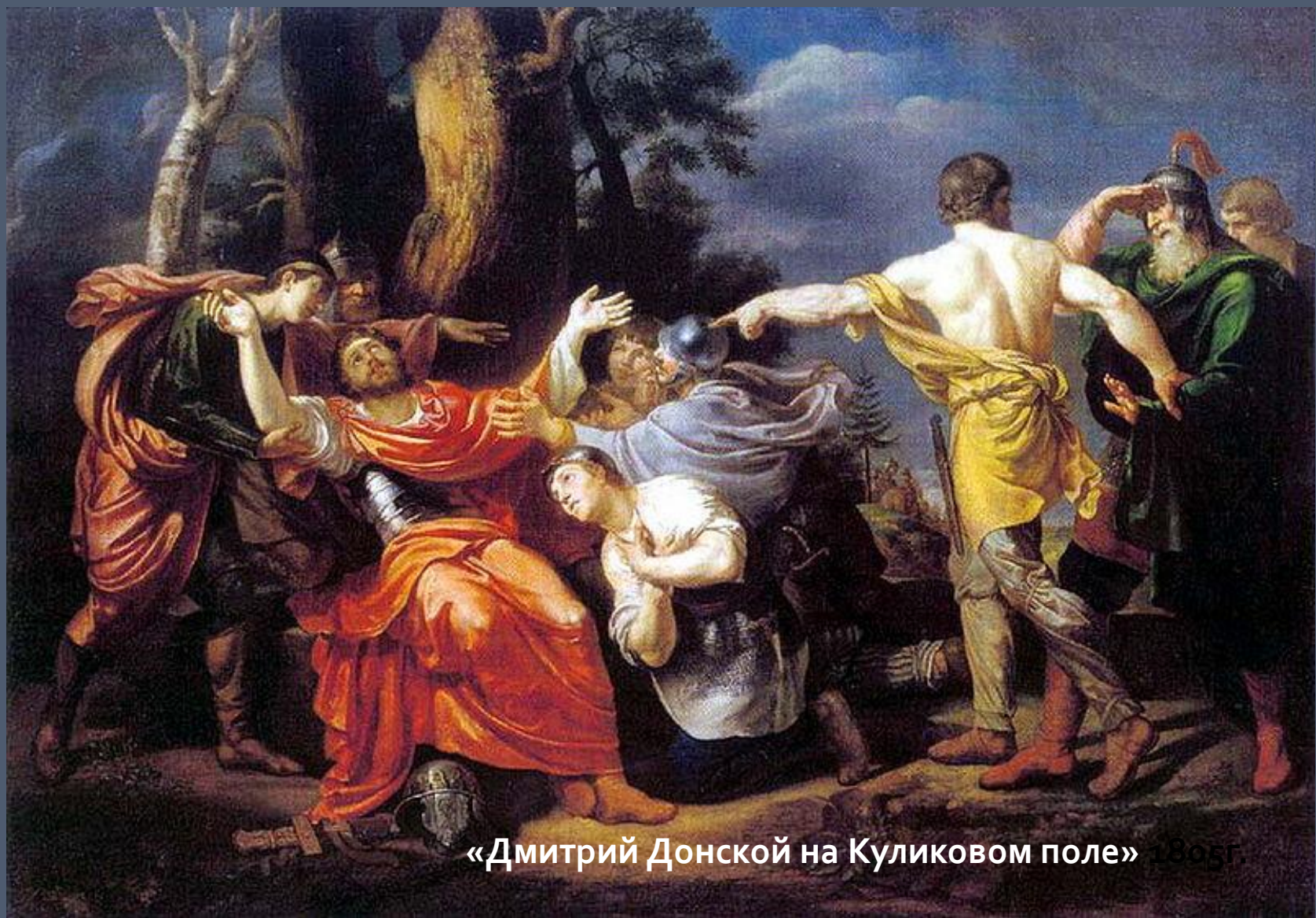
«Дмитрий Донской на Куликовом поле»