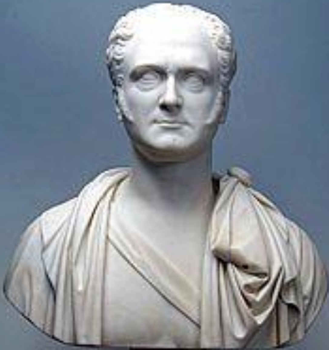
Бертель Торвальдсен. Бюст Александра. I Начало 1820-х годов.