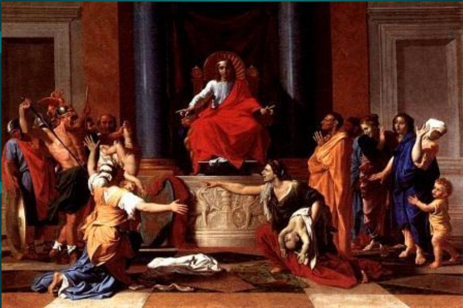
Николо Пуссен. Суд Соломона