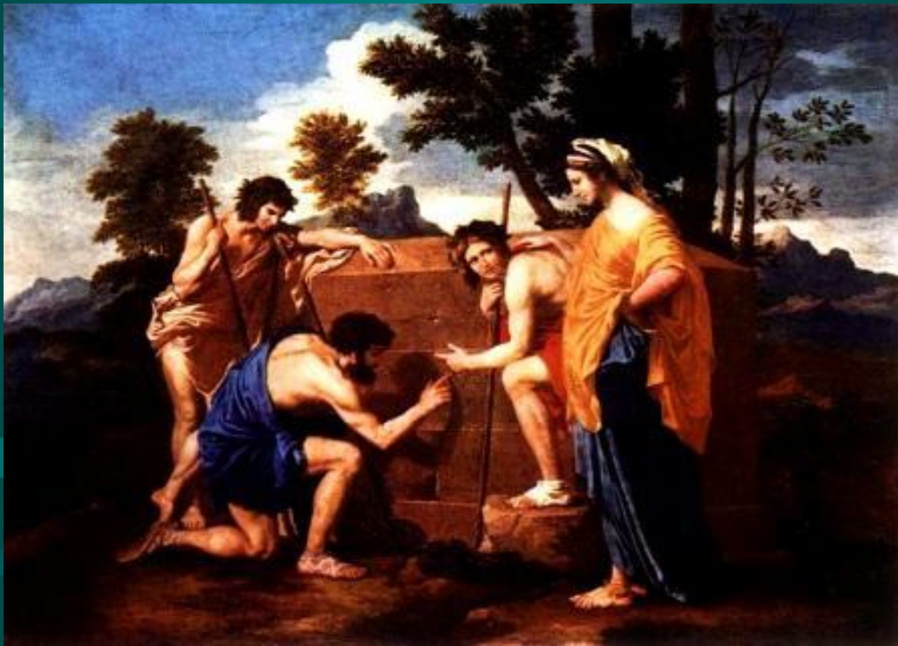
Никола Пуссен. Аркадские пастухи. 1638-1639 гг. Лувр, Париж.

Никола Пуссен – автор многочисленных картин на мифологические, исторические, религиозные и пейзажные темы. Картина «Аркадские пастухи» – одна из вершин творчества художника, плод его неустанных поисков. У каменного надгробия остановились трое молодых людей и молодая женщина. Судя по их одежде и посохам, это пастухи. Один из них припал на колено, он внимательно разбирает надпись на надгробии. Юноша и девушка слева замерли, погружившись в молчаливое раздумье о бренности человеческой жизни.