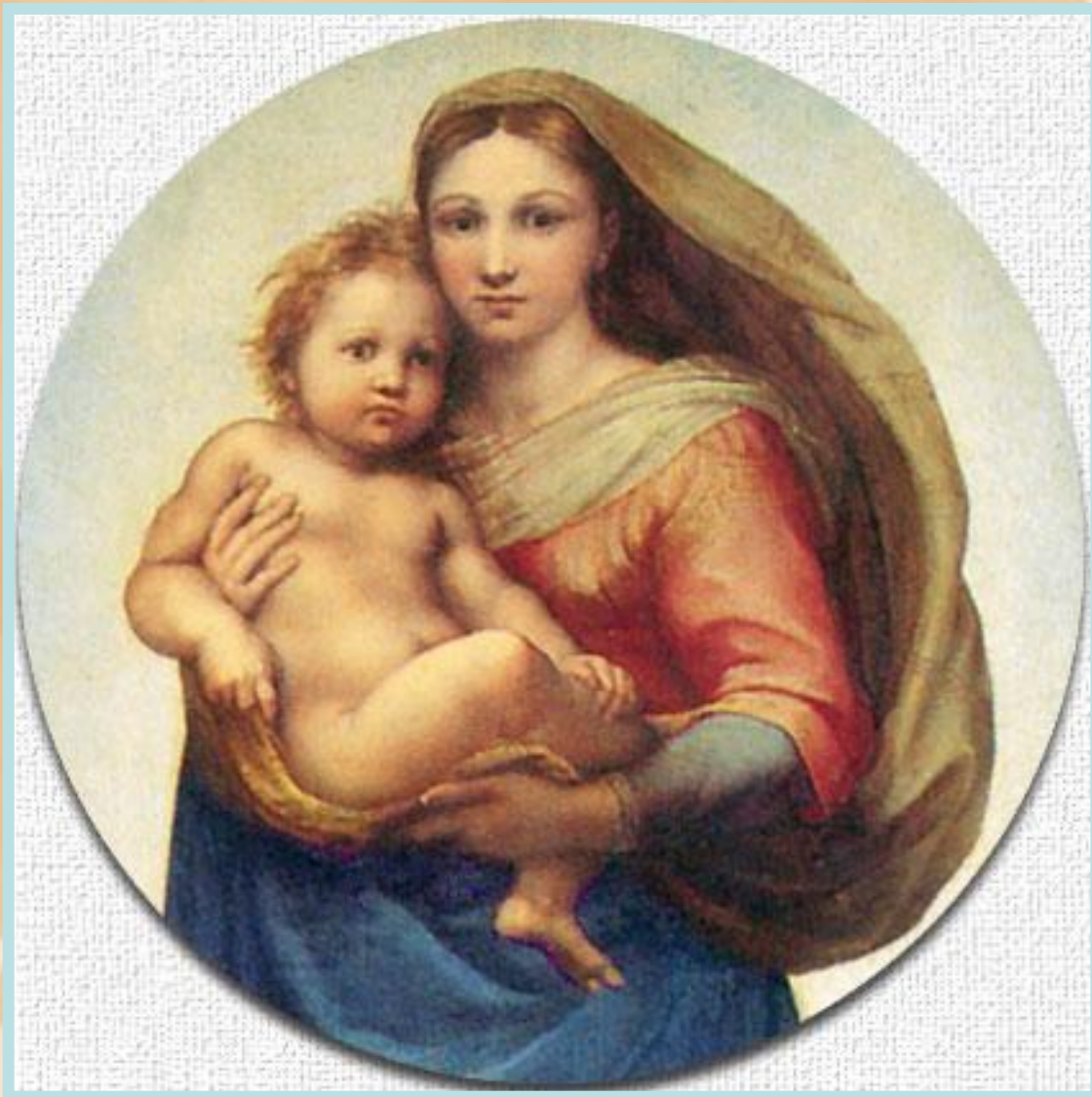
Рафаэль Санти. «Сикстинская мадонна. Мария и Христос». 1512-1515.