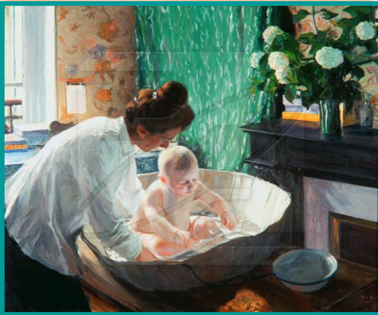
Б.Кустодиева. «Утро». 1904.