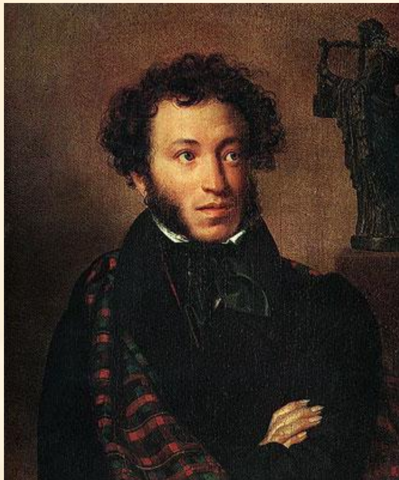
О. А. Кипренский 'Портрет поэта А. С. Пушкина'