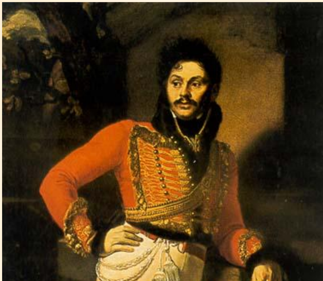
О. А. Кипренский

Портрет Лейб-гусарского полковника Е.В. Давыдова