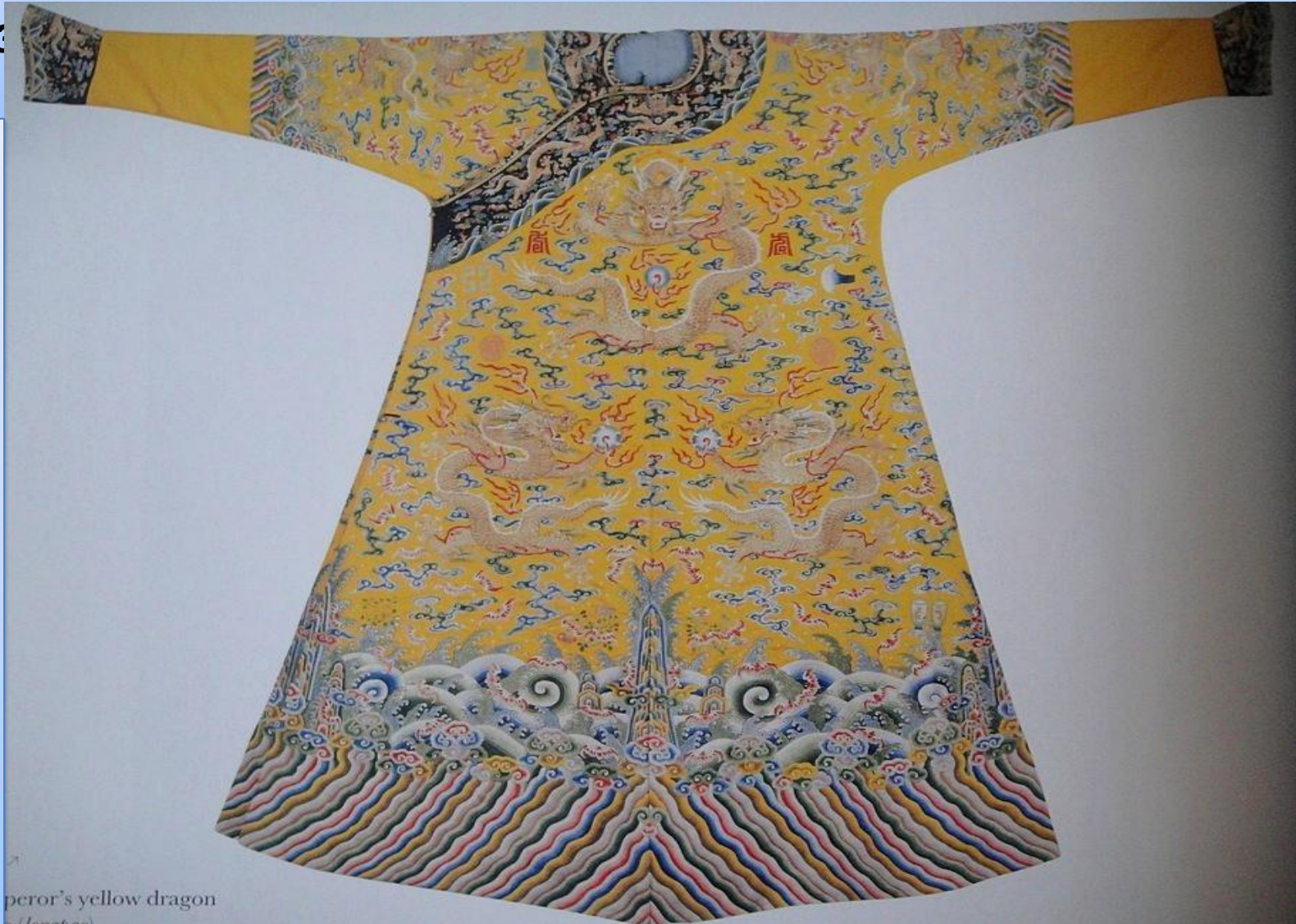
peror's yellow dragon (longpao)

Одежда китайцев была удобной, шилась из шелка и хлопка, украшалась вышивкой шелком и золотыми нитями. В декоре использовалась определенная система изображений. Вышитый шелковый халат стал своеобразным