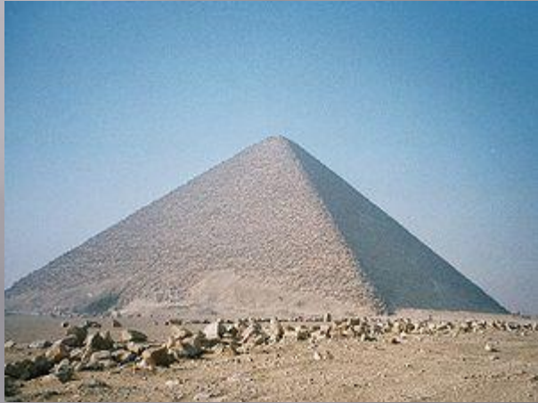
Розовая пирамида, Снофру (IV династия) : 219 м (105 м)