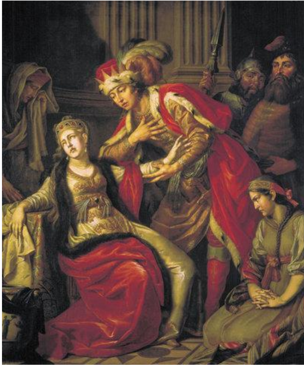
А. Лосенко. Владимир и Рогнеда. 18