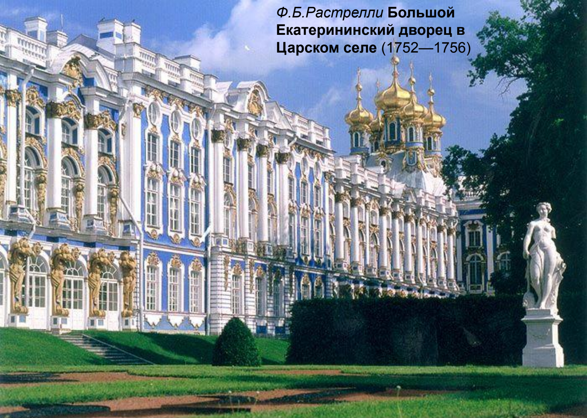
Ф.Б.Растрелли Большой Екатерининский дворец в Царском селе (1752—1756)