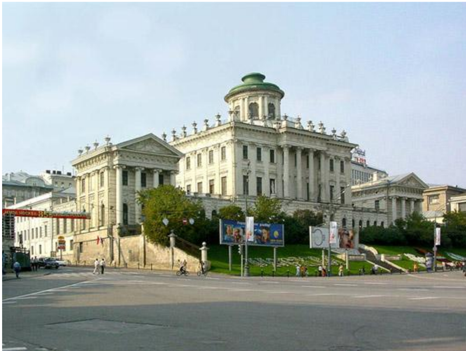
В. И. Баженов. Дом Пашкова в Москве. 1784-86 гг.