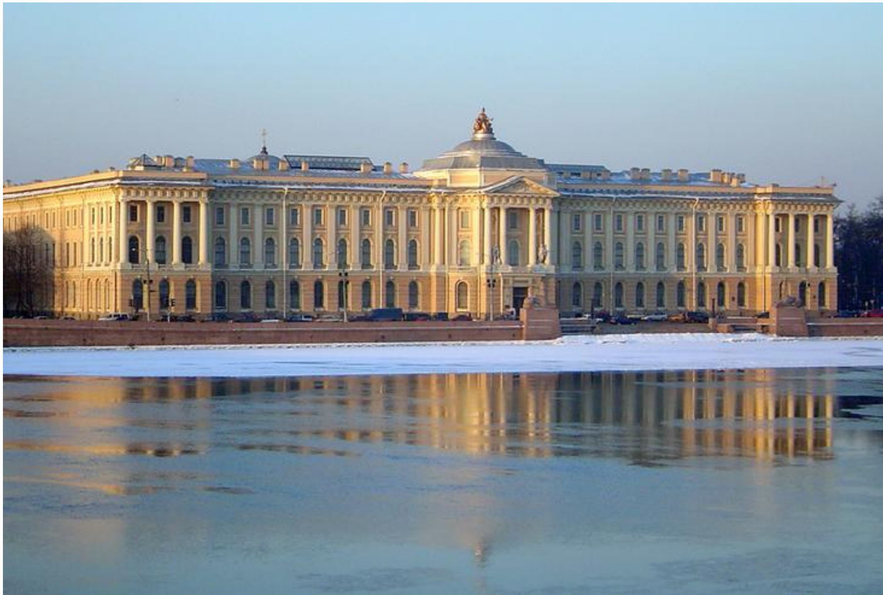
Ж.Б. Деламот Академия художеств в Петербурге. 1764-1788 гг.