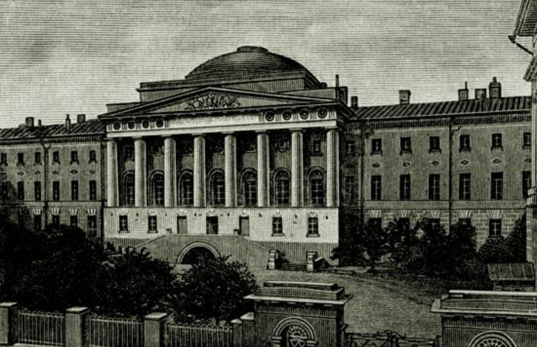
М. Казаков. Московский университет. 18 век