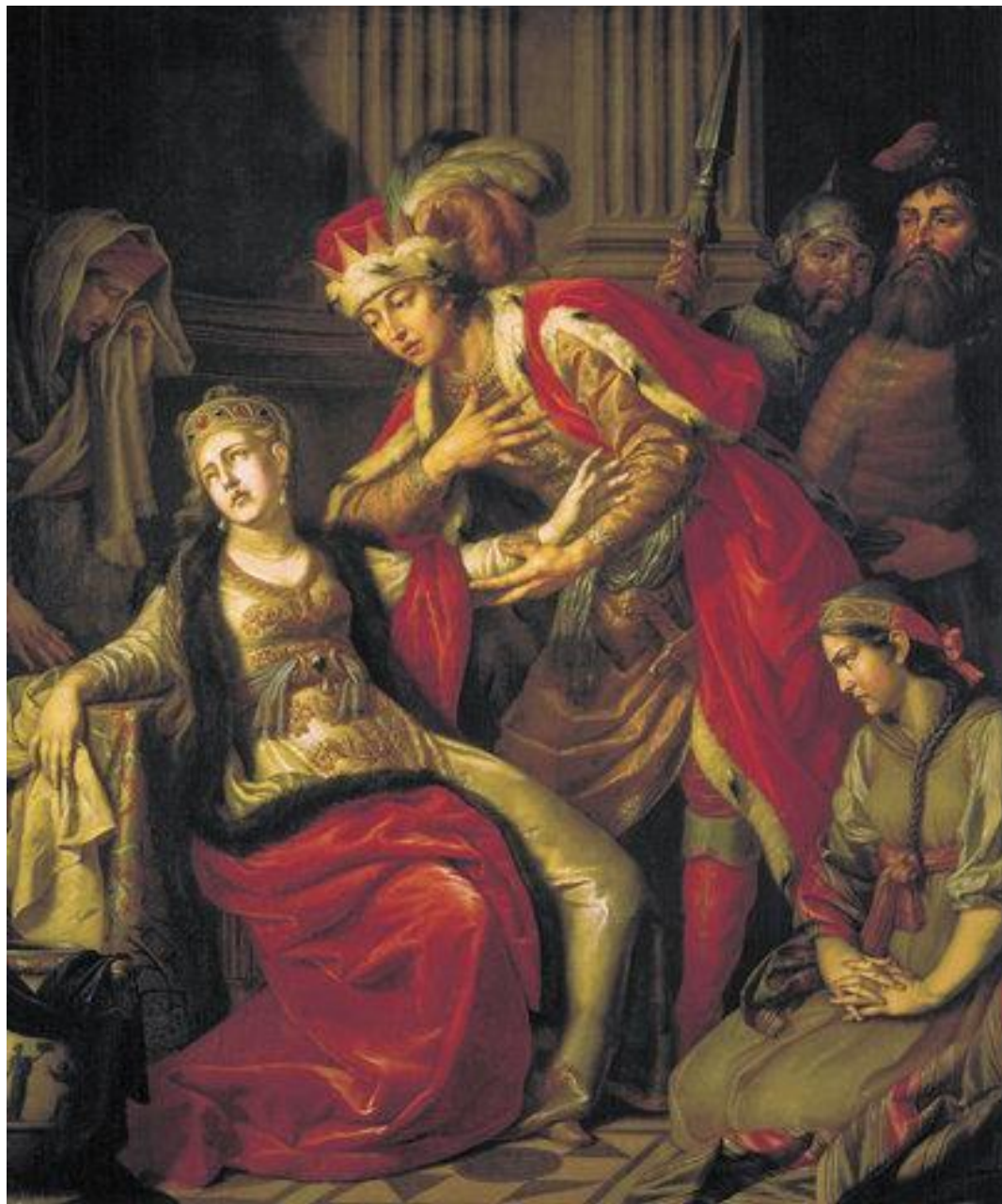
А. Лосенко. Владимир и Рогнеда. 18