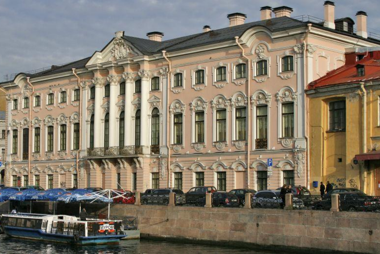
Ф.Б.Растрелли Дом Строганова.1752-1754 гг.