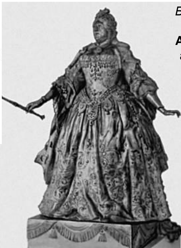
Бартоломео Карло Растрелли Анна Иоанновна с арапчонком. 1741