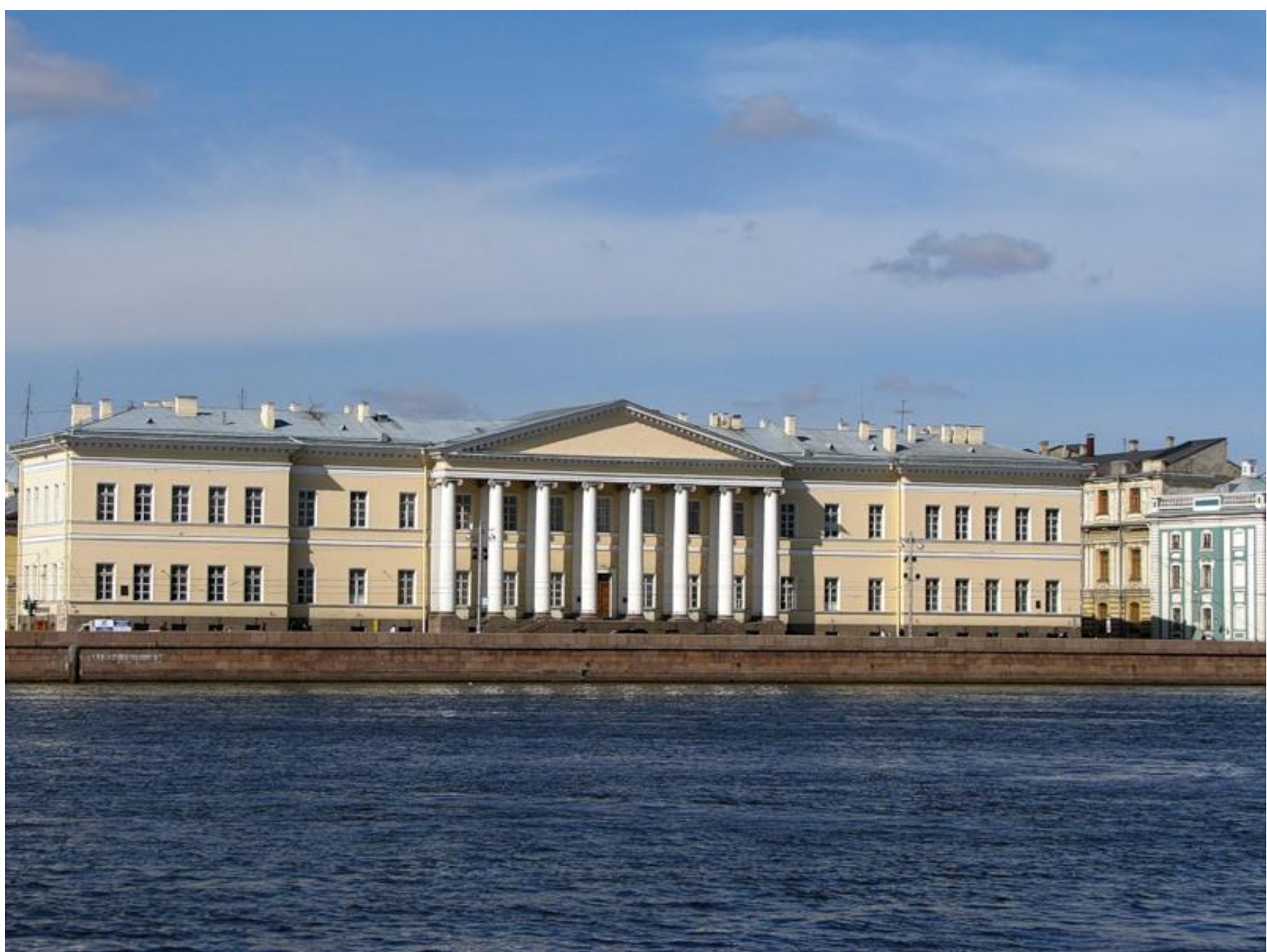
Д. Кваренги. Академия наук. 18 век