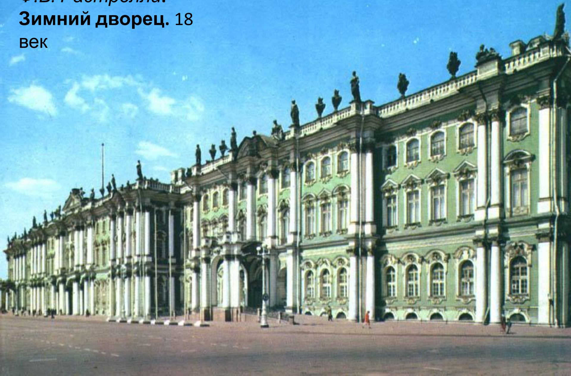
Ф.Б. Растрелли. Зимний дворец. 18 век