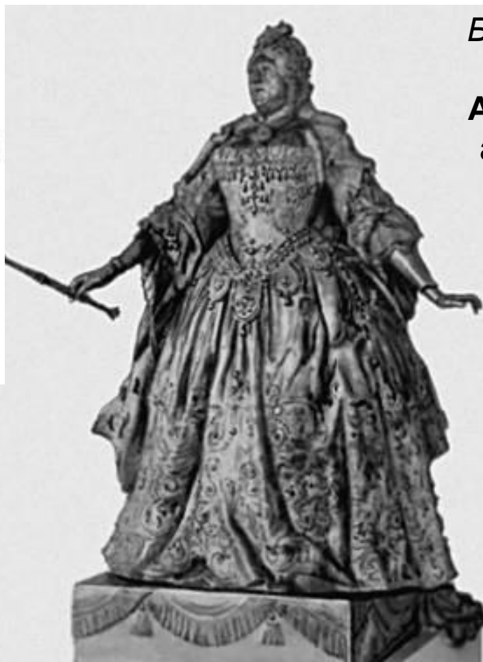
Бартоломео Карло Растрелли Анна Иоанновна с арапчиком. 1741