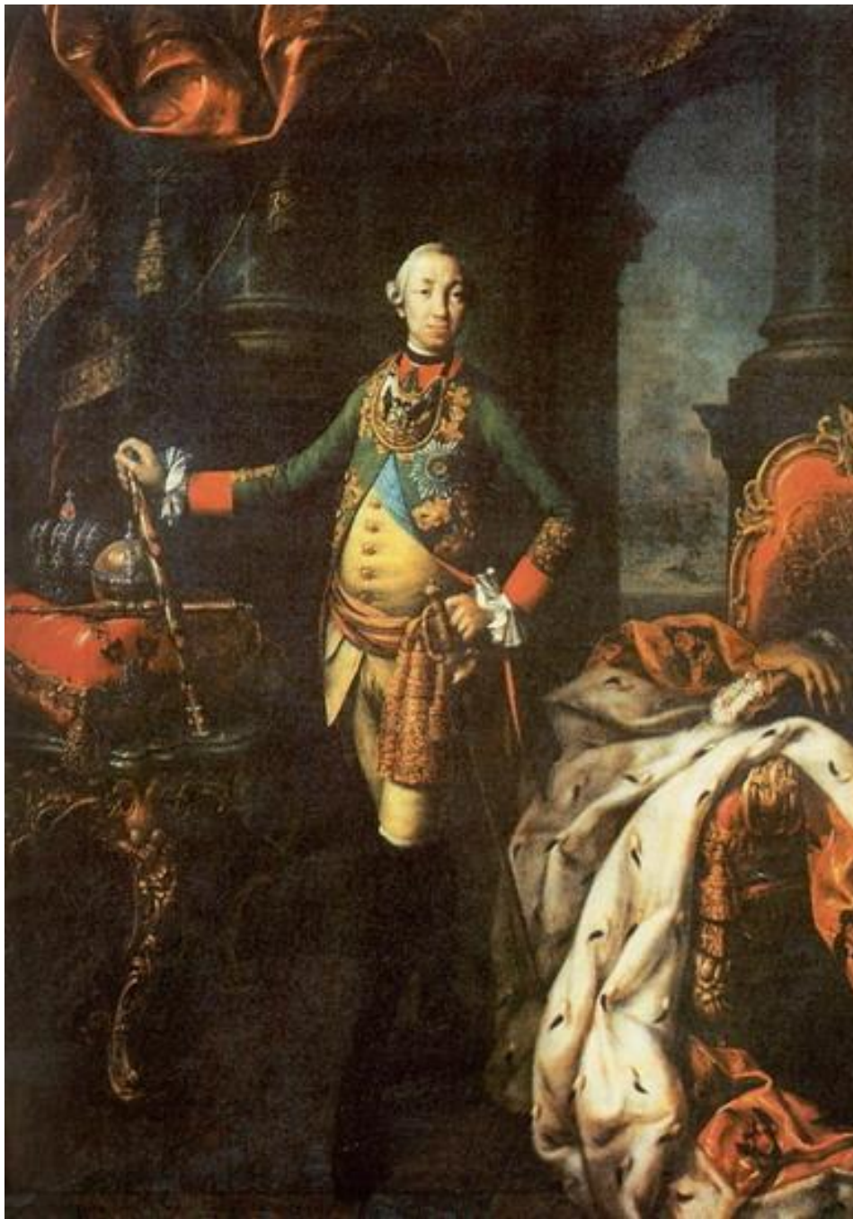
А. П. Антропов. Портрет Петра III 1762 г.