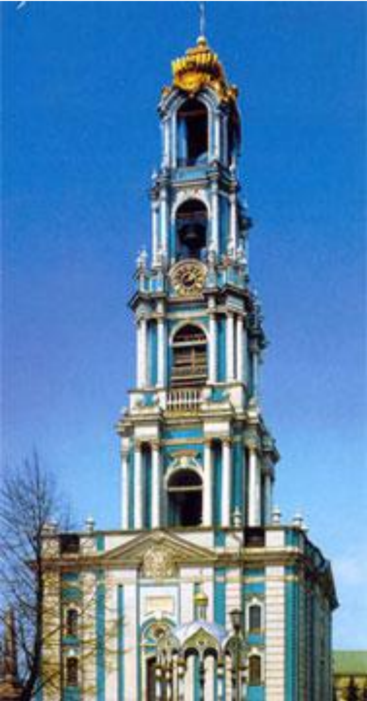
Д. Ухтомский. Колокольня Троице-Сергиевой лавры. 18 век