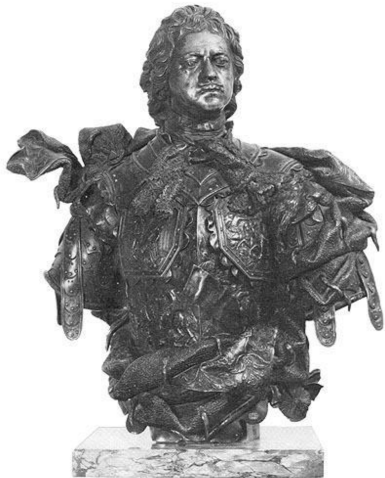
Бартоломео Карло Растрелли. Портрет Петра I. 1723-1730