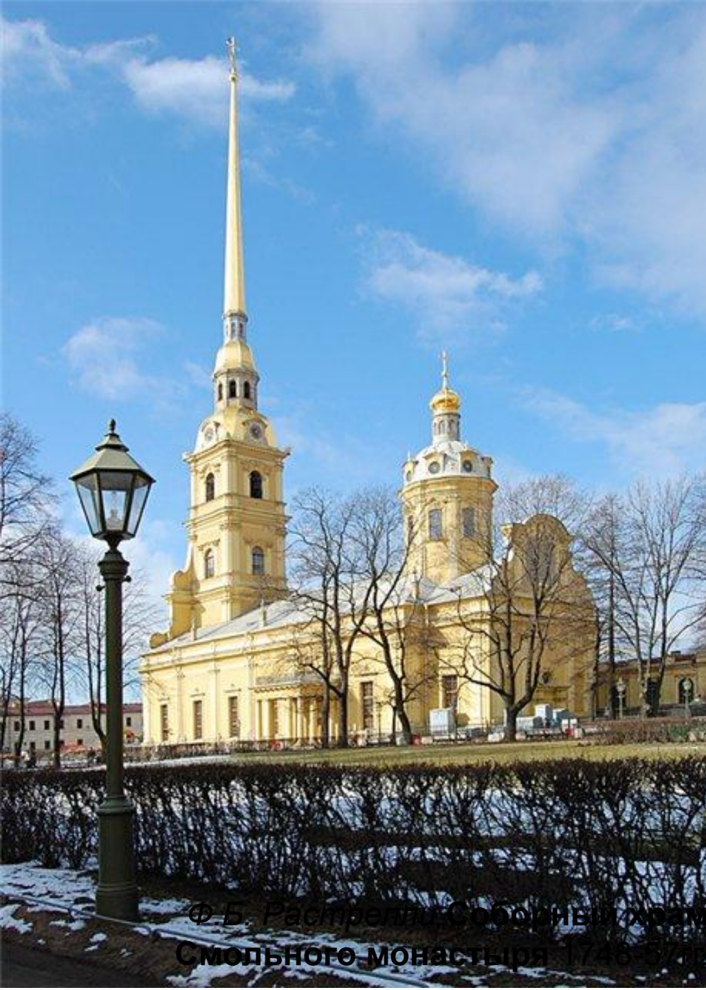
Д. Трезини. Собор Петра и Павла. Петропавловская крепость. 18 век

Ф. Б. Растрелли. Соборный храм Смоленского монастыря. 1748-51 гг.