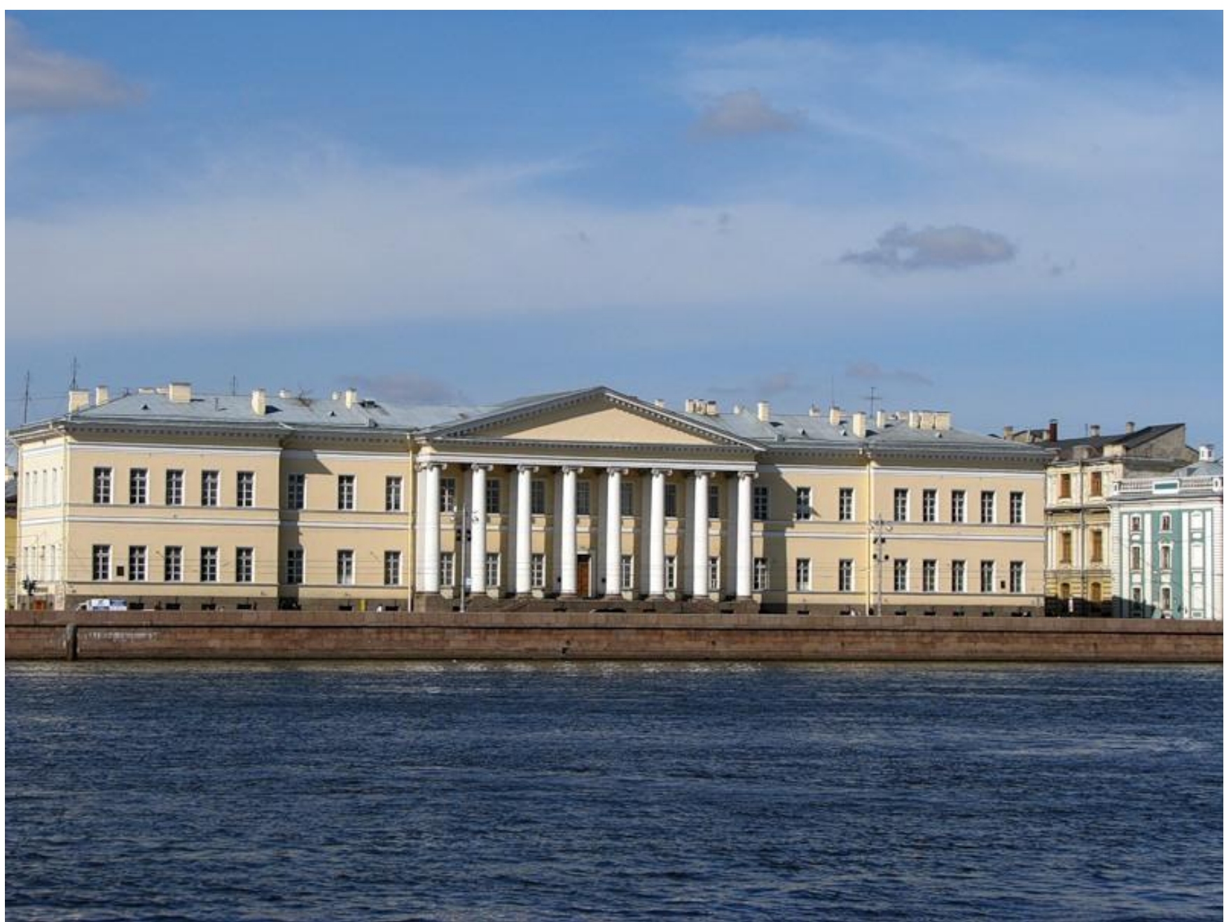
Д. Кваренги. Академия наук. 18 век