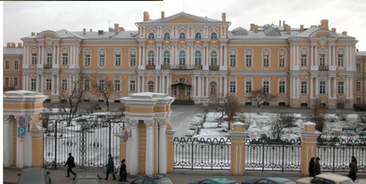
Ф.Б. Растрелли. Воронцовский дворец. 18 век