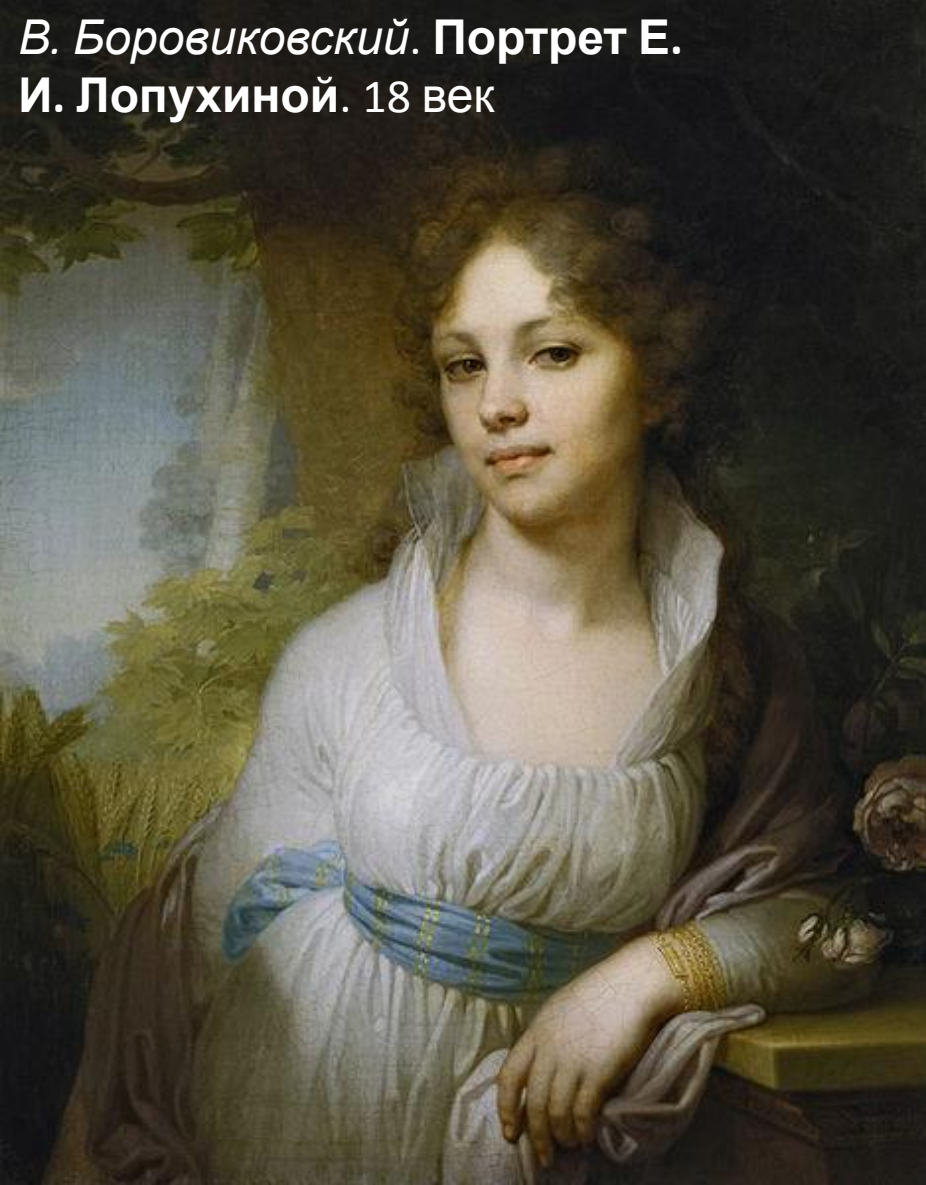
В. Боровиковский. Портрет Е. И. Лопухиной. 18 век