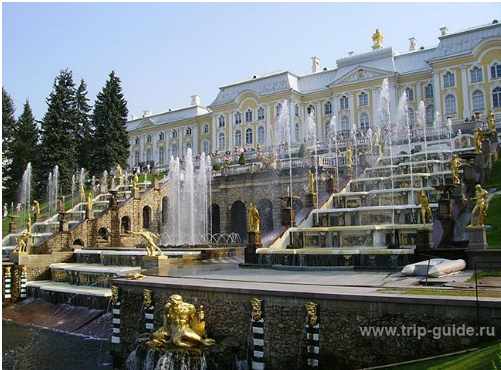
Ф.-Б.Растрелли, Ж.-Б.Леблон. Большой дворец. Петергоф.