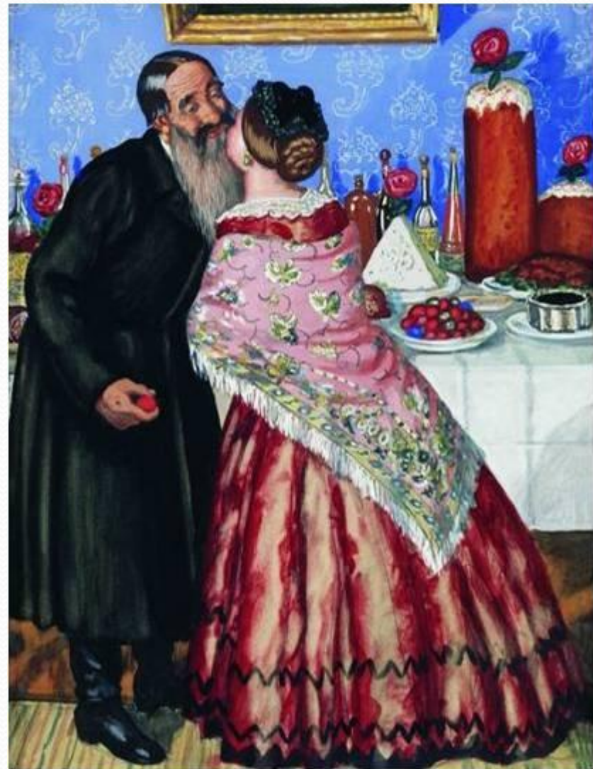
Кустодиев Борис Михайлович Пасхальный обряд (Христосование)