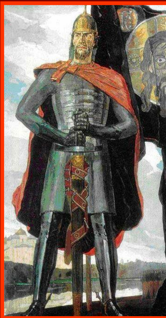
Павел Корин «А. Невский», часть триптиха