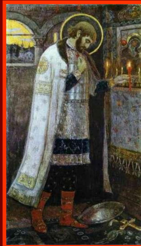
М. Нестеров Святой благоверный Князь А. Невский