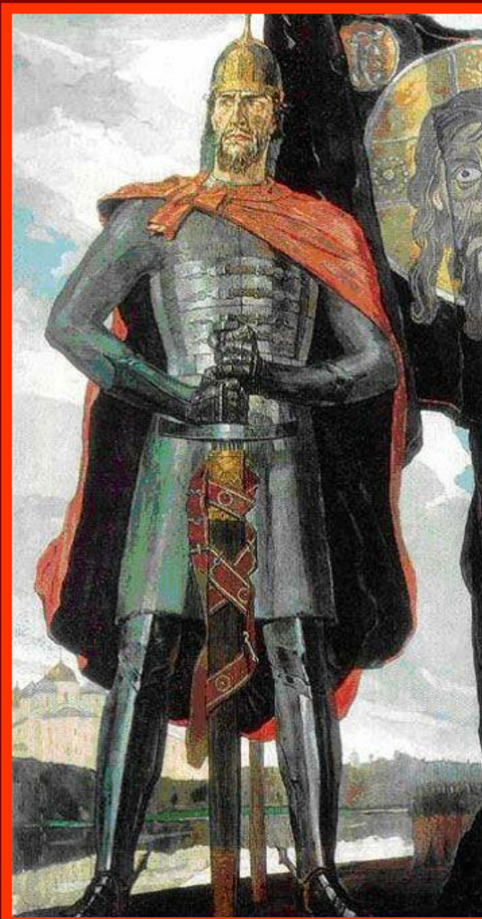
Павел Корин «А. Невский», часть триптиха