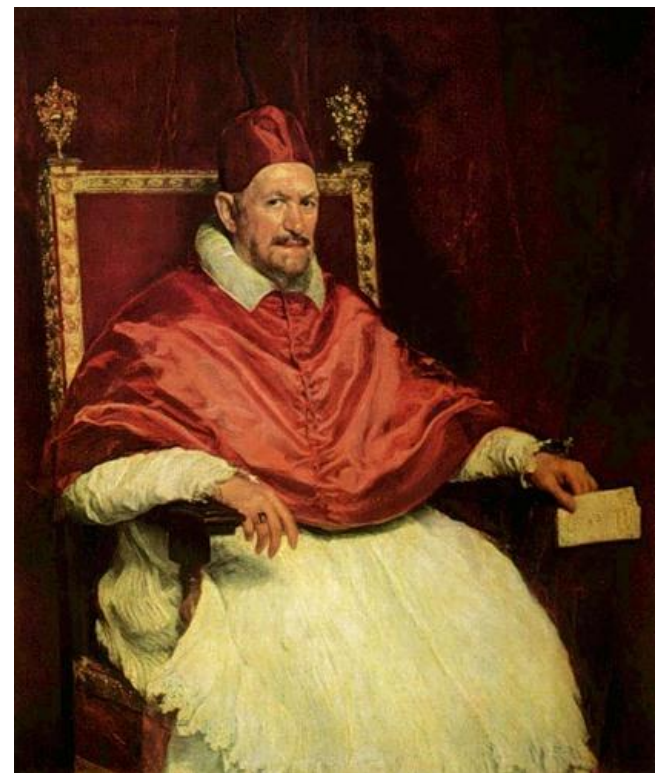
Портрет папы Иннокентия X.