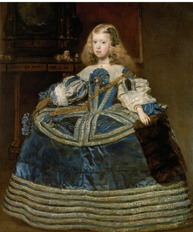
Портрет инфанта Маргариты в трехлетнем возрасте.

Творч. работа (упр.3), стр.13 – описать картину Веласкеса (реферат)