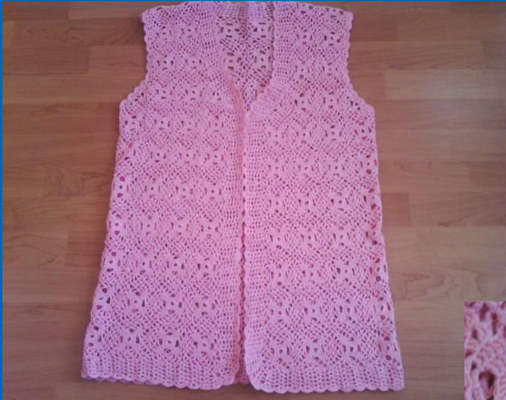
Жилет «Розовая пантера»