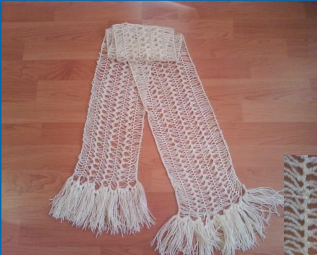
«Ажурный шарф» (вязание на вилке)