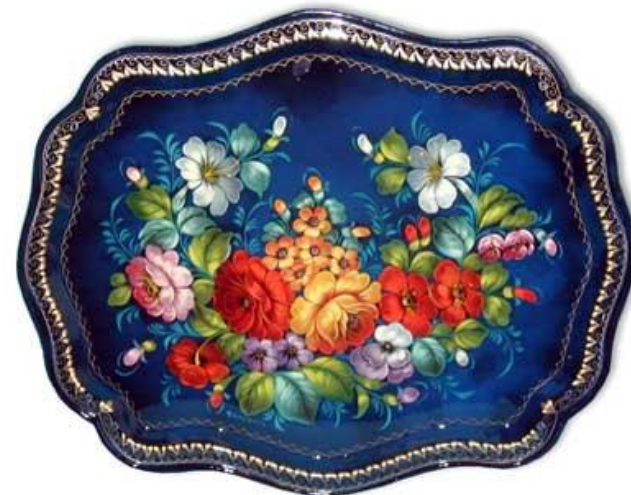
букет в раскидку