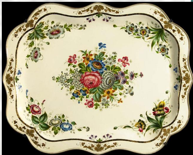
роспись с углов