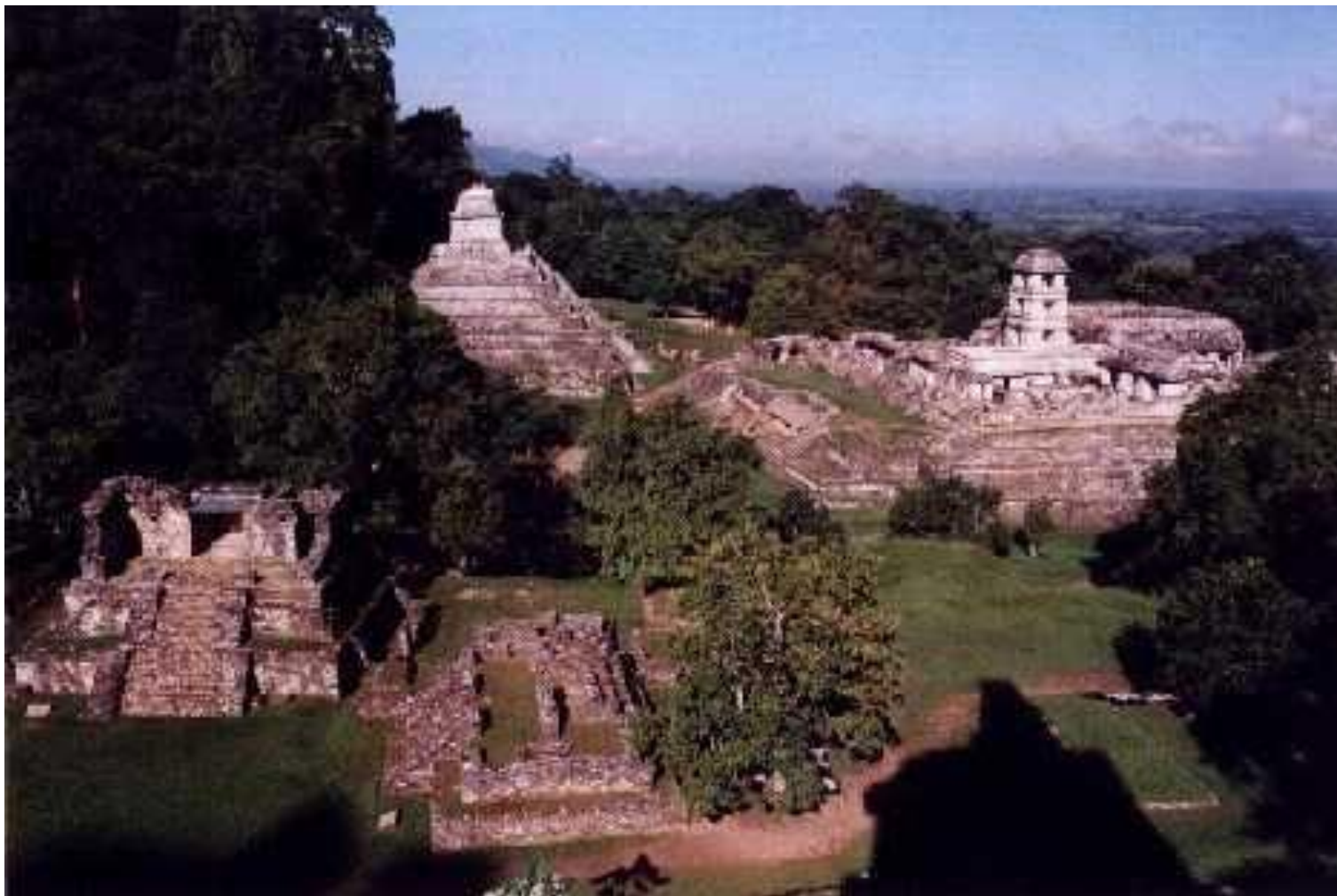
Руины храмов майя.