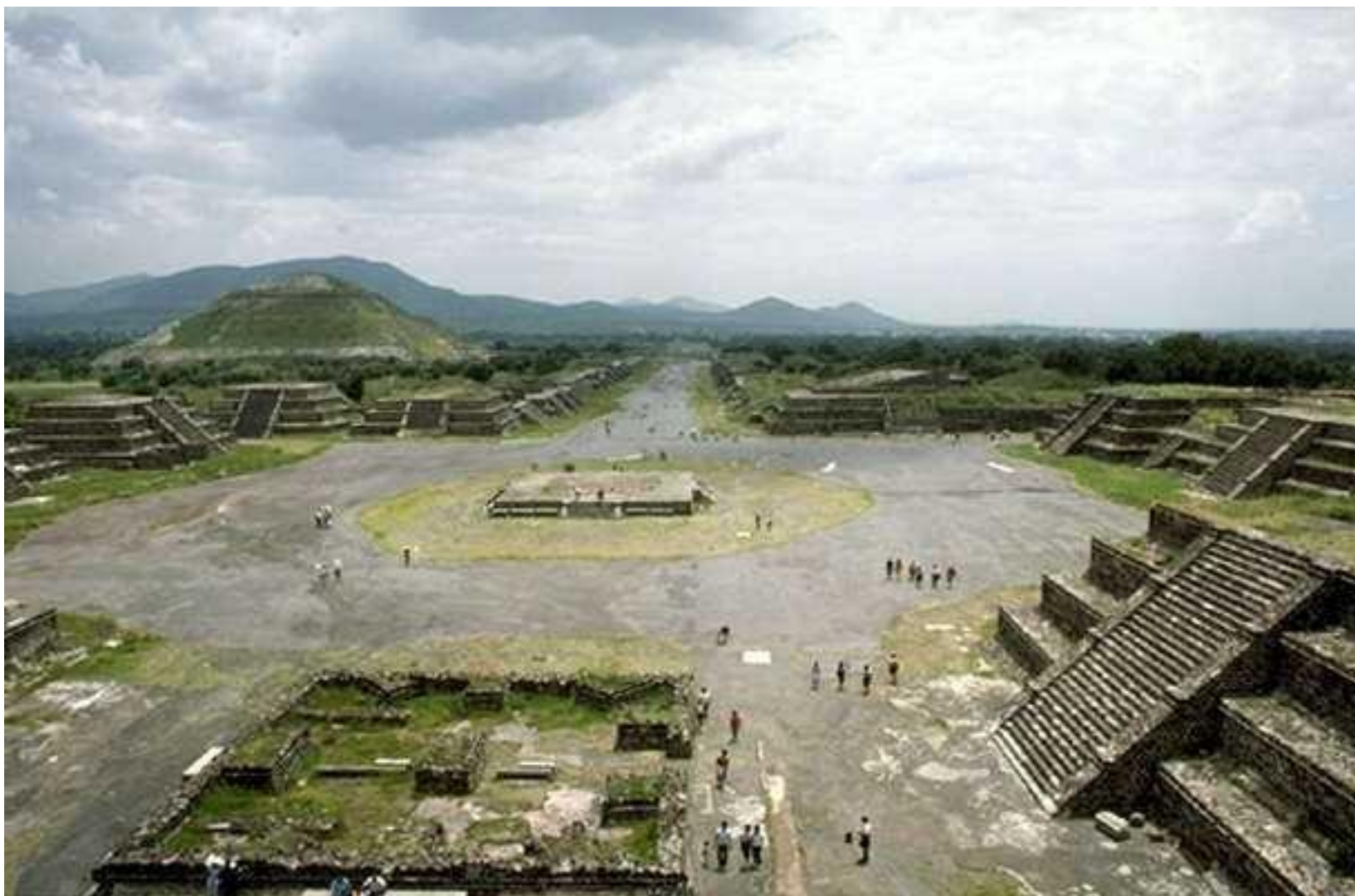
Древний храм богов Солнца и Луны.