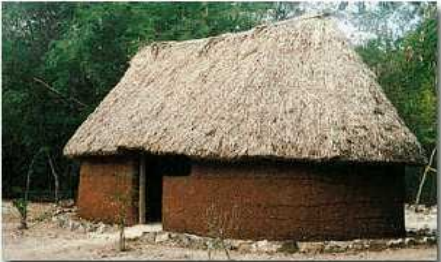
Типичный дом майя.