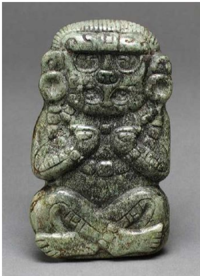
Фигурка божества майя.