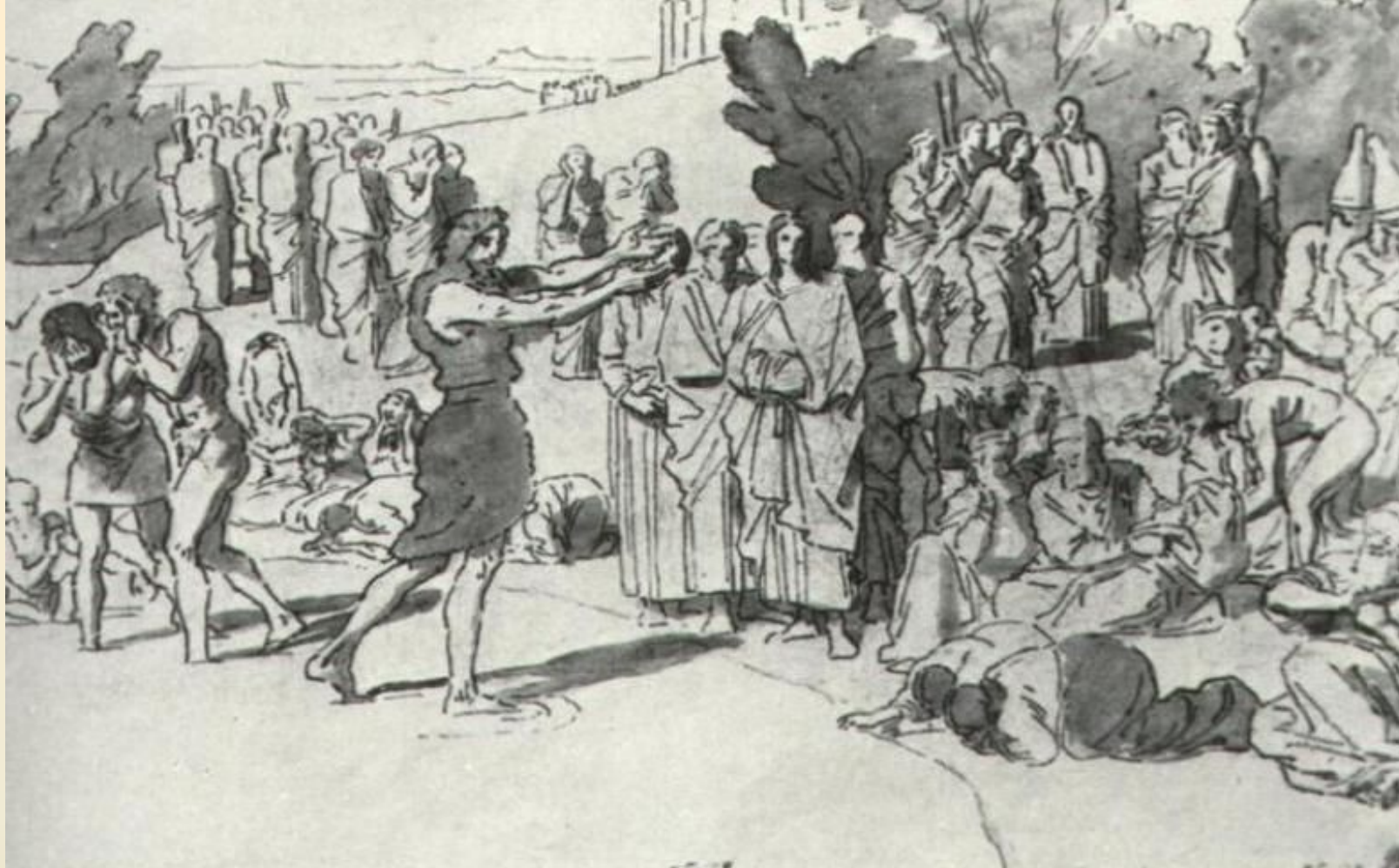
Иванов А. Проповедь Иоанна Крестител я. 1850-е

Иоанн пришел в страну иорданскую и стал проповедовать: "Покайтесь, потому что приблизилось Царство Небесное", то есть приблизилось, настало время, когда должен явиться ожидаемый Спаситель, который будет призывать всех в Свое царство.