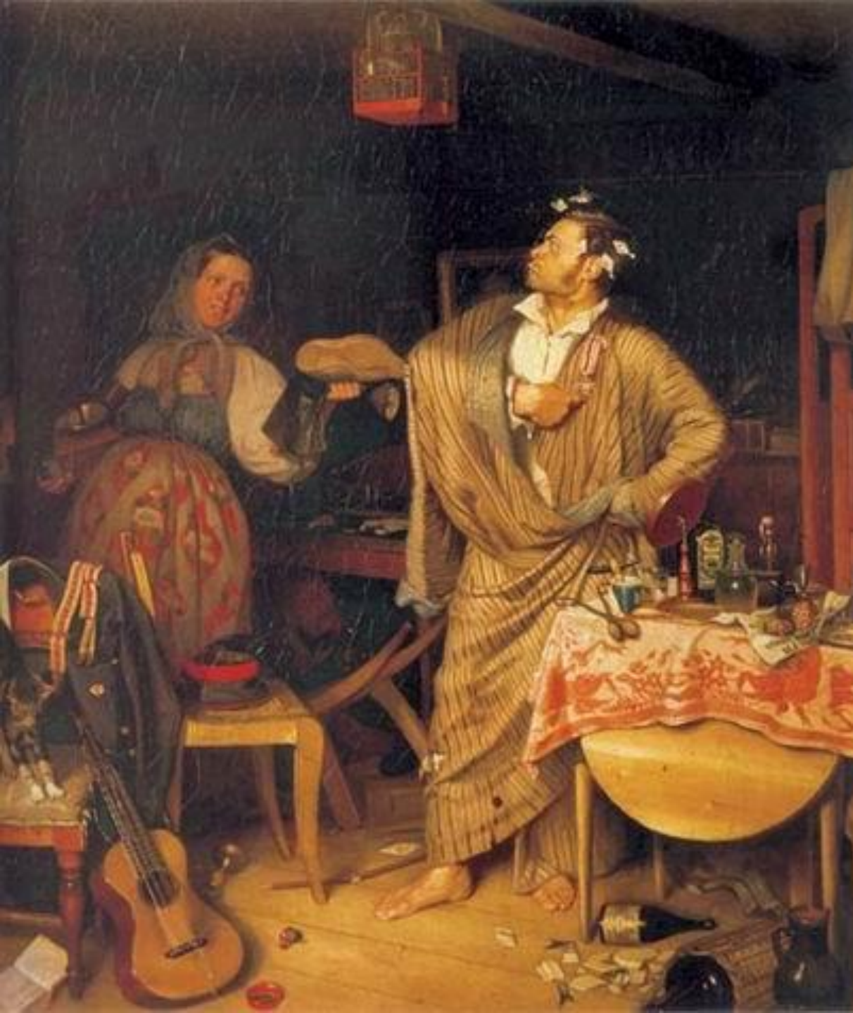
Федотов П.А.: «Свежий кавалер»