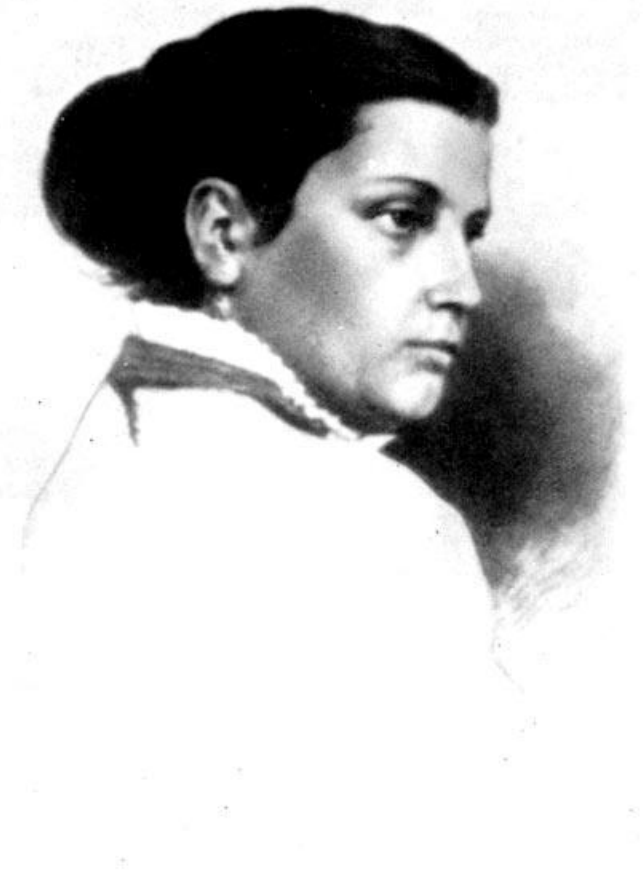
Панаева Авдотья Яковлевна