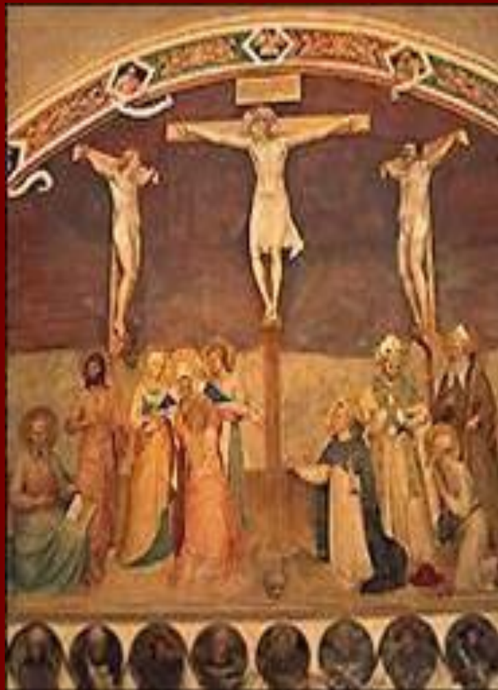
Фреска монастыря Сан – Марко.