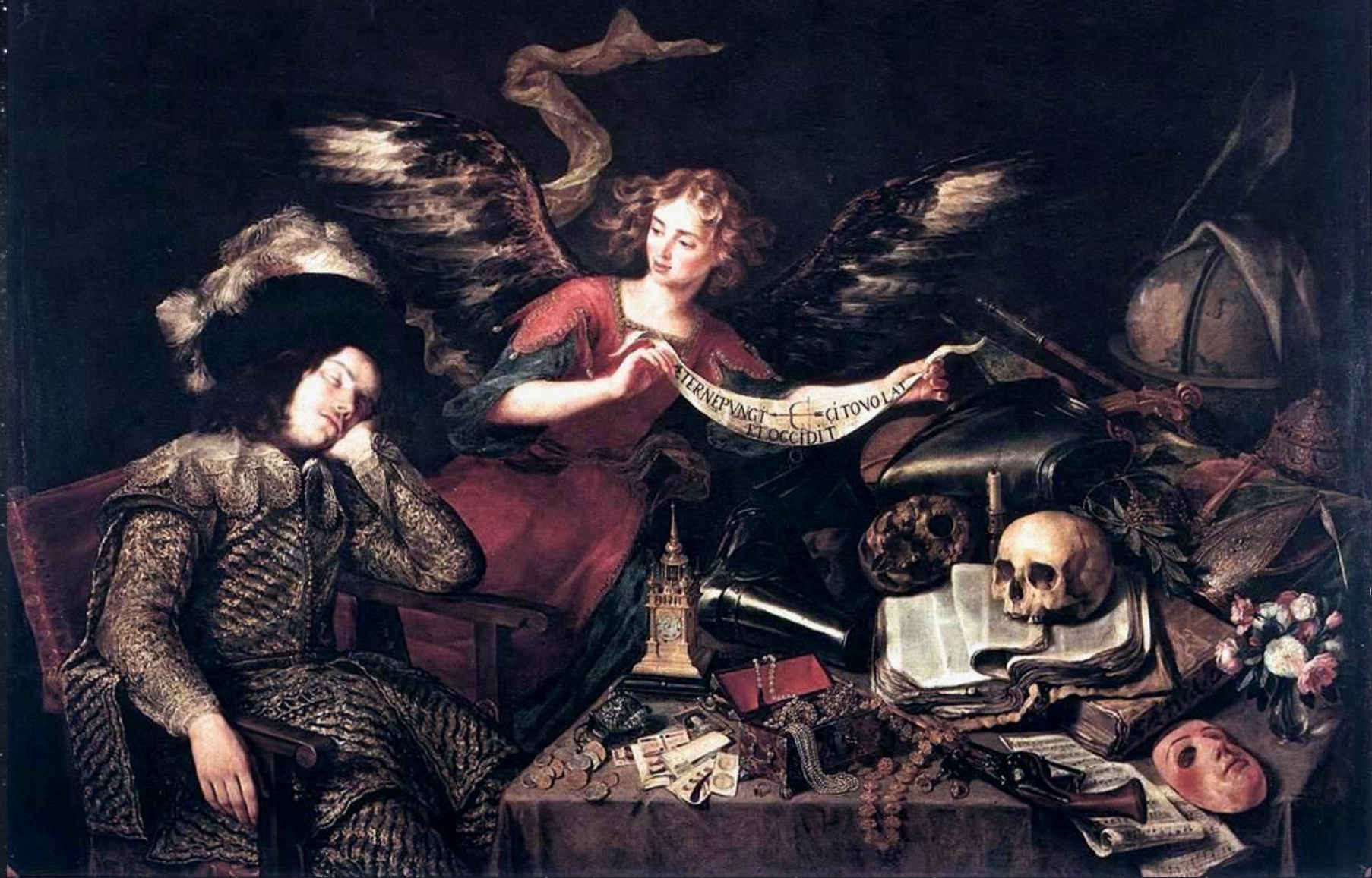
Антонио де Переда. Сон рыцаря