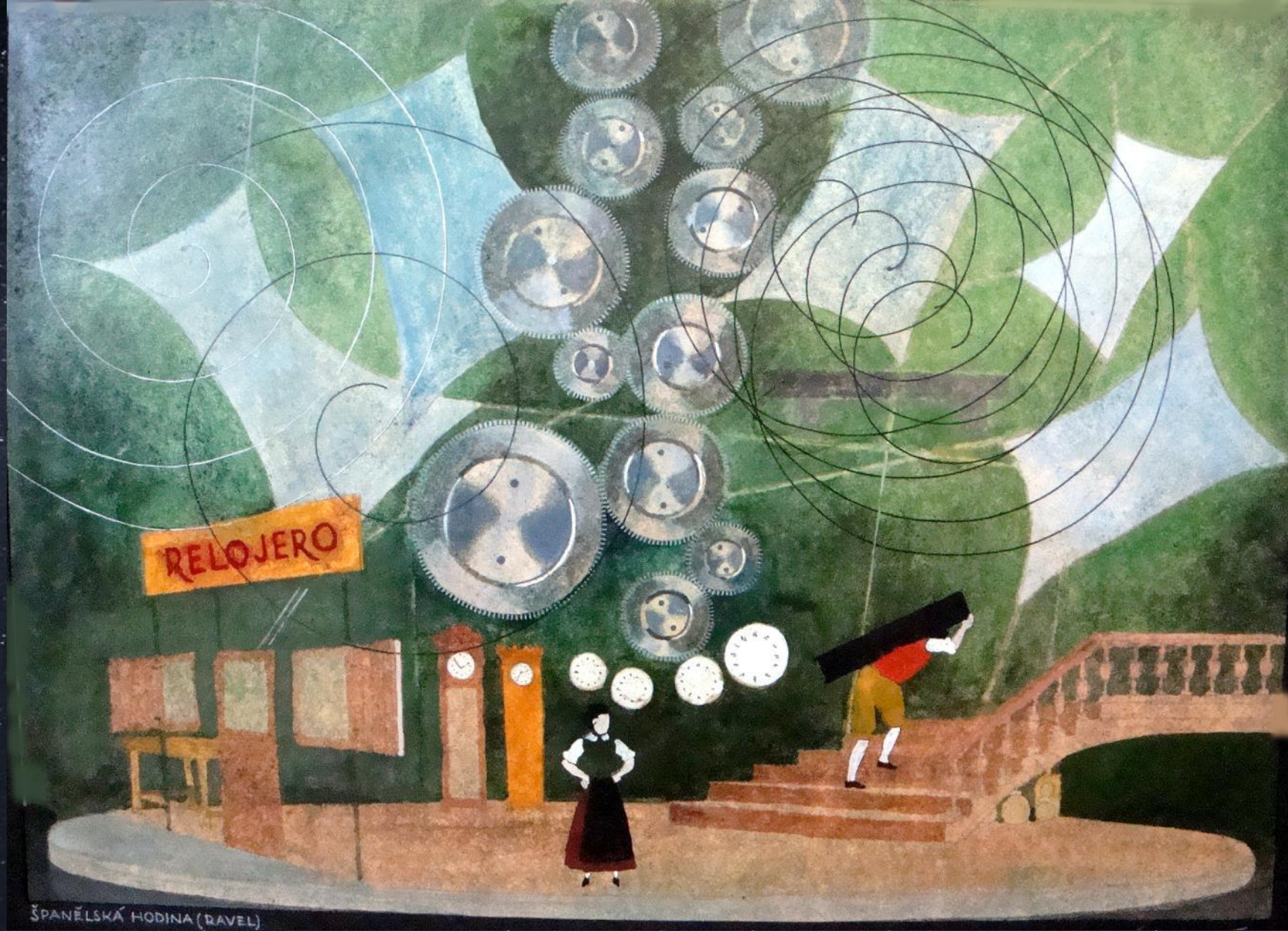
Эдуард Томек. Испанские часы. 1948