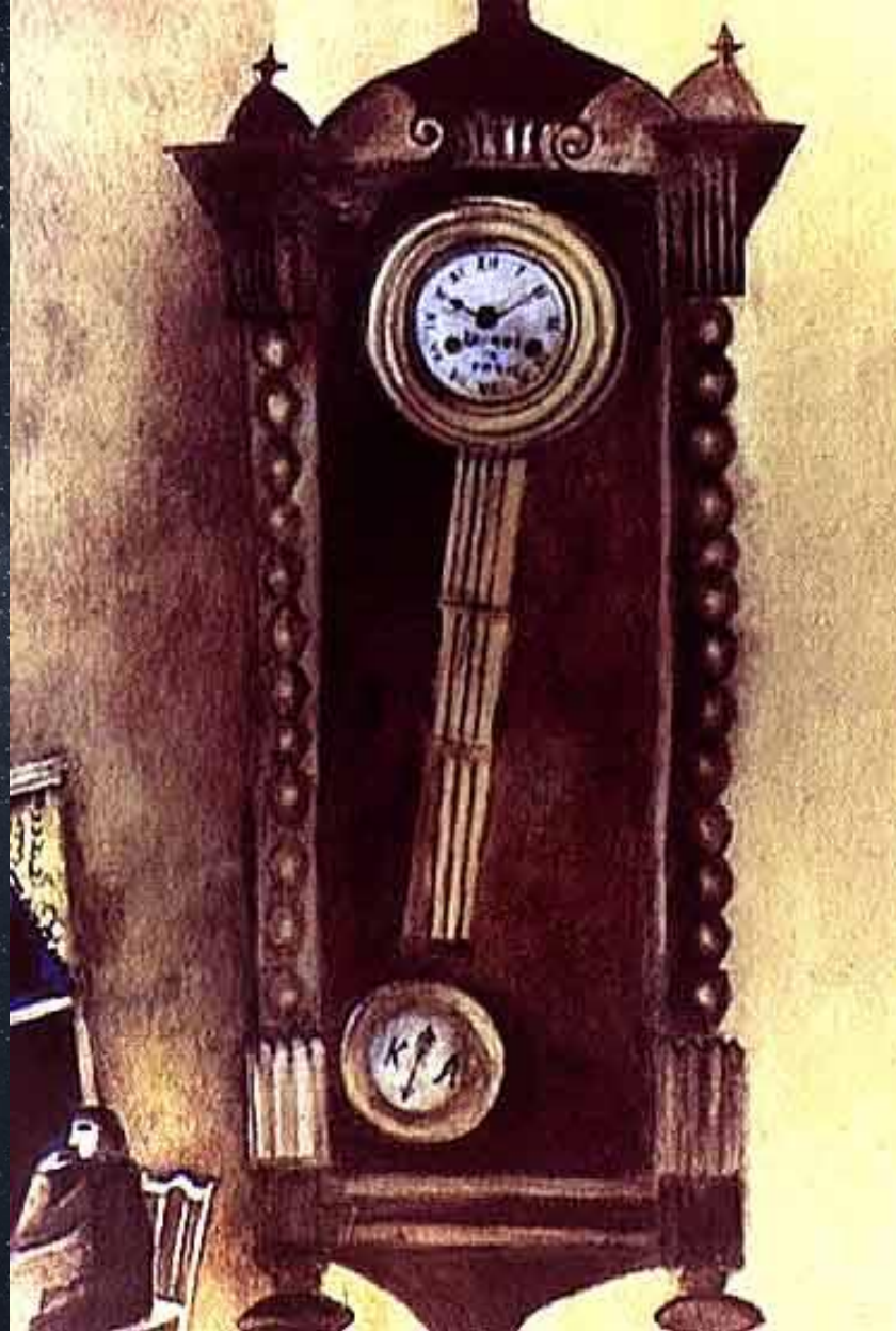
Марк Шагал. Часы (Время). 1911