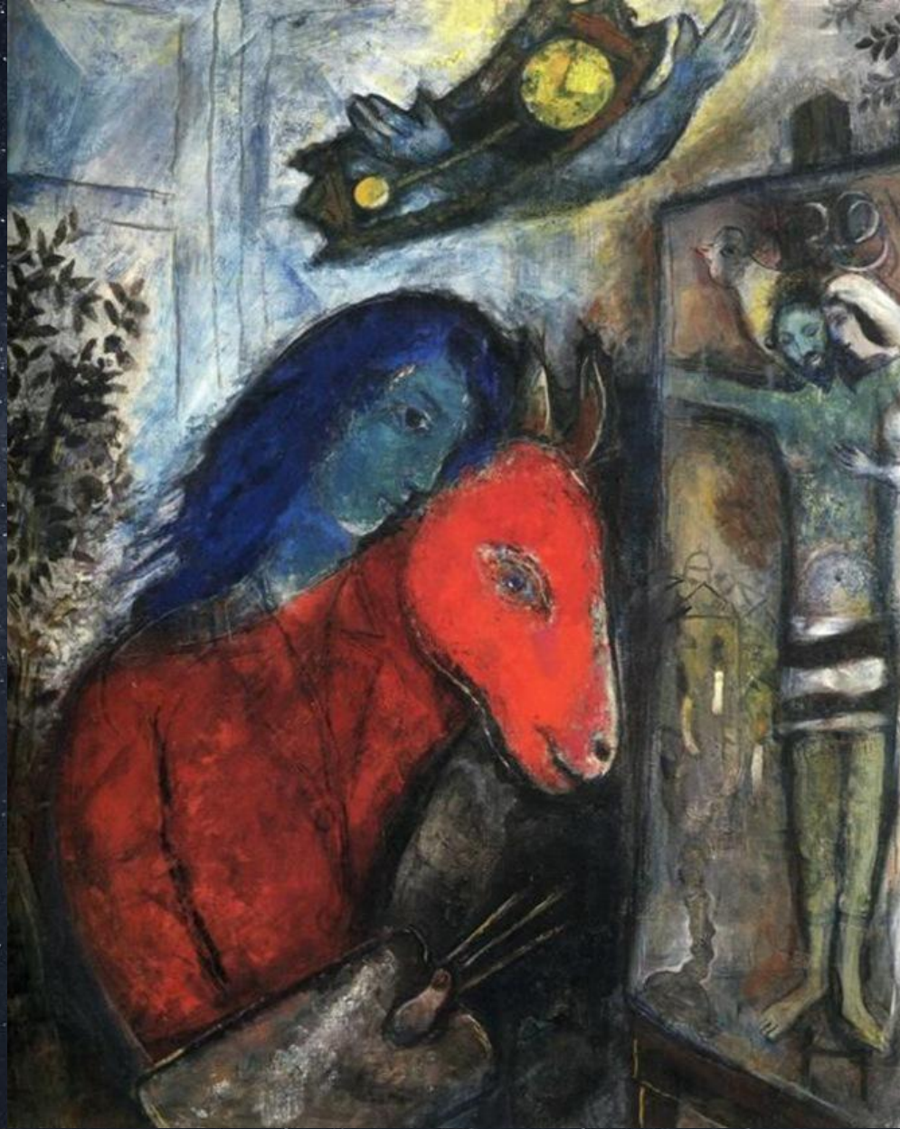
Марк Шагал. Автопортрет с напольными часами. Перед распятием. 1947