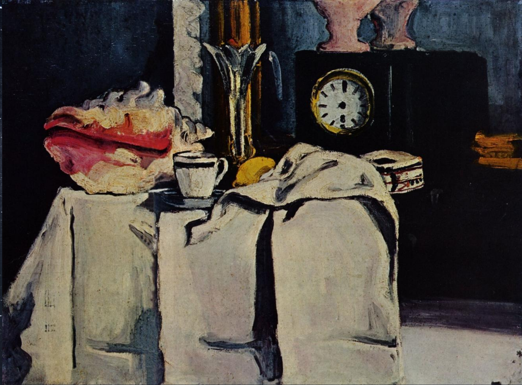
Поль Сезанн. Натюрморт с часами из черного мрамора. 1869–1871