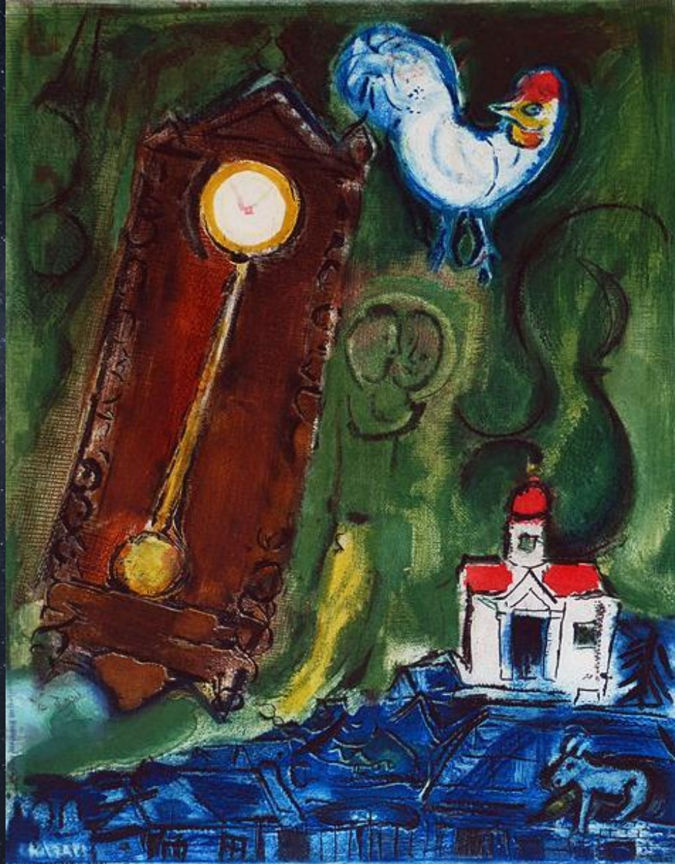
Марк Шагал. Часы. 1956