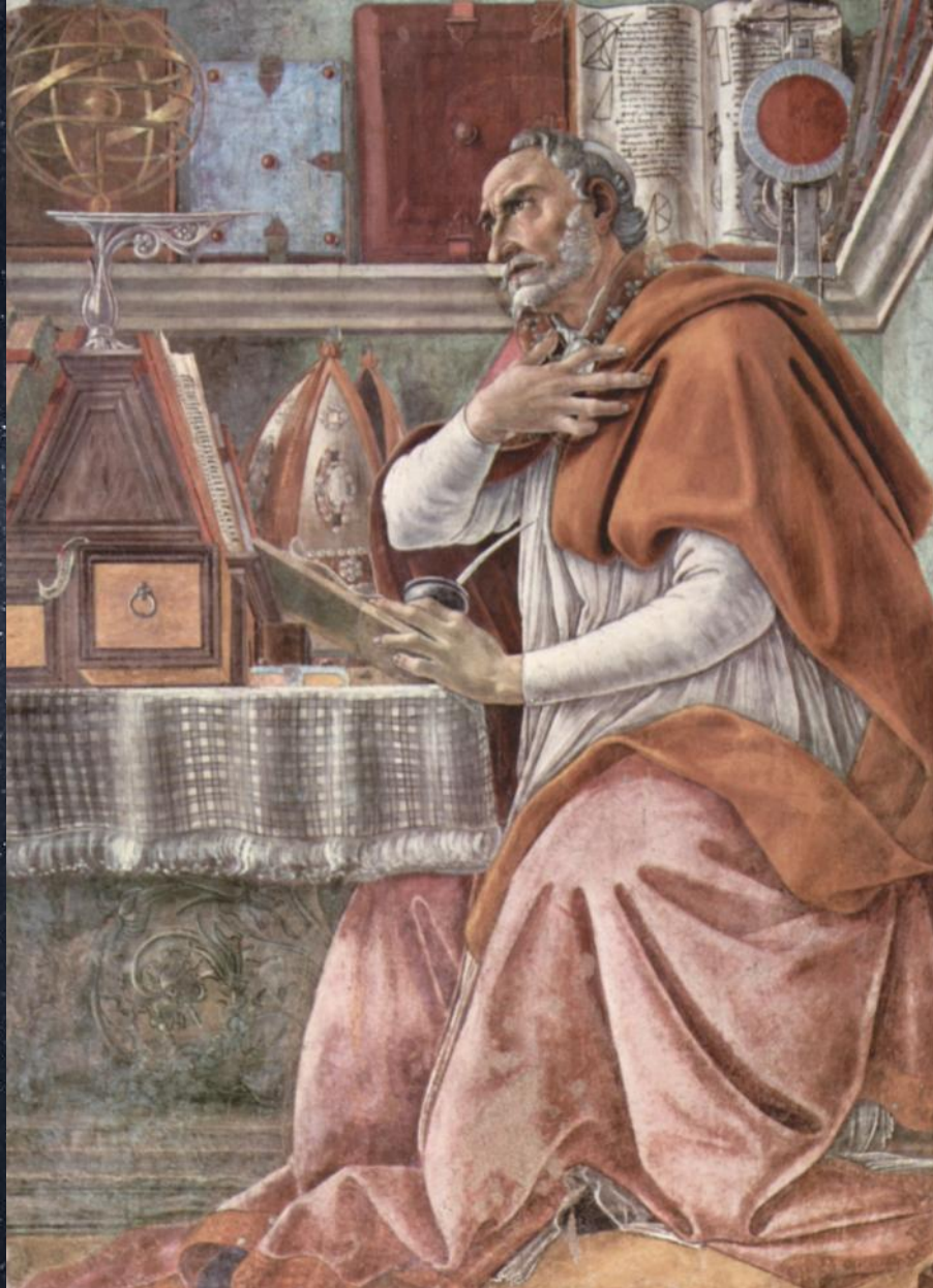
Сандро Боттичелли. Св. Августин Блаженный. Фрагмент фрески. Ок. 1480