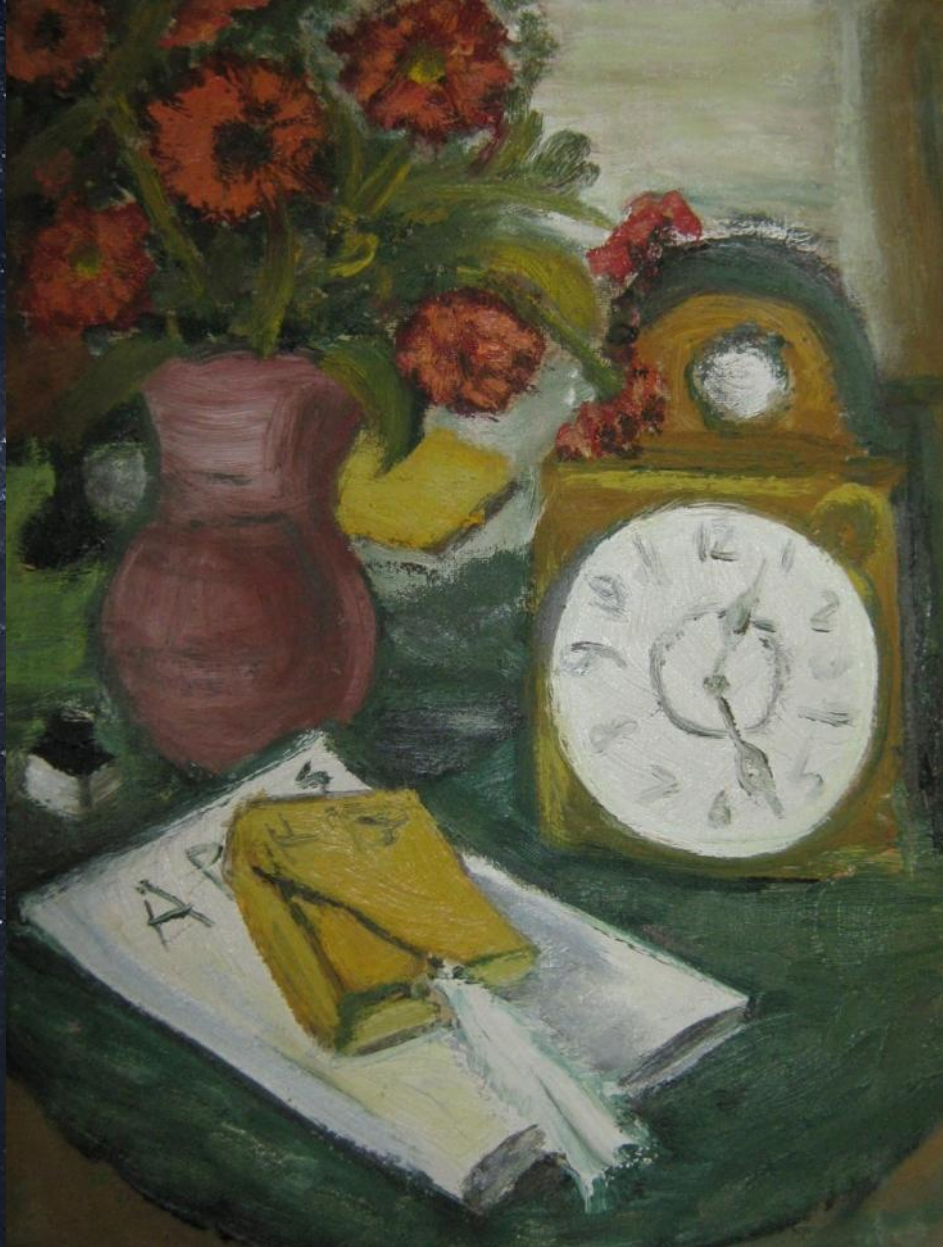
Теодор Паллади. Натюрморт с часами.