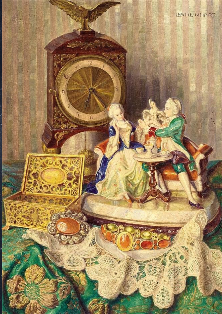
Леа Рейнхарт. Натюрморт с фарфоровыми фигурками, часами и кружевом на вышитой ткани.