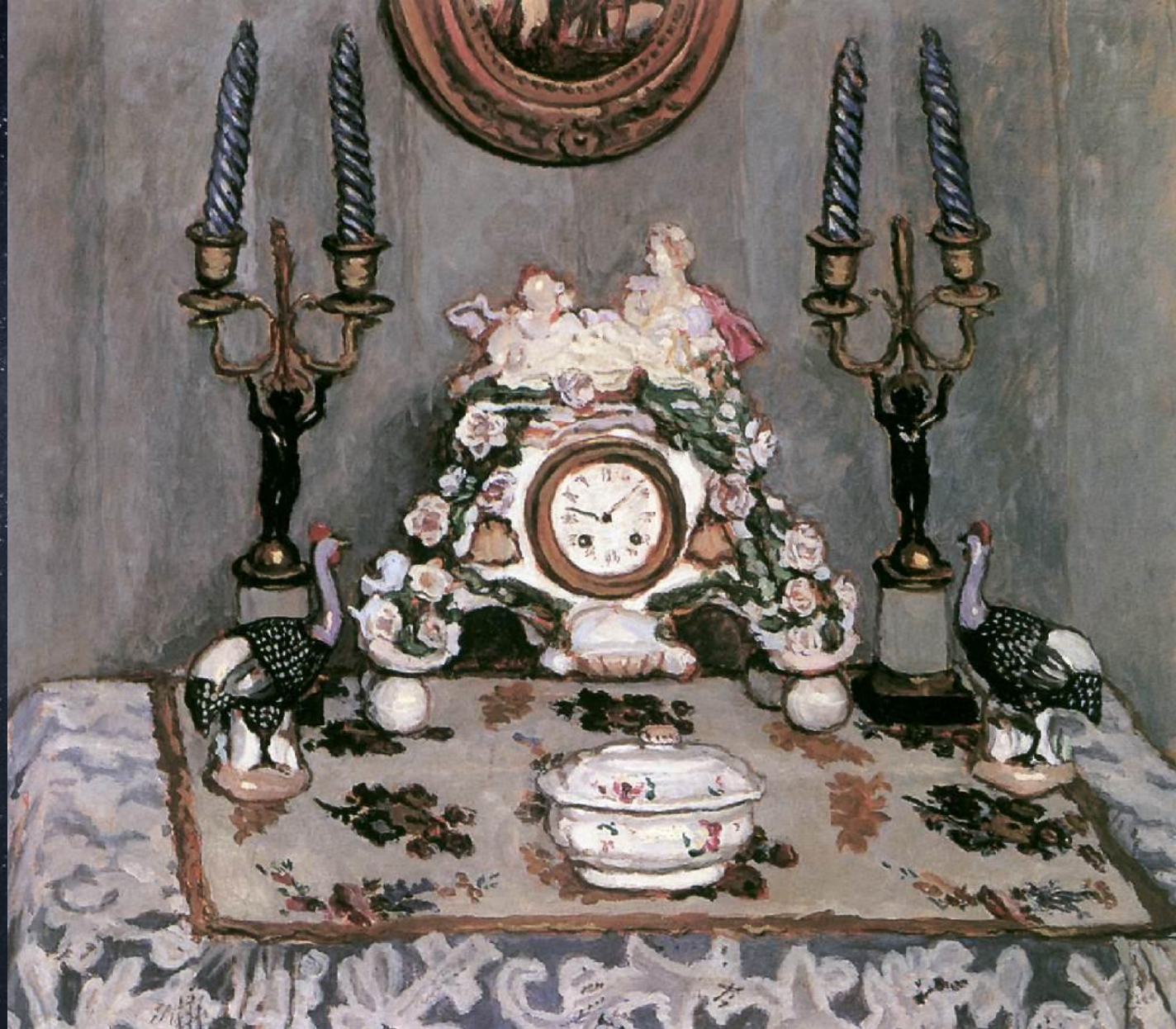
Адольф Феньеш. Натюрморт с фарфоровыми часами. 1910