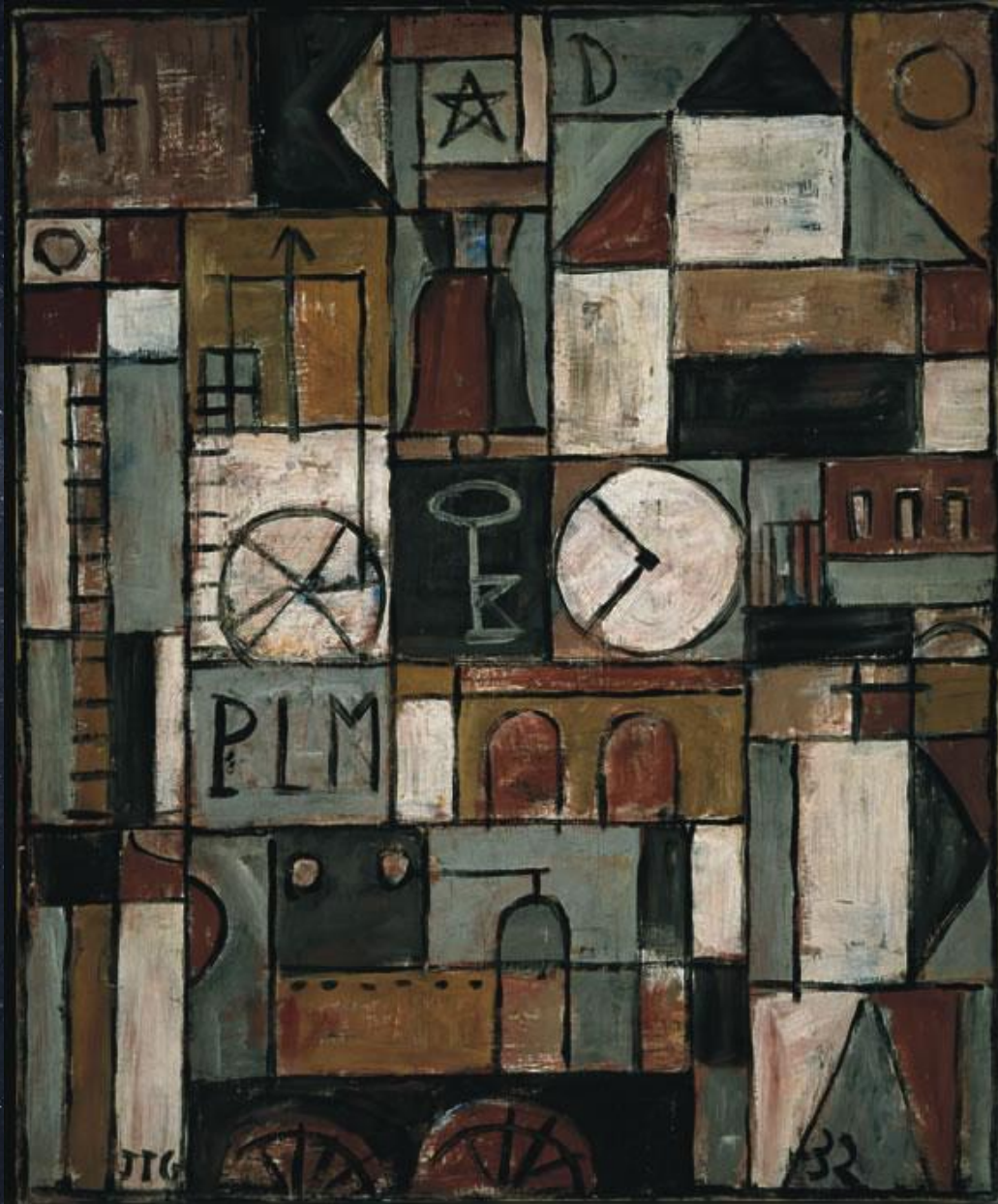
Хоакин Торрес Гарсия. Конструкция с колокольней, 1932