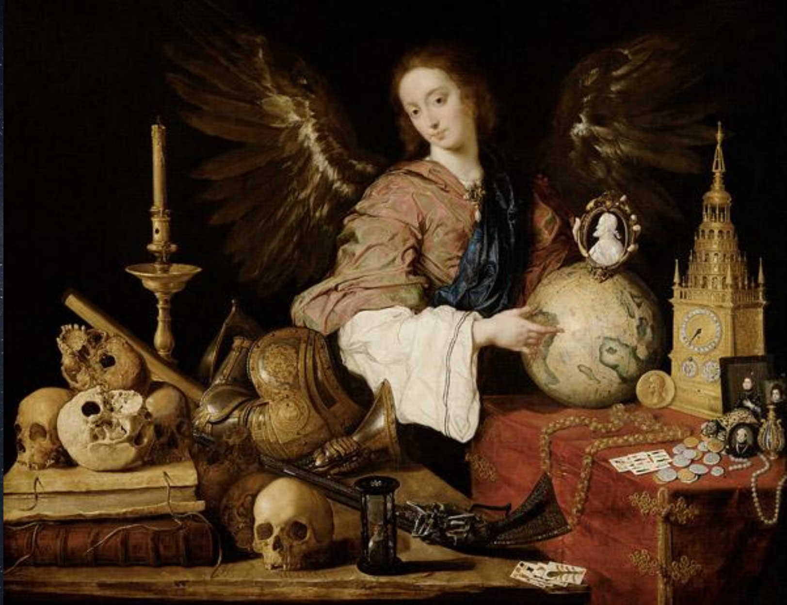
Антонио де Переда. Аллегория брэнности. Ок.1634