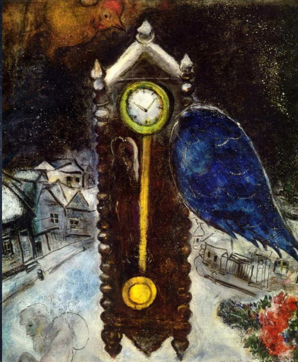
Марк Шагал. Часы с синим крылом. 1949