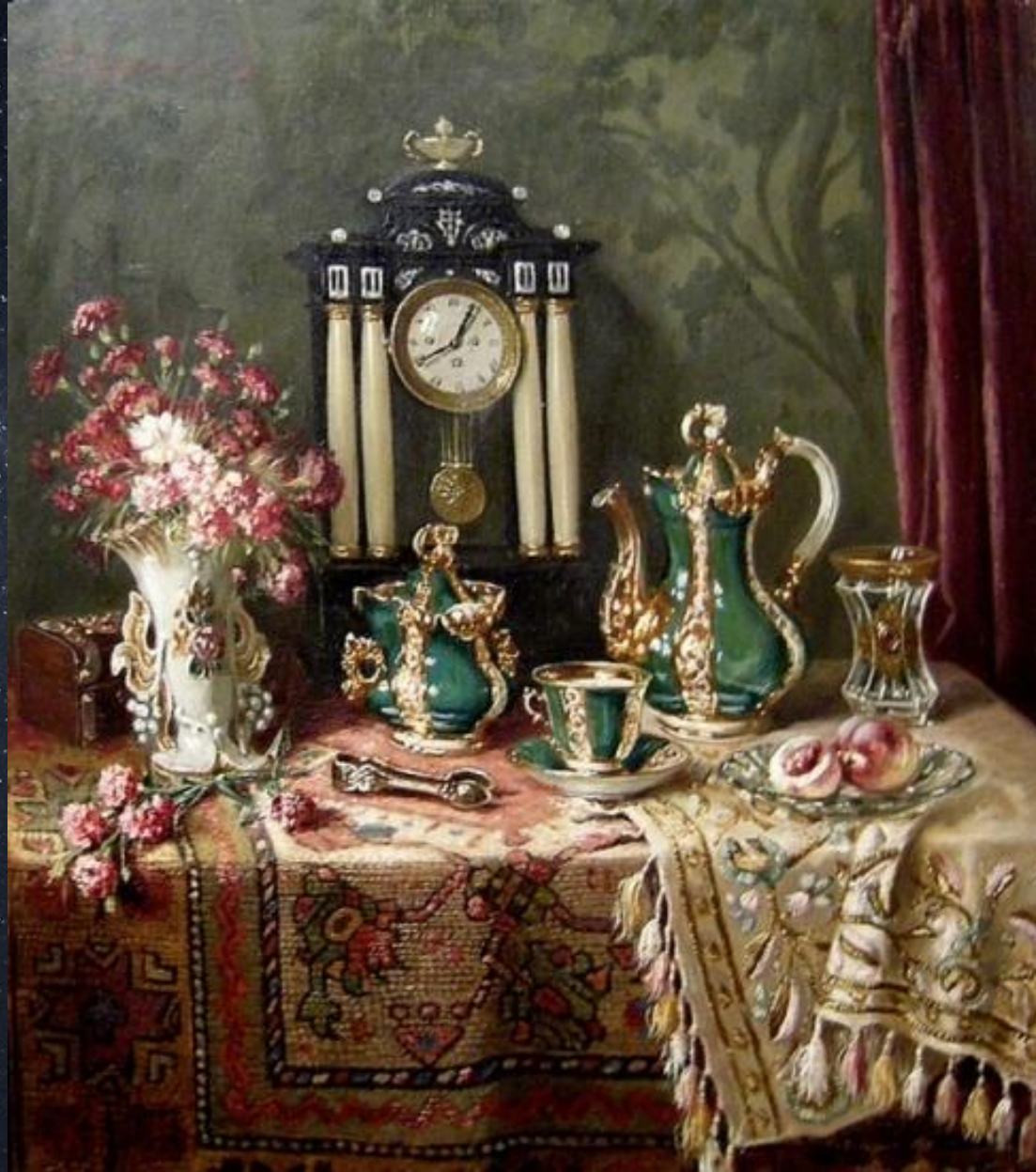
Эрнст Черноцки. Натюрморт с вазой с цветами, фарфоровым сервизом и часами