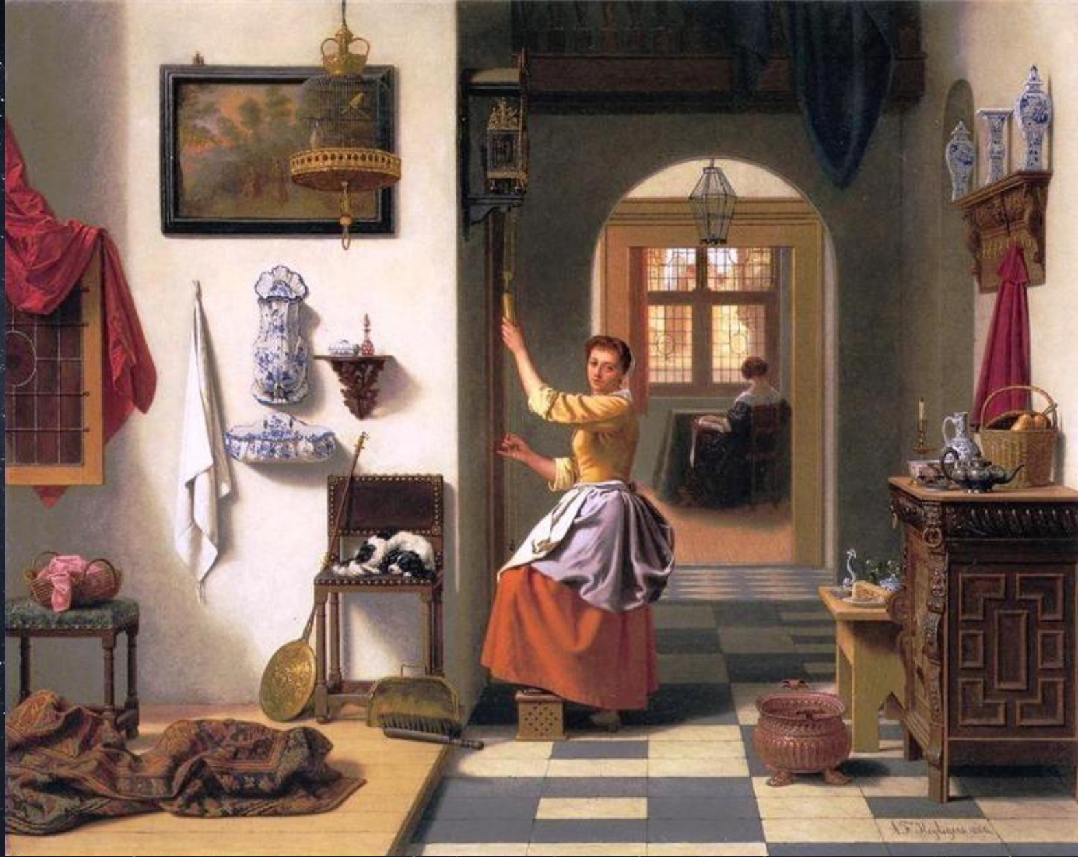
Антон Франсуа Хейлигер. Завод часов. 1866