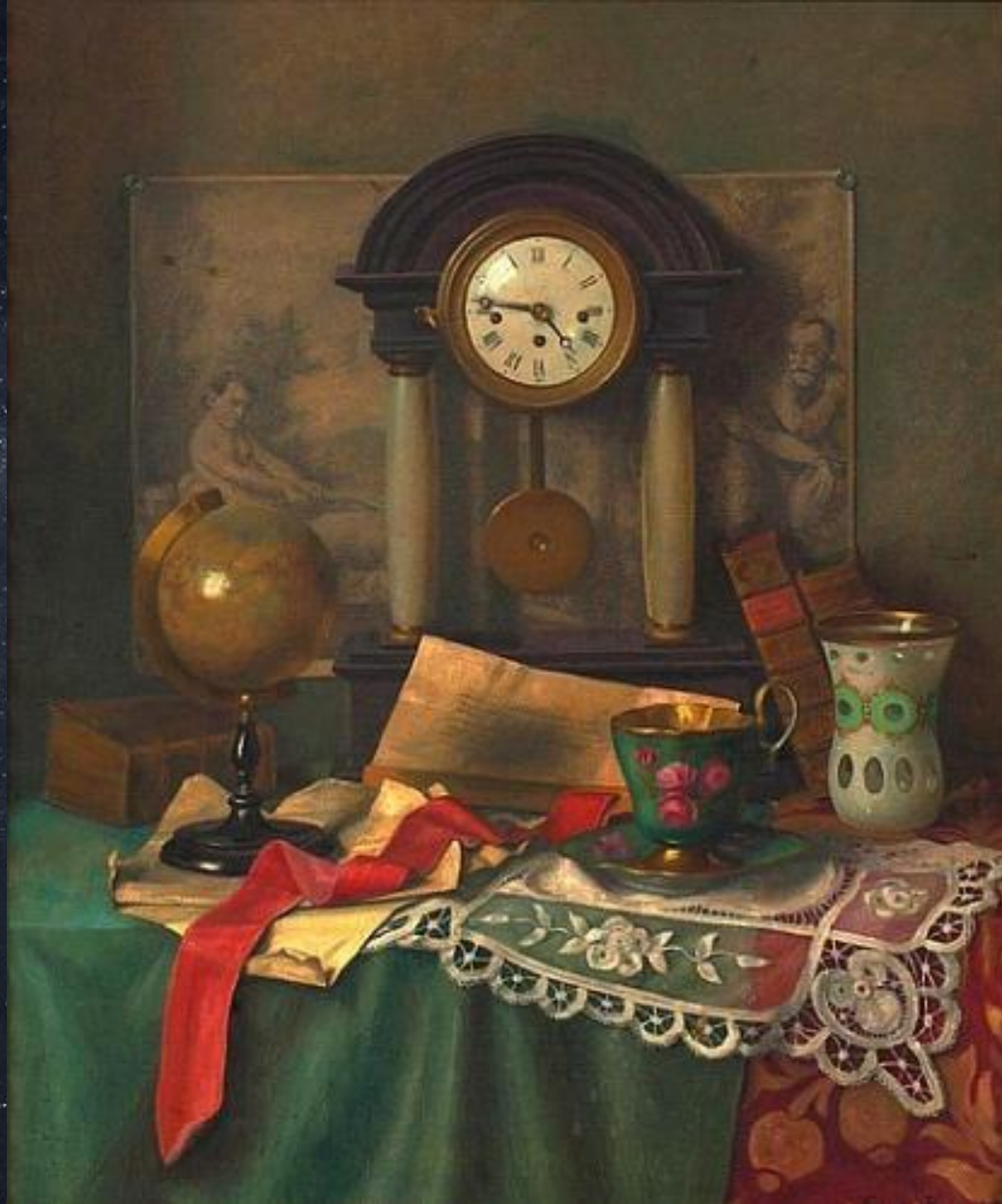
Франц Кричке. Натюрморт с часами.