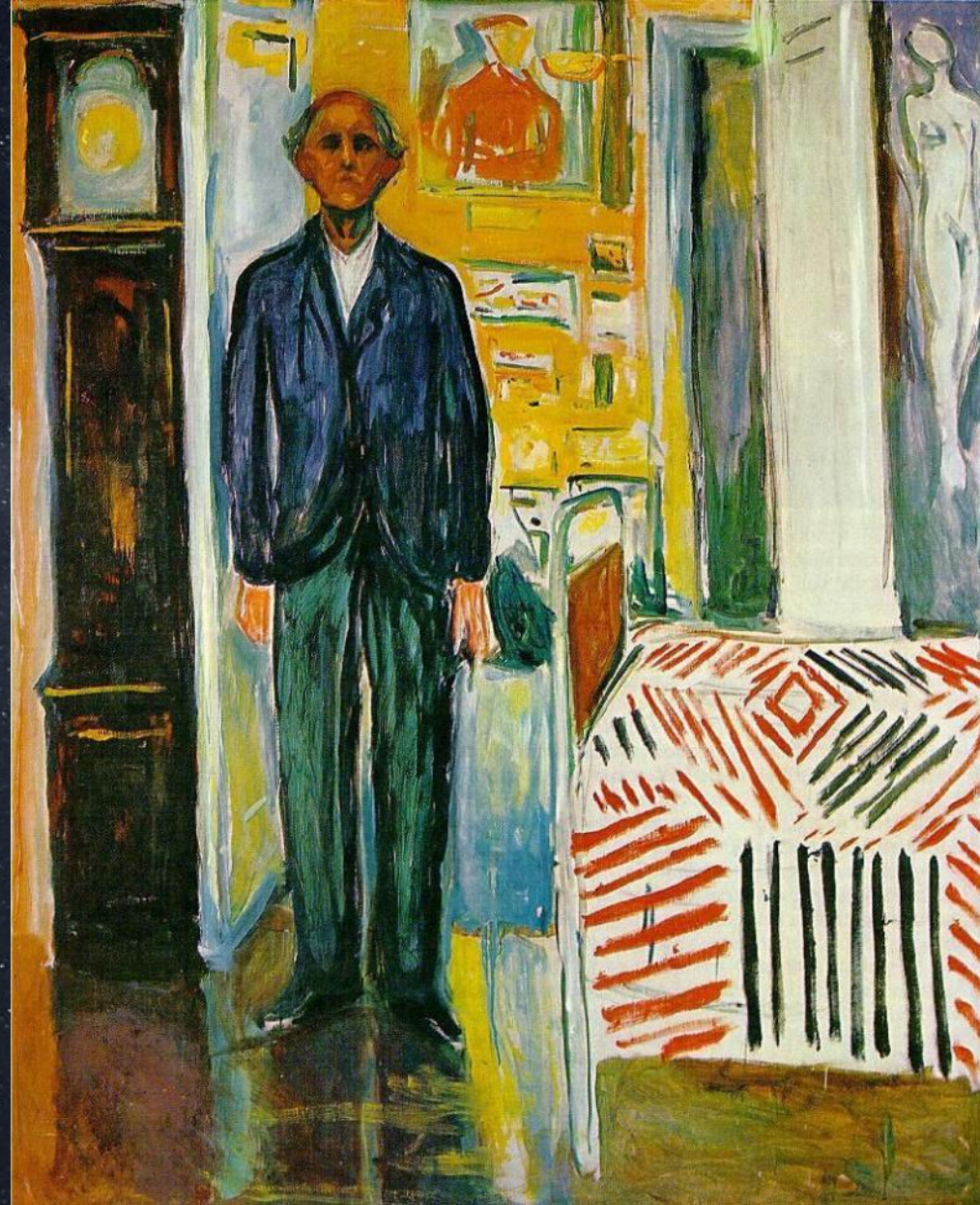
Эдвард Мунк. Автопортрет между часами и кроватью. 1940-1942