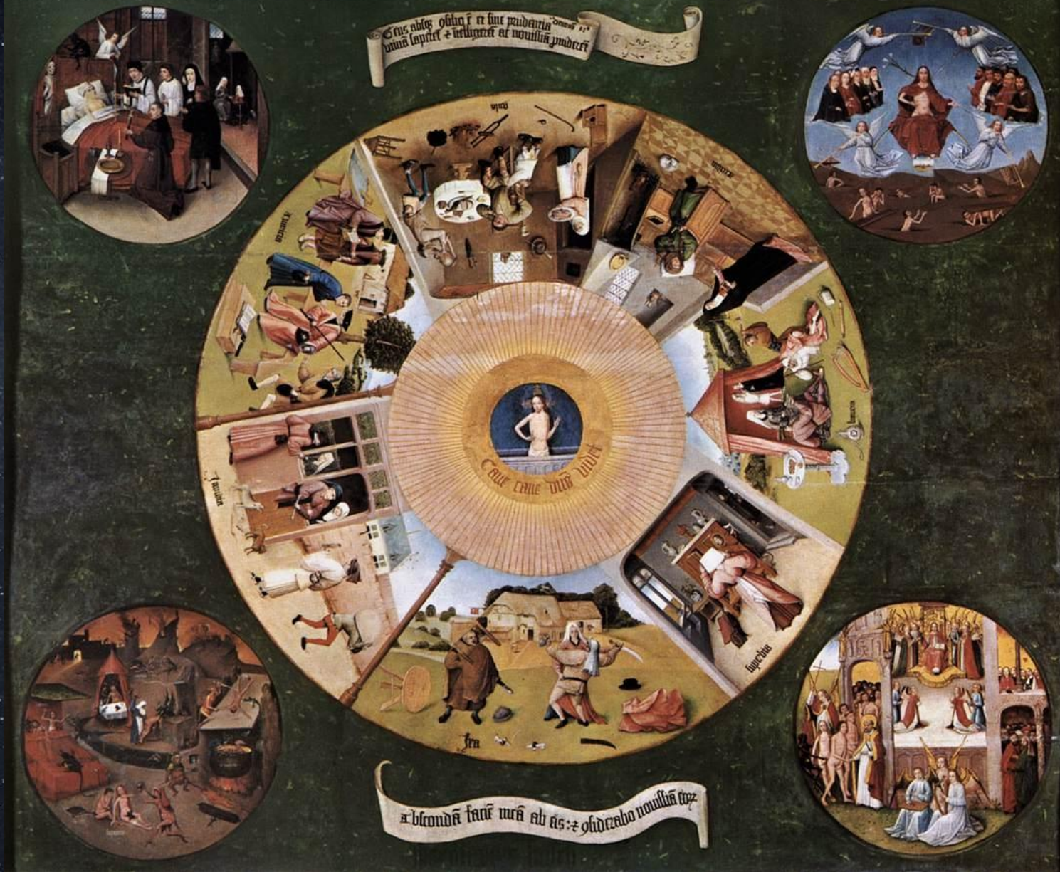
Иероним Босх. Семь смертных грехов и Четыре последние вещи, 1475-1480