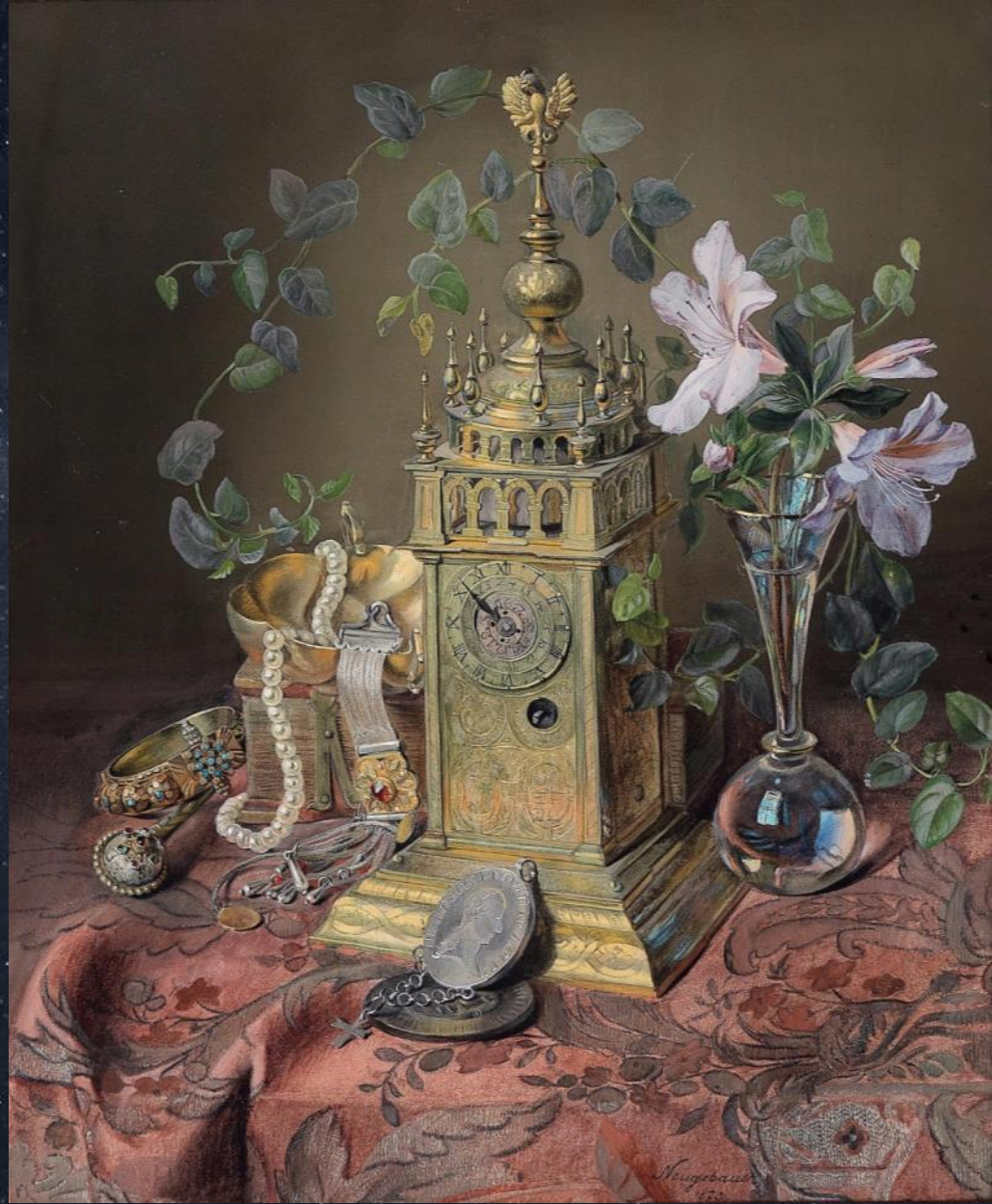
Йозеф Нойгебауэр. Натюрморт с часами. 1873