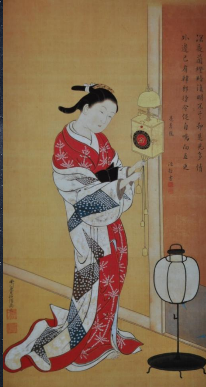
Нишикава Сукенобу. Красавица и часы. Первая половина 18-го века