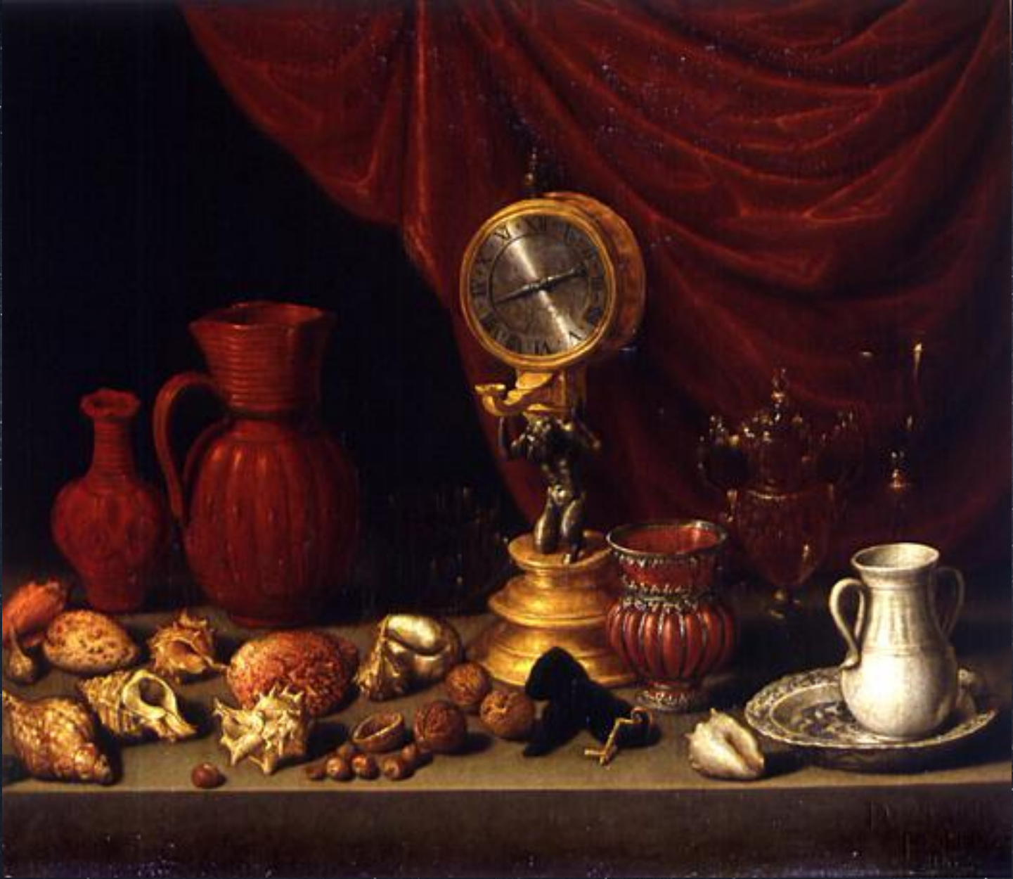
Антонио де Переда. Натюрморт с часами. 1652