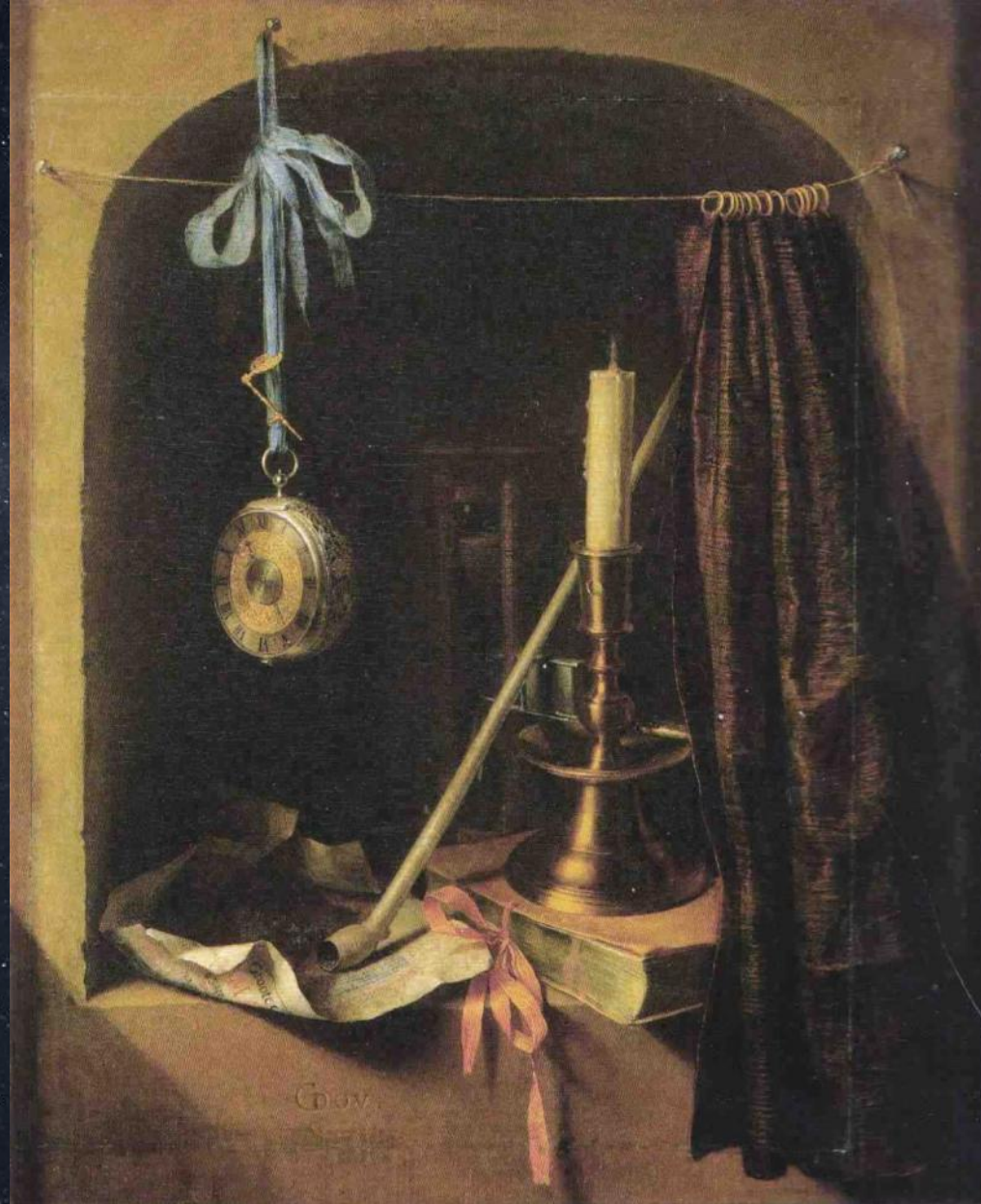
Геррит Доу. Натюрморт с подсвечником и карманными часами. 17-й век