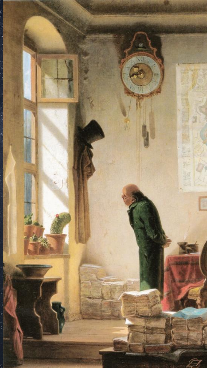
Карл Шницвег. Любитель кактусов. 1850