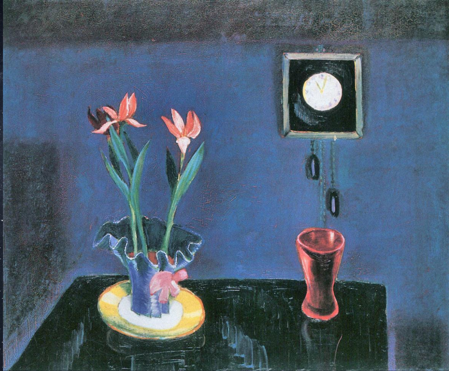
Вальтер Граматте. Натюрморт с часами и вазой с тюльпанами. Ок.1922