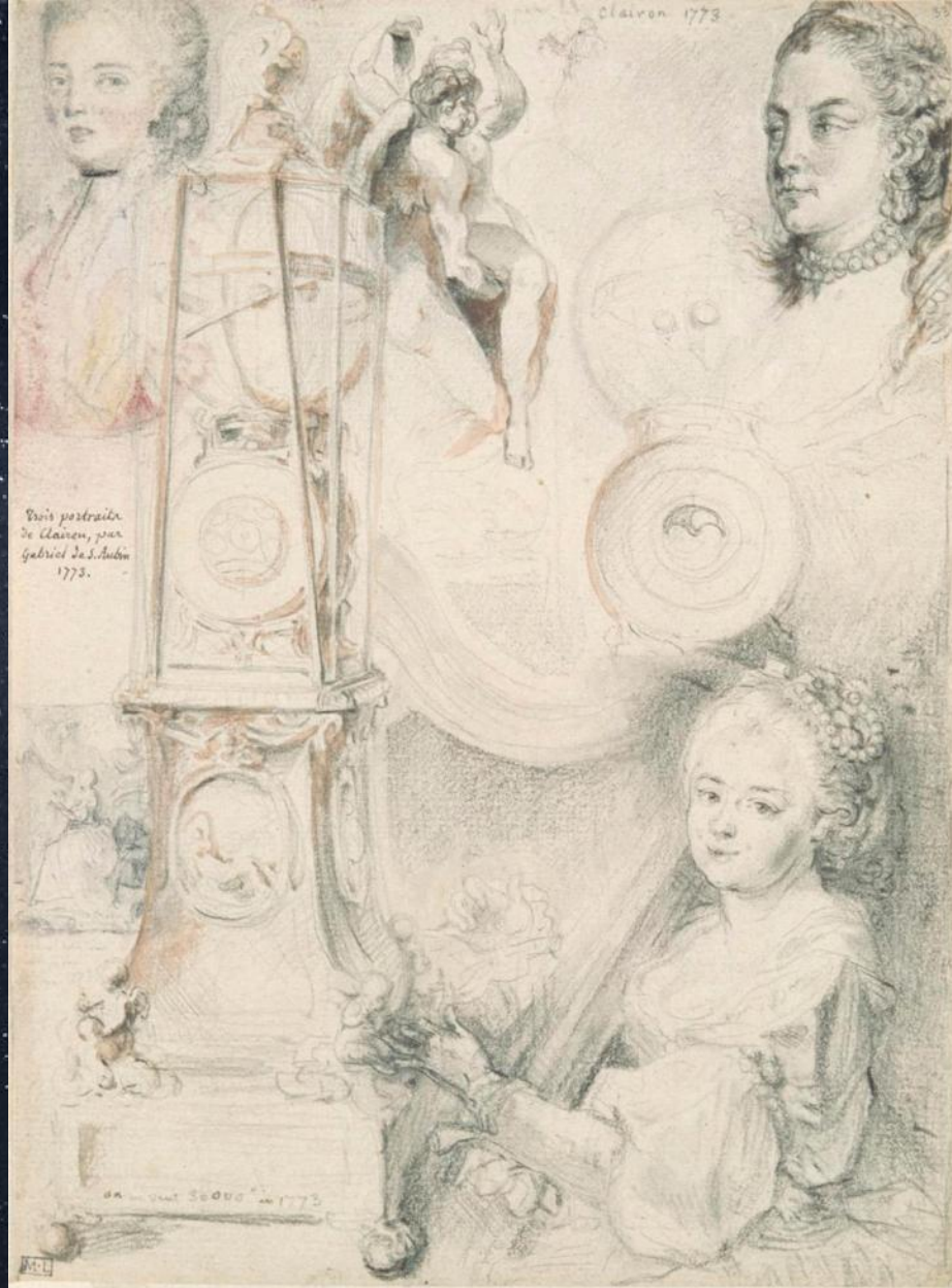
Габриэль де Сент-Обен. Этюды к разным портретам. 1773