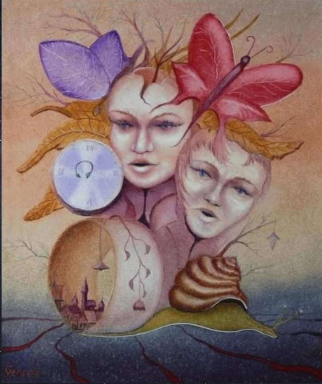
Арпад Гергели. Часы. 1981