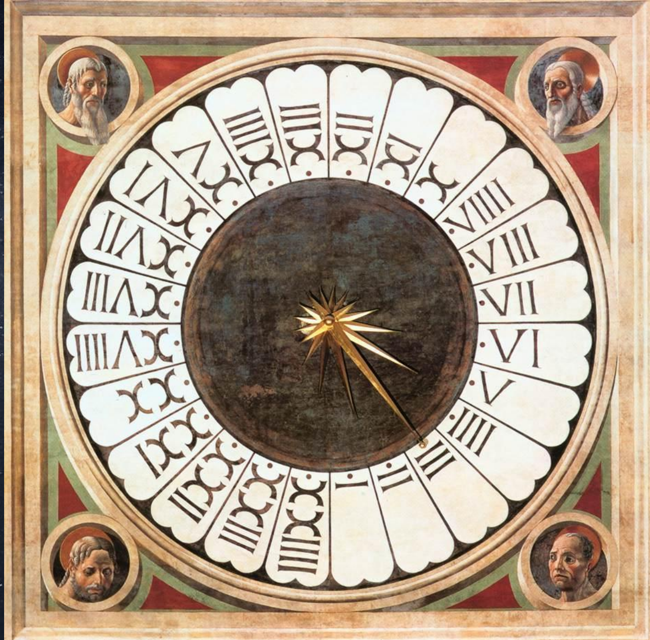
Паоло Уччелло. Часы с головами пророков. 1443