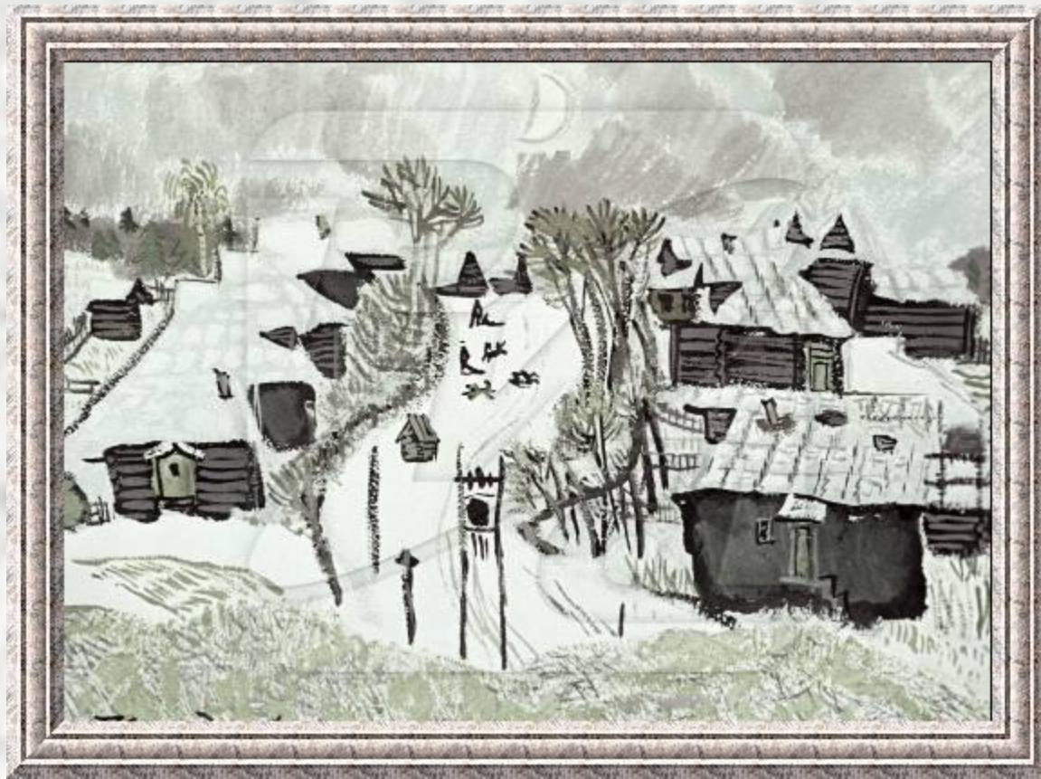
Татьяна Маврина. Первый снег.