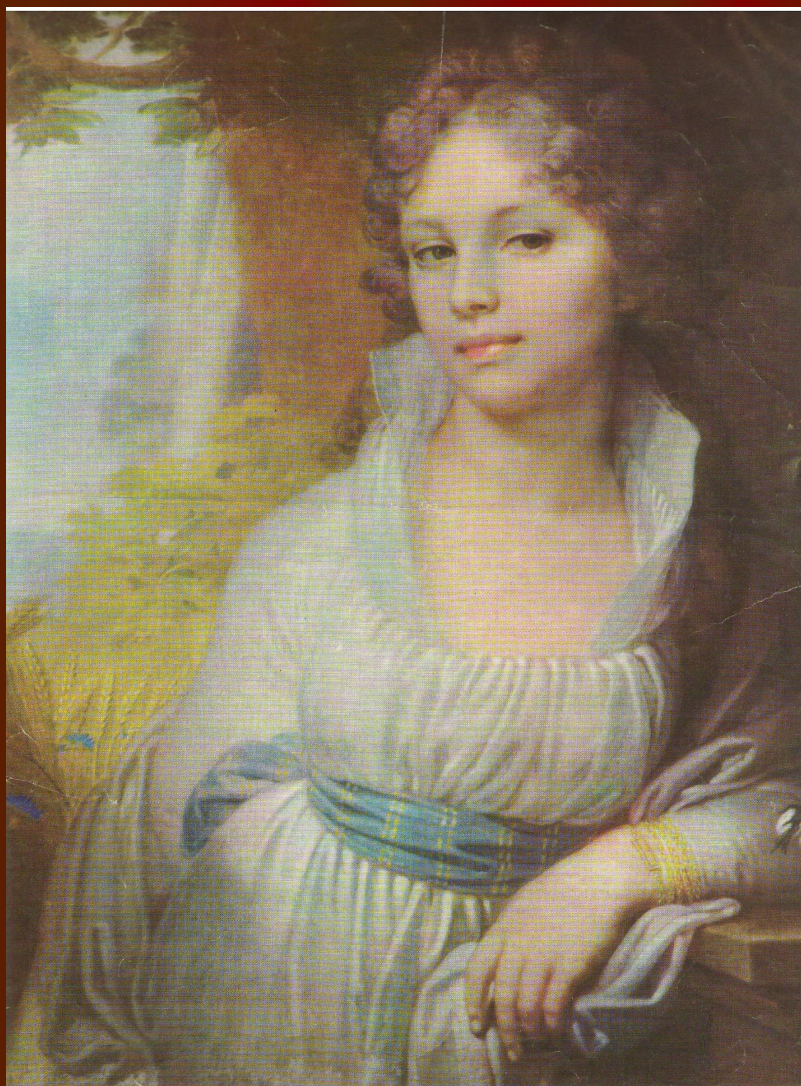
В. Боровиковский, 1757—1825. ПОРТРЕТ М. И. ЛОПУХИНОЙ. 1797.