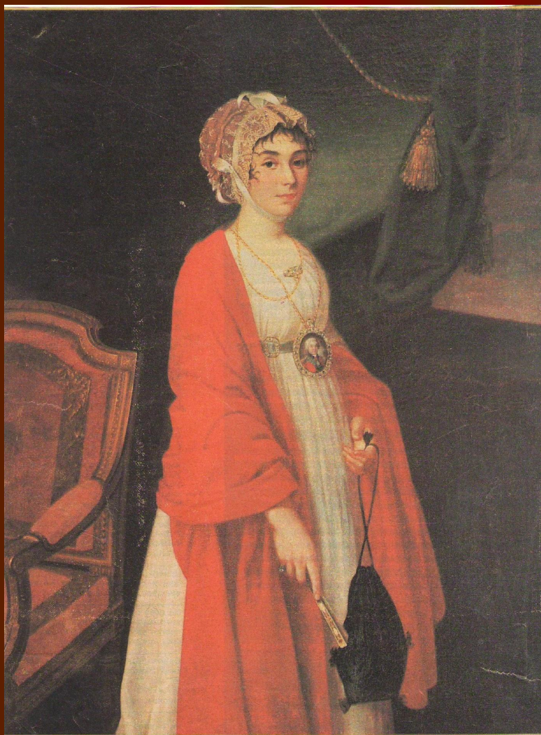
И. АРГУНОВ. Портрет П. Ковалевой-Жемчуговой (в красной шали). 1802—1803 гг.

Есть что-то в ней, что красоты прекрасней, Что говорит не с чувствами – с душой; Есть что-то в ней над сердцем самовластней Земной любви и прелести земной.