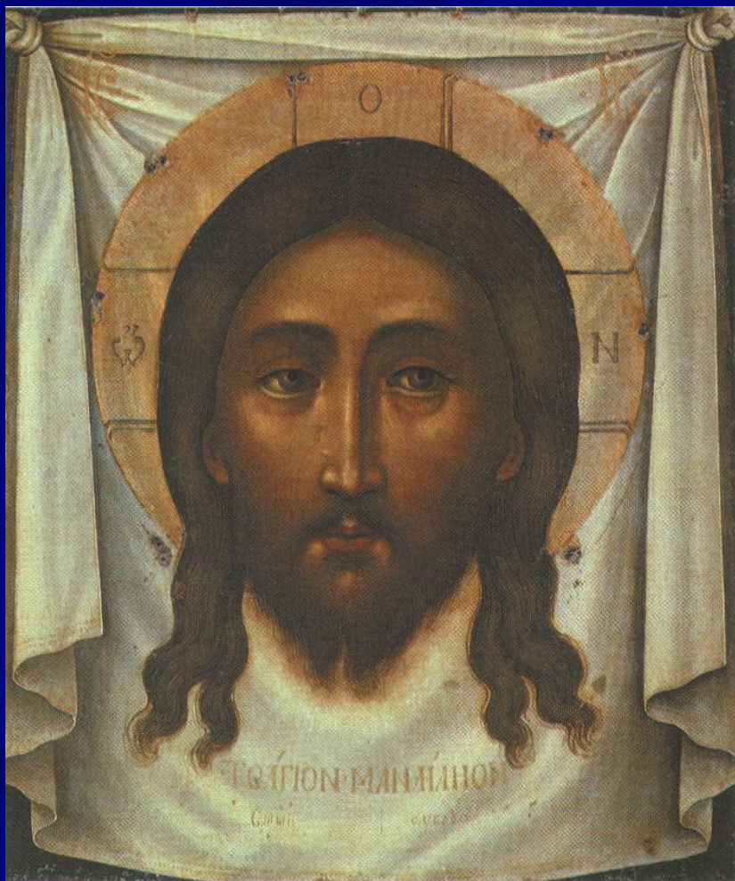
Симон Ушаков. Спас нерукотворный