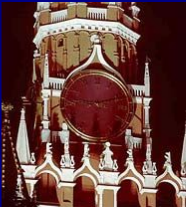
Куранты на Спасской башне Московского Кремля.