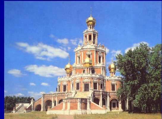
Церковь Покрова в Филях