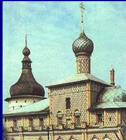
Ростов Великий. Церковь Одигитрии. 1698 год.