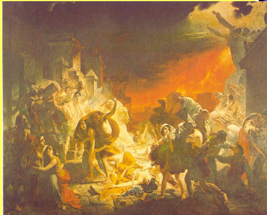
К. Брюллов. Последний день Помпеи.

Исторический жанр – это жанр, объединяющий произведения изобразительного искусства, в которых запечатлены значительные события и герои прошлого, различные эпизоды из истории отдельной страны.