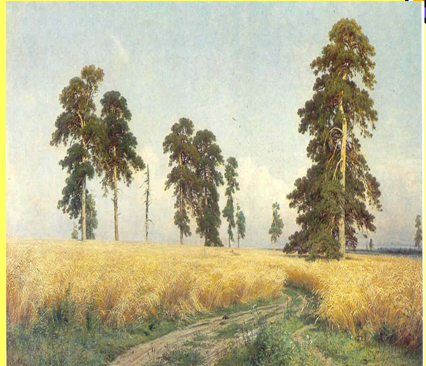
И. Шишкин. Рожь.

Пейзаж - жанр изобразительного искусства, посвященный воспроизведению естественной или преобразенной человеком природы.