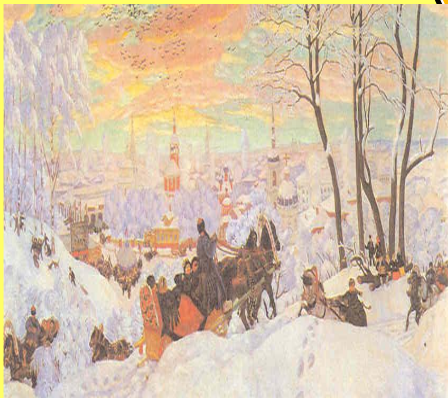
В. Кустодиев. Масленица.

Бытовой жанр - это изображение жизни людей, их труда, событий в окружающей действительности.