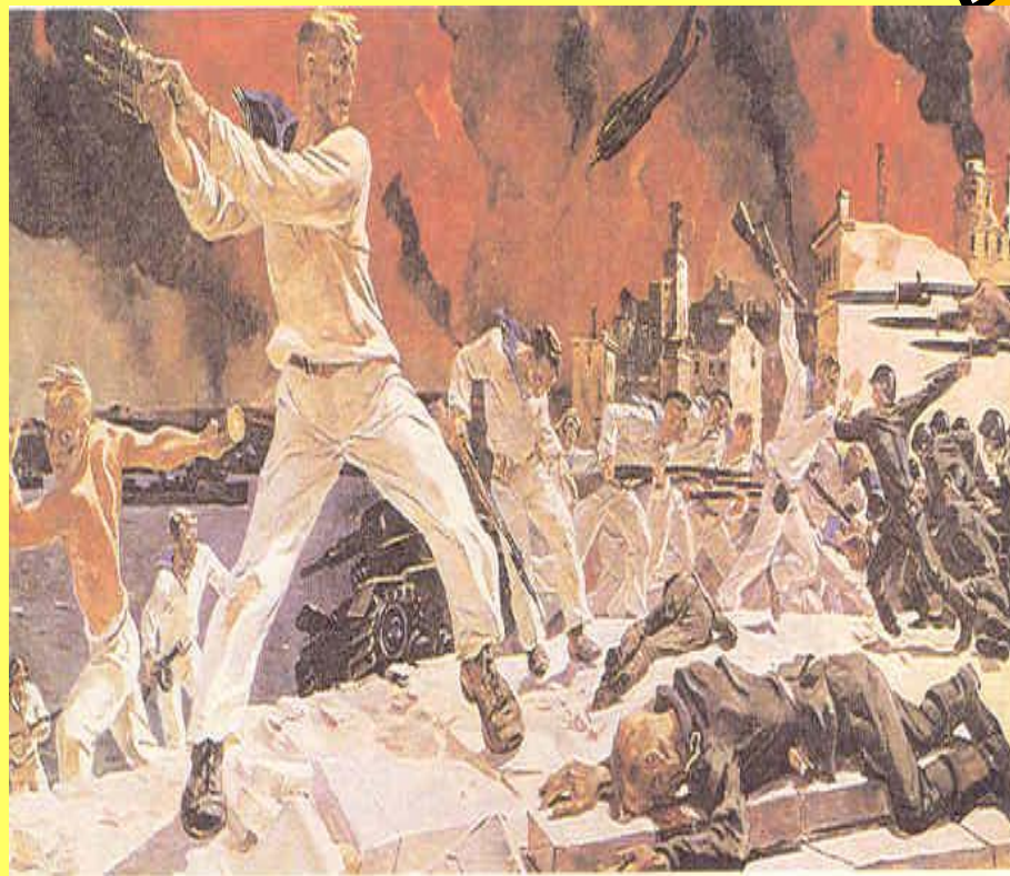
А. Дейнека. Оборона Севастополя.

Батальный жанр - жанр изобразительного искусства, посвященный темам войны и военной жизни. Главное место в батальном жанре занимают сцены военных сражений и походов.