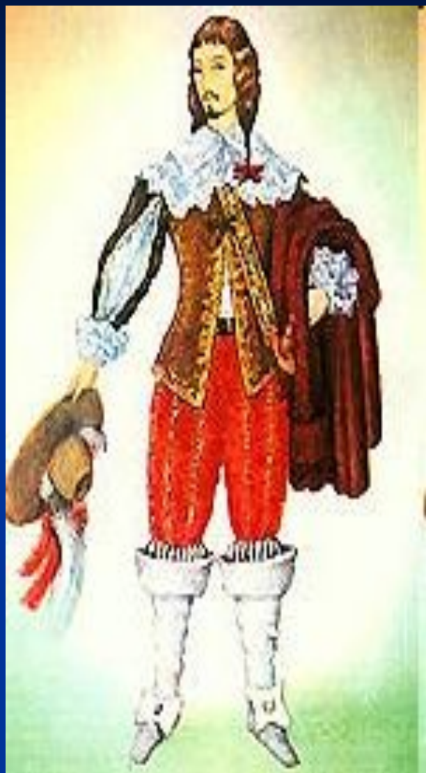
КОСТЮМ XVII ВЕК