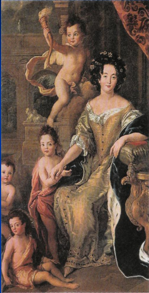
Пьер Миньяр. Франсуаза Атенаис де Рошешуар, маркиза де Монтеспан с детьми. 70-е гг. XVII в. Фаворитка в парадном золотом платье. Дети в «античных» хитончиках.