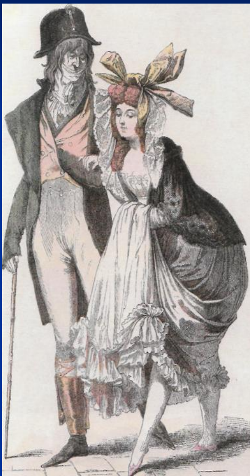
Карл Верне. Мервейёз. 1797 г. Национальная библиотека. Париж.