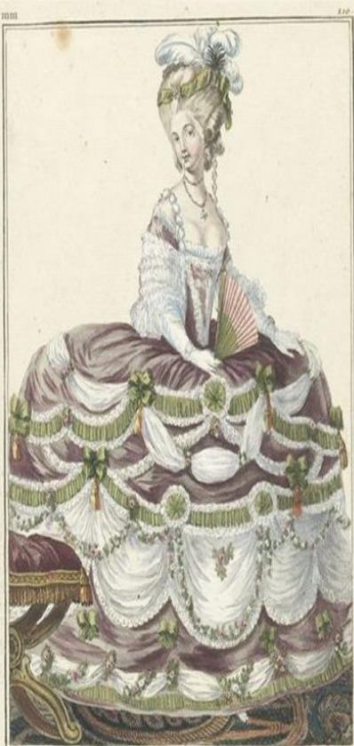
Duchesse occupant une des premières places chez la Reine. Elle est vêtue d'un habit de Couleur de la Grande paille le devant de la jupe est garni de Gaze de Blanche et de Fleurs de Heures attachés par inter- valles avec des manes de Rubans d'un pendent des Glaces.

A Paris chez les Comtesse et Marquis à la Ville de Commerce rue d'Anjou. A. P. D. R.