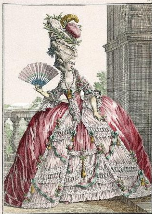
Jeune Dame de Qualité en grande Robe coiffée avec un Bonnet ou Poul elegant dit la Montagne.

A Paris chez les Comtesse et Marquis à la Ville de Commerce rue d'Anjou. A. P. D. R.