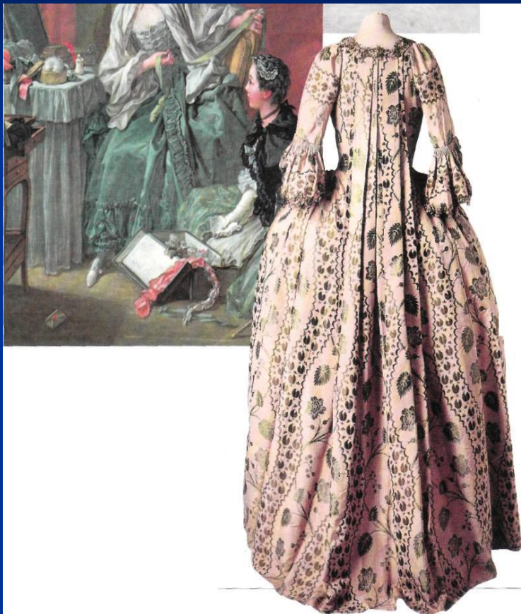
Платье на панье со складкой Ватто, 1755—1760 гг. Музей моды и костюма. Париж.