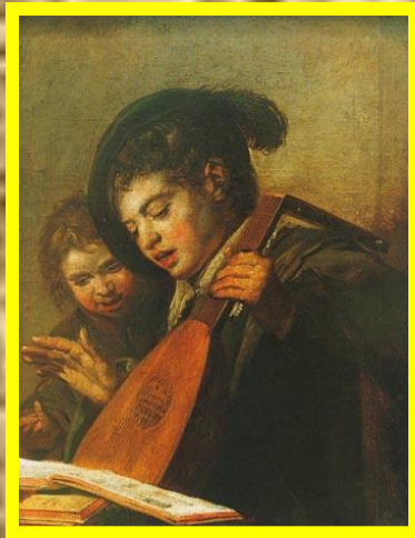
Ф.Хальс Поющие мальчики