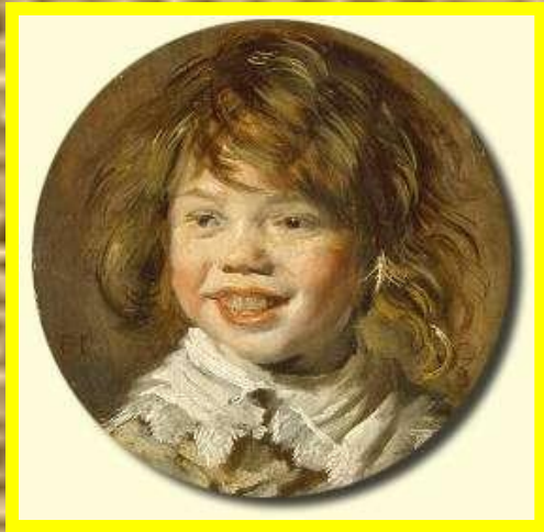
Ф.Хальс Смеющийся мальчик