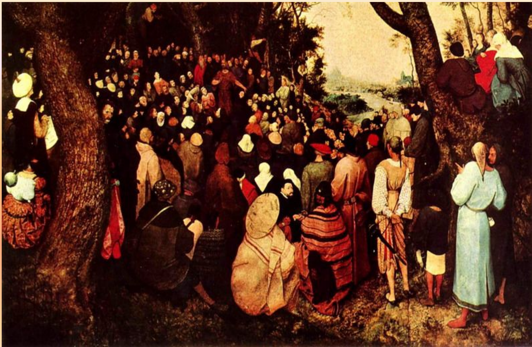
Брейгель. Проповедь Иоанна Крестителя.