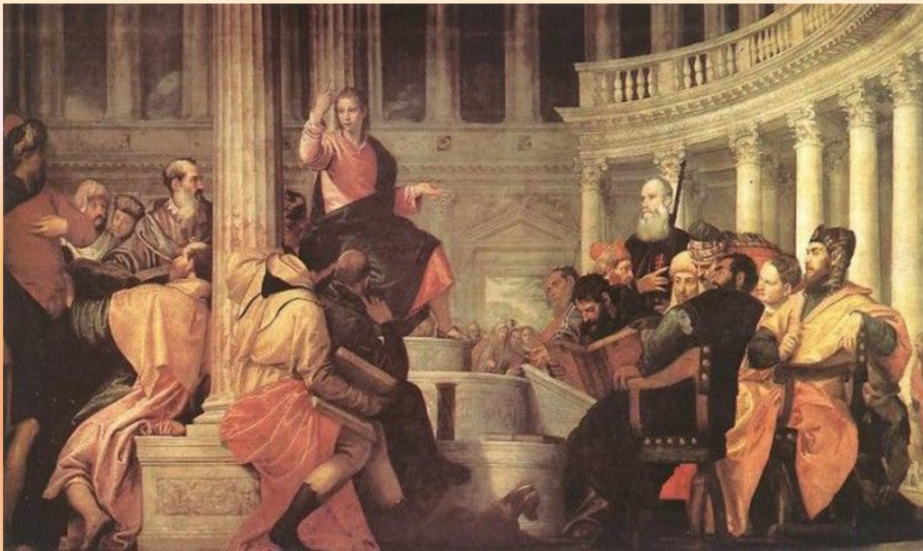
Веронезе. Христос среди учителей