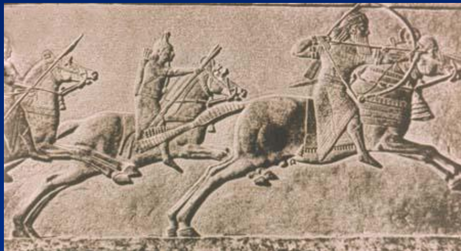
Конная охота Ашшурбанапала. VII в. до н.э. Рельеф из царского дворца в Ниневии. VII в до н.э.