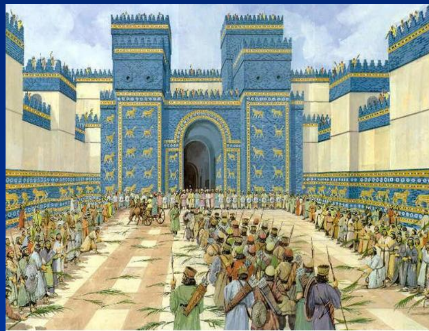
Ворота богини Иштар в Вавилоне.

• К сожалению, от блистательной эпохи Навуходоносора II сохранилось очень мало памятников. Единственное архитектурное сооружение Вавилона, сохранившееся до наших дней, - главные парадные ворота, находившиеся в северной части города.