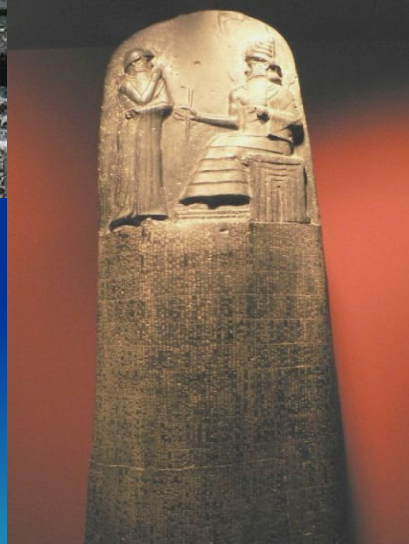
Стела Хаммурапи из Суз.

Диорит. XVIII в до н. э. Берлин, государственный музей