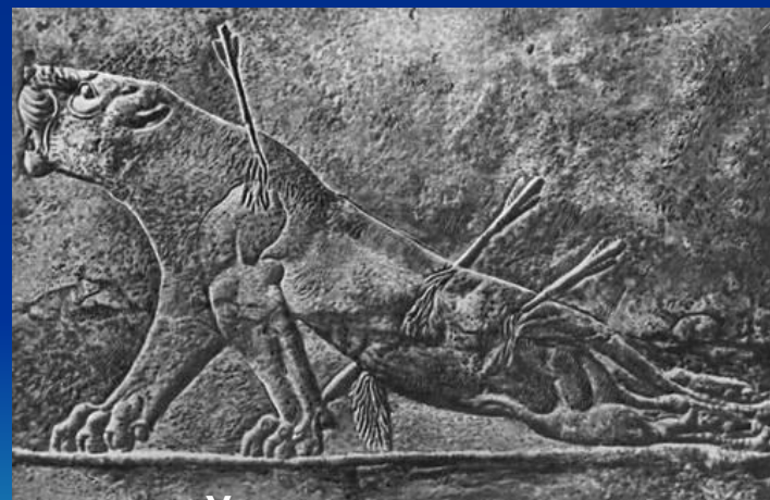
Умирающая львица. Фрагмент рельефа из дворца царя Ашшурбанипала в Ниневии. 669 - ок. 635 до н. э. Британский музей. Лондон.