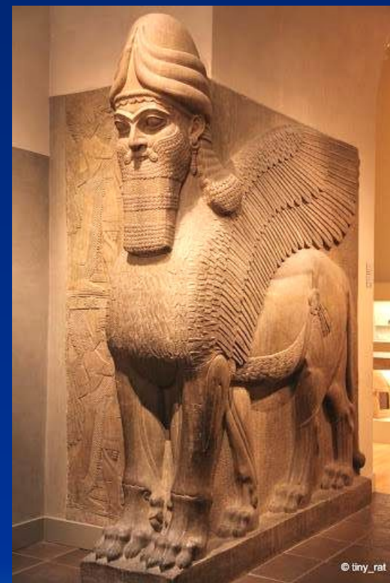
Шеду из дворца Саргона II в Дур-Шаррукине. Песчанник, XVIII в. До н.э. Берлин, Государственный музей