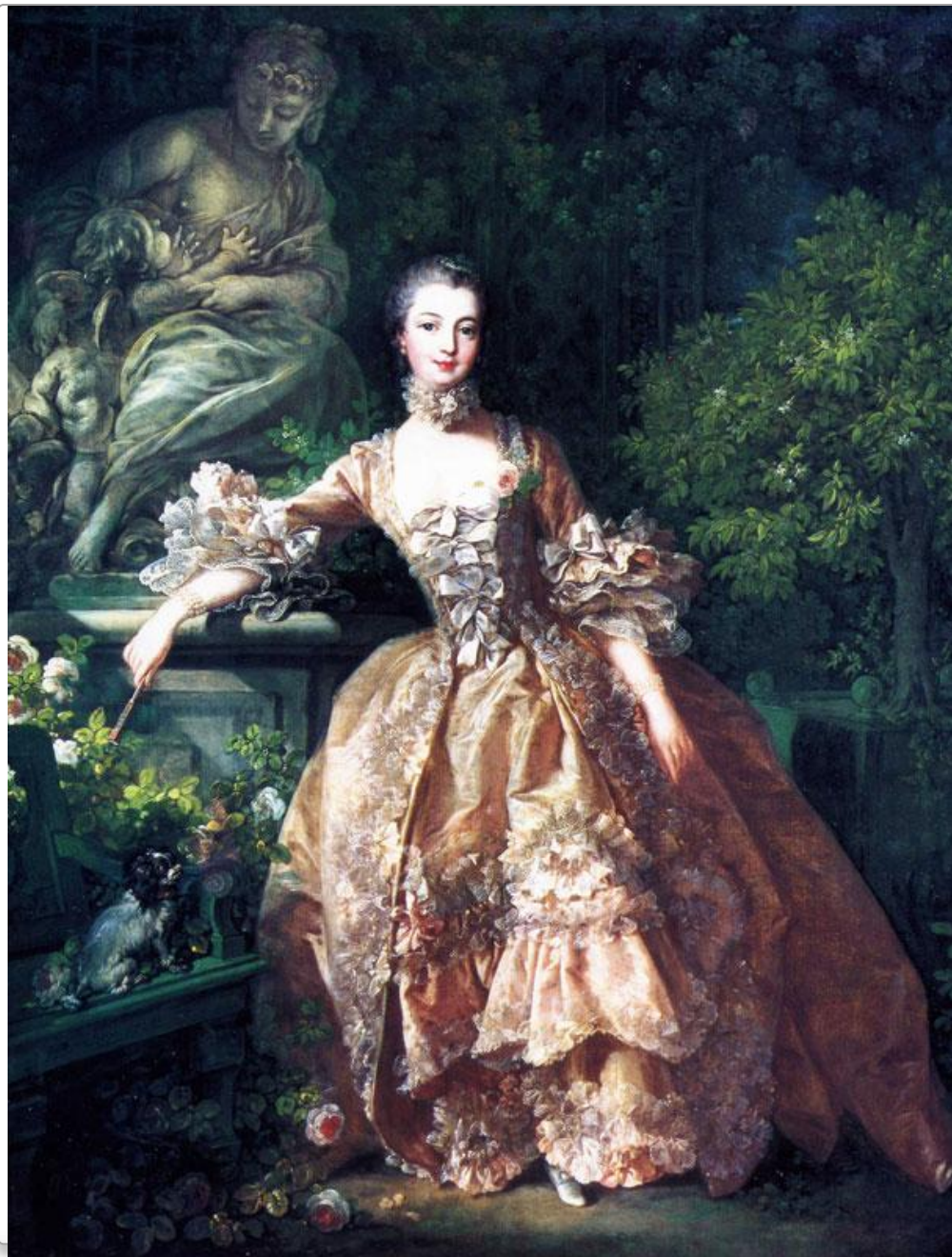
Ф. Буше Портрет мадам де Помпадур