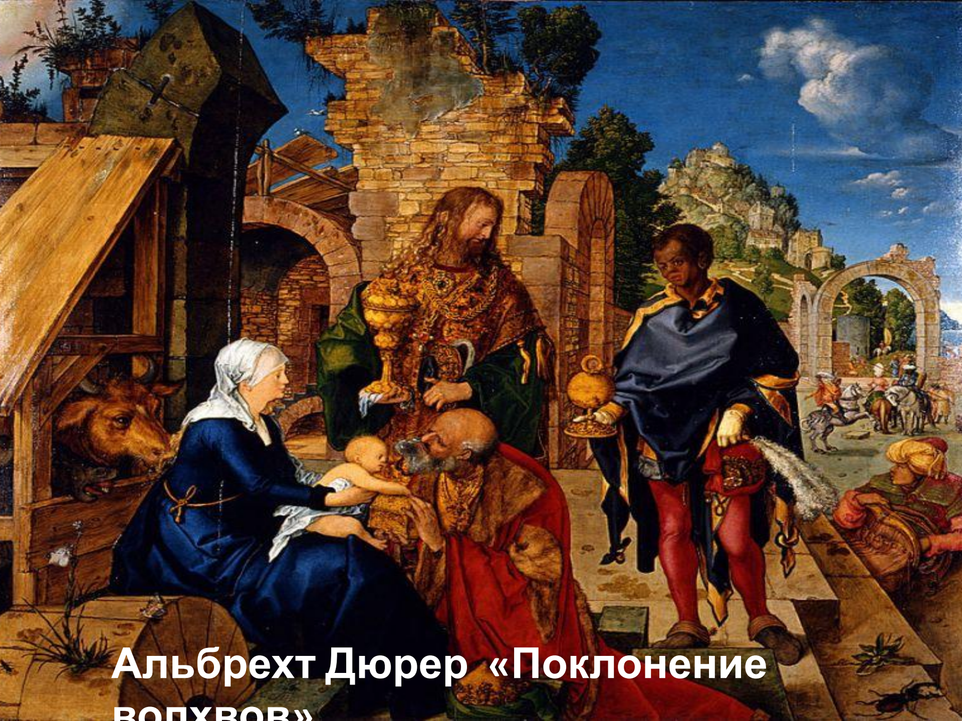
Альбрехт Дюрер «Поклонение вопущов»