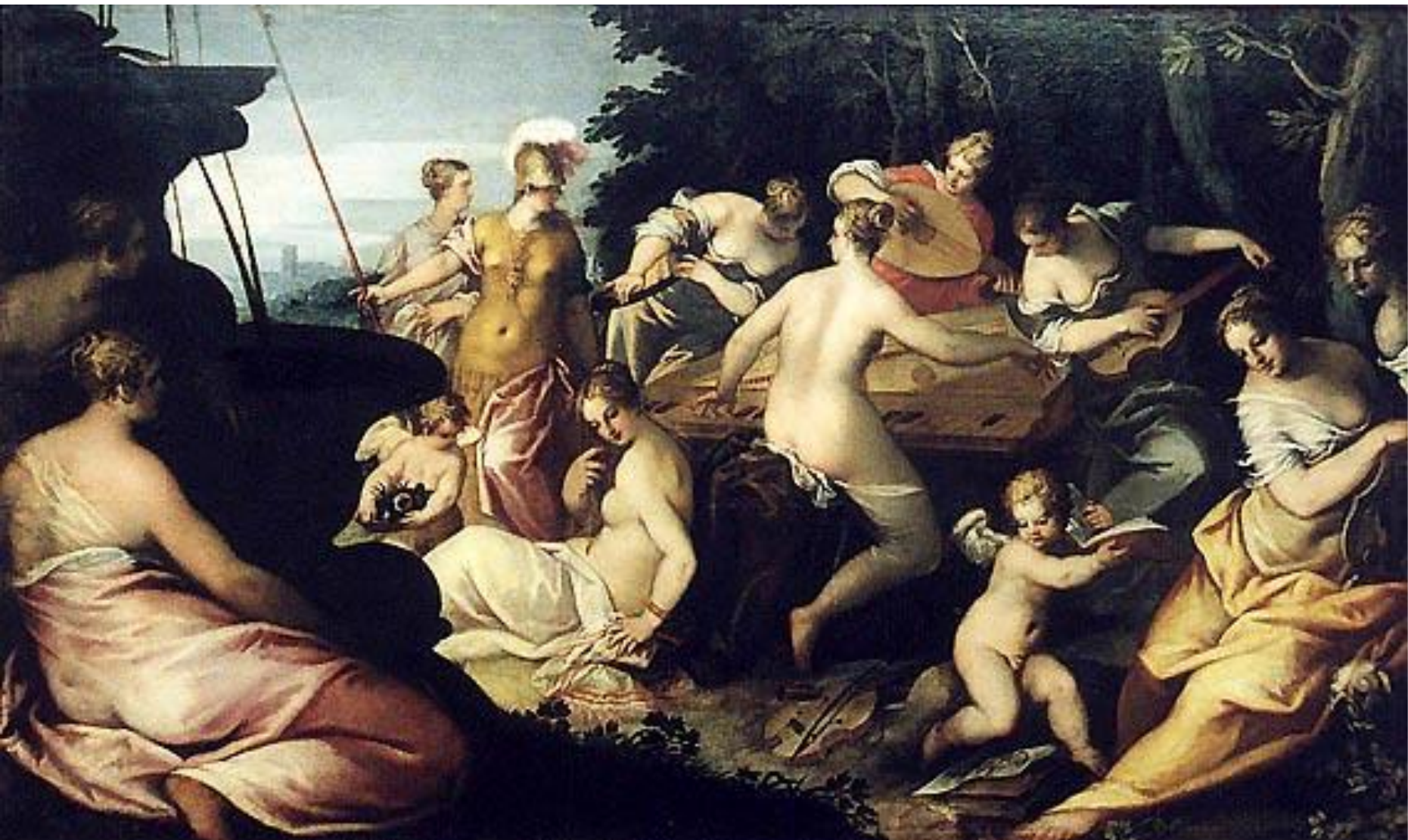
Музы и Афина Ханс Роттенхаммер