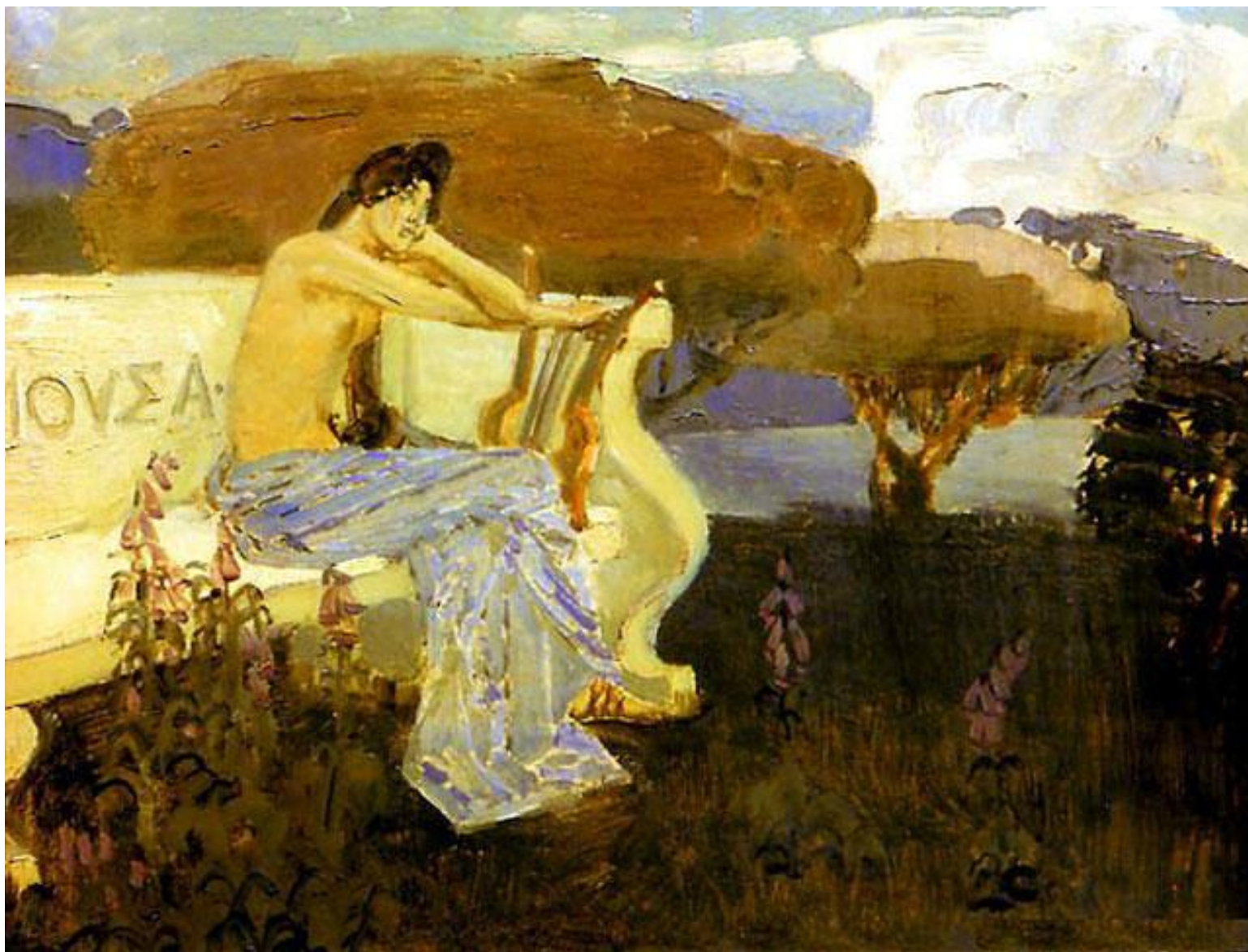
Муза Михаил Врубель, 1900 г.