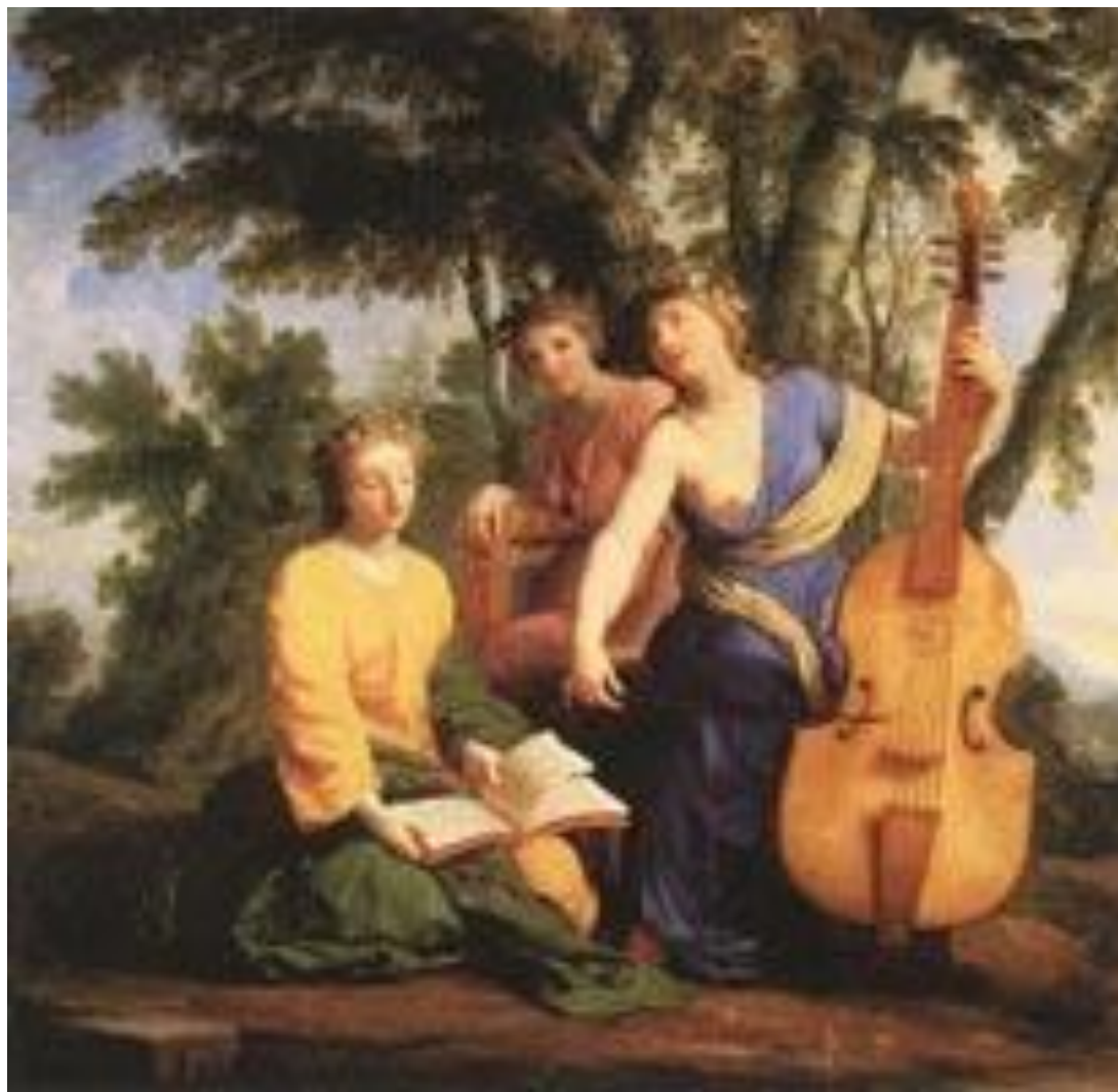
Музы: Мельпомена, Эрато и Полигимния Эсташ Лесюэр