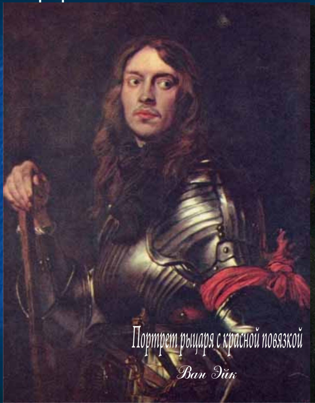
Портрет рыцаря с красной повязкой