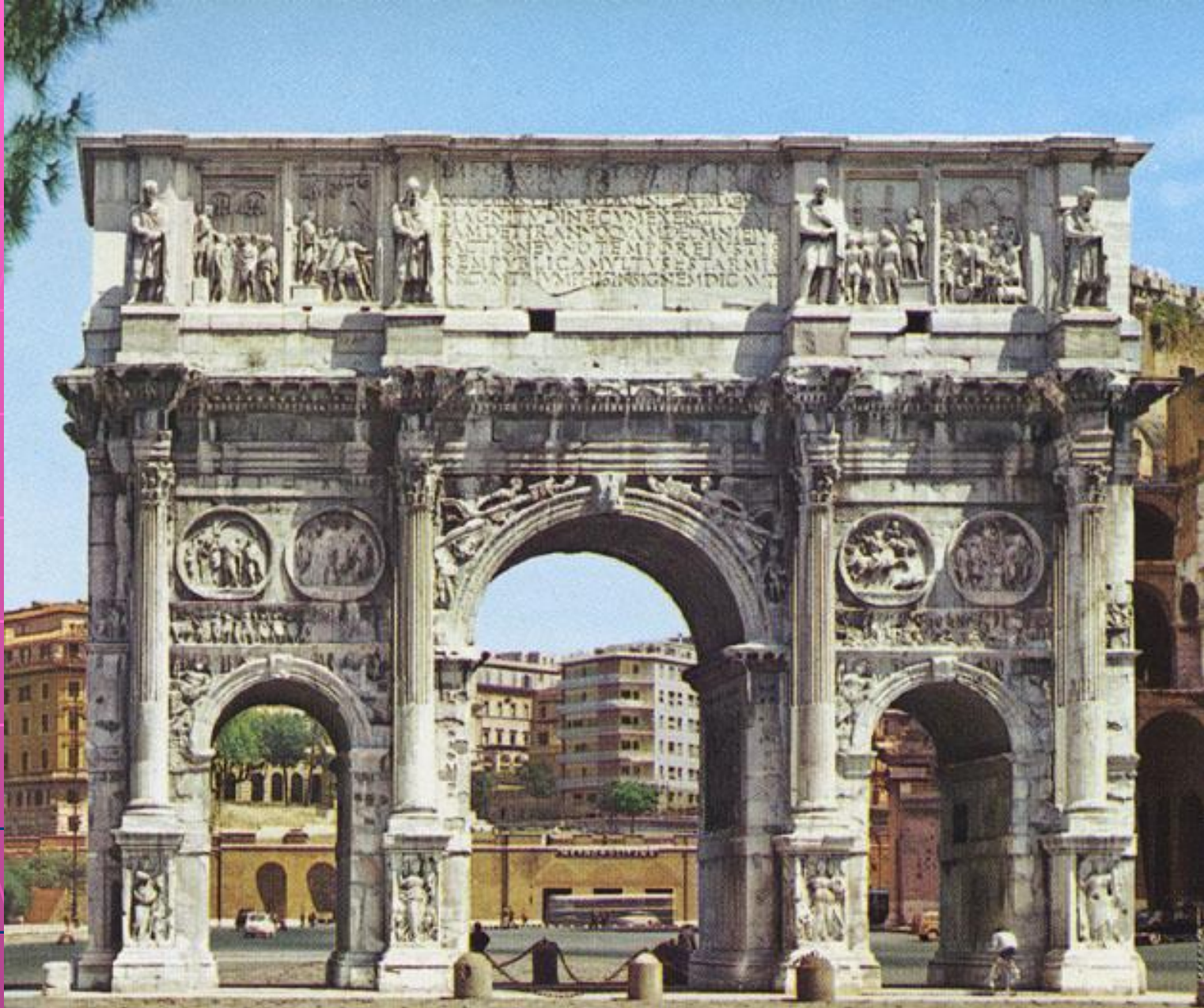
триумфальная арка Константина