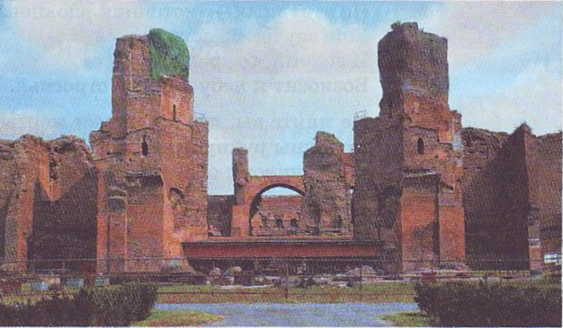
Термы Каракалы III в.