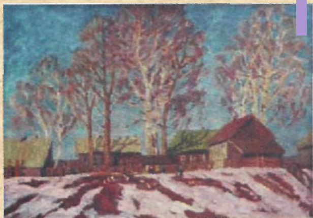
В. Телегин «Март»