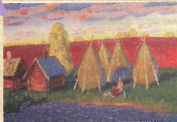
Ю. Лобачев. «У доема»