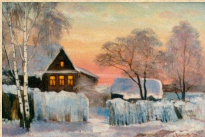
О. Золотова «Сумерки»