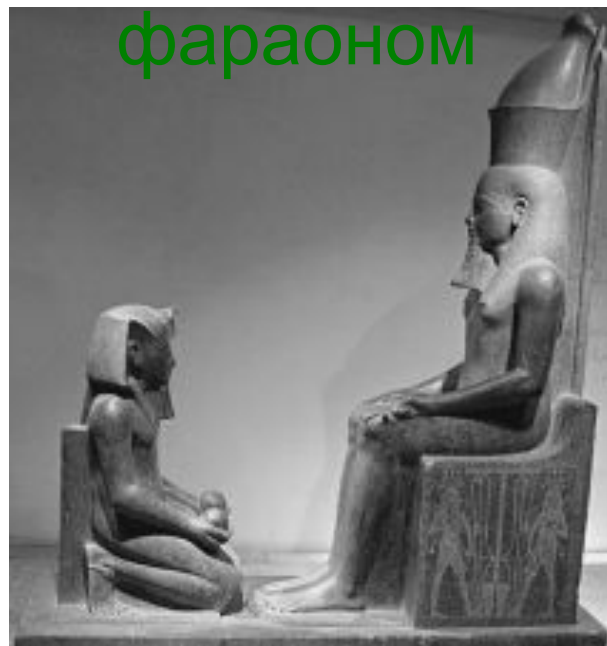
Вельможа перед фараоном