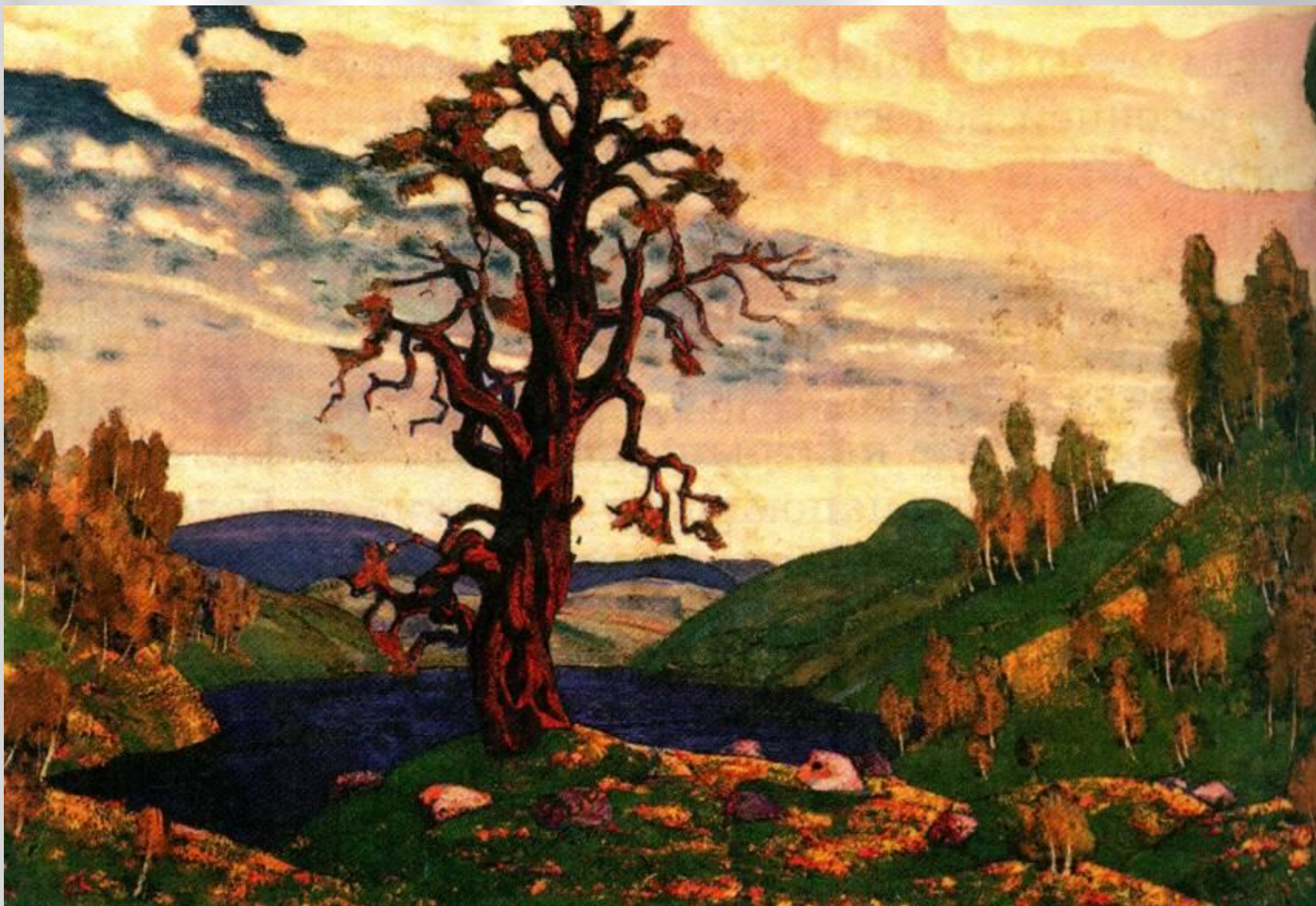
Н.Рерих. Декорация к балету И.Стравинского «Весна священная»