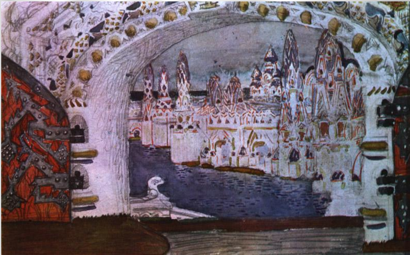
Врубель М.А. Эскиз декорации к опере Н.А.Римского-Корсакова «Сказка о царе Салтане»