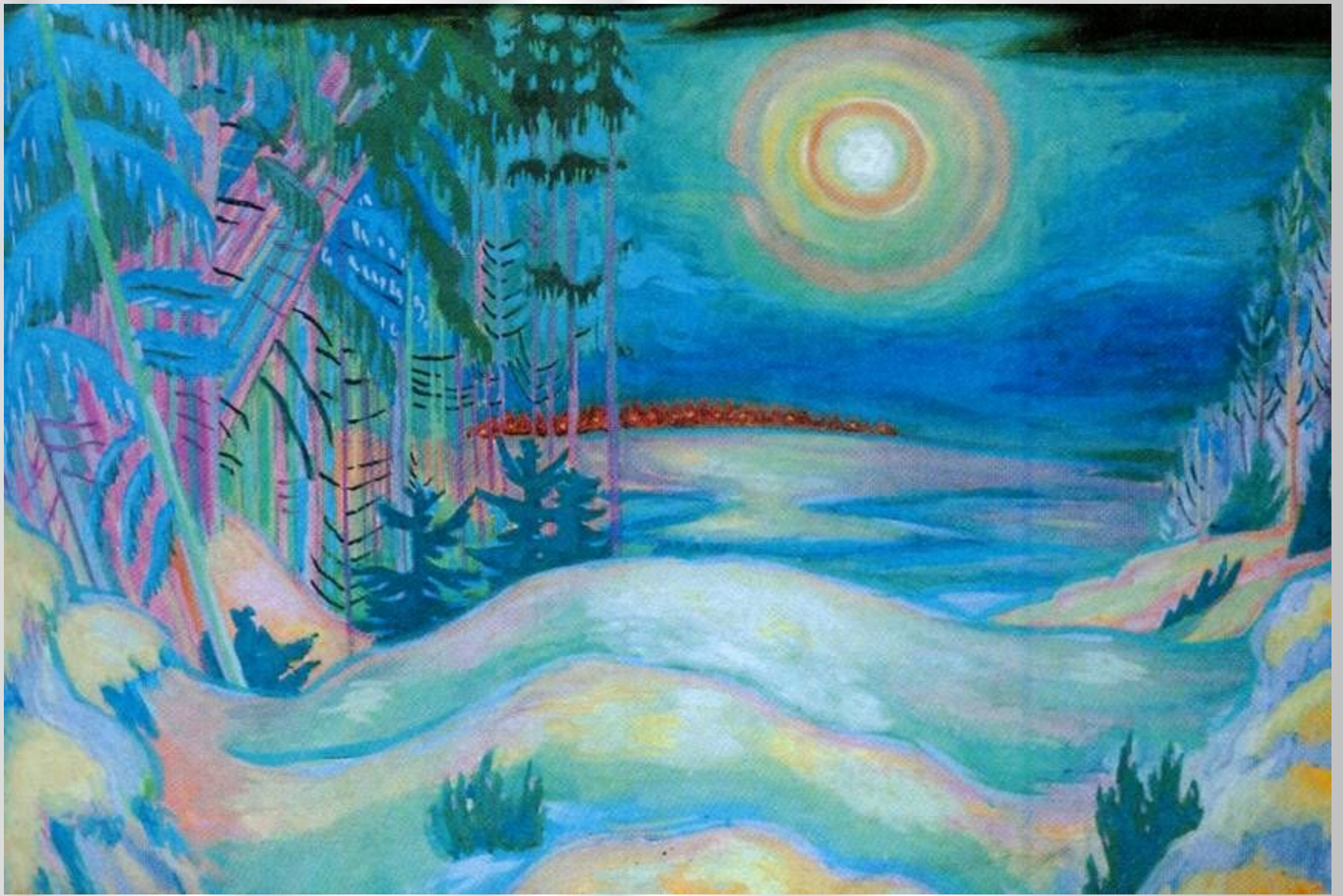
Д.Стеллецкий. Эскиз декорации к опере Н. Римского-Корсакова «Снегурочка»