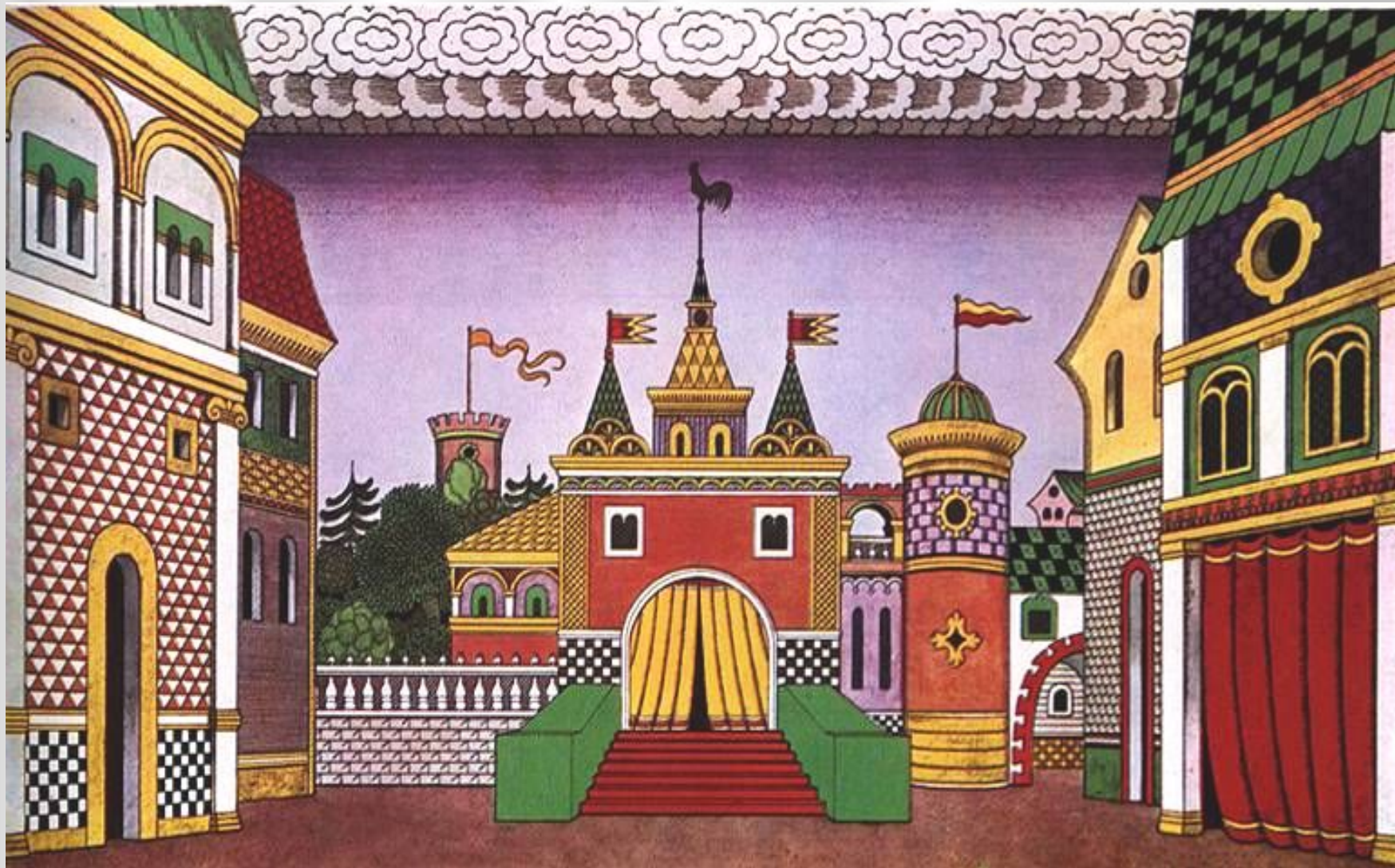
Билибин И.Я. Эскиз декорации к опере Н.А.Римского-Корсакова «Золотой петушок»