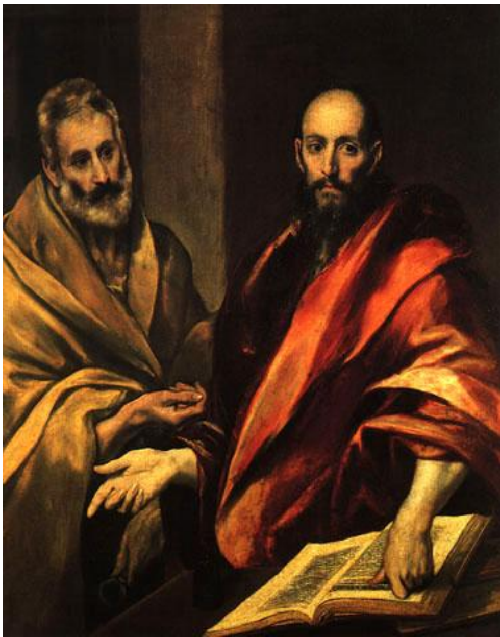
«Апостолы Пётр и Павел»