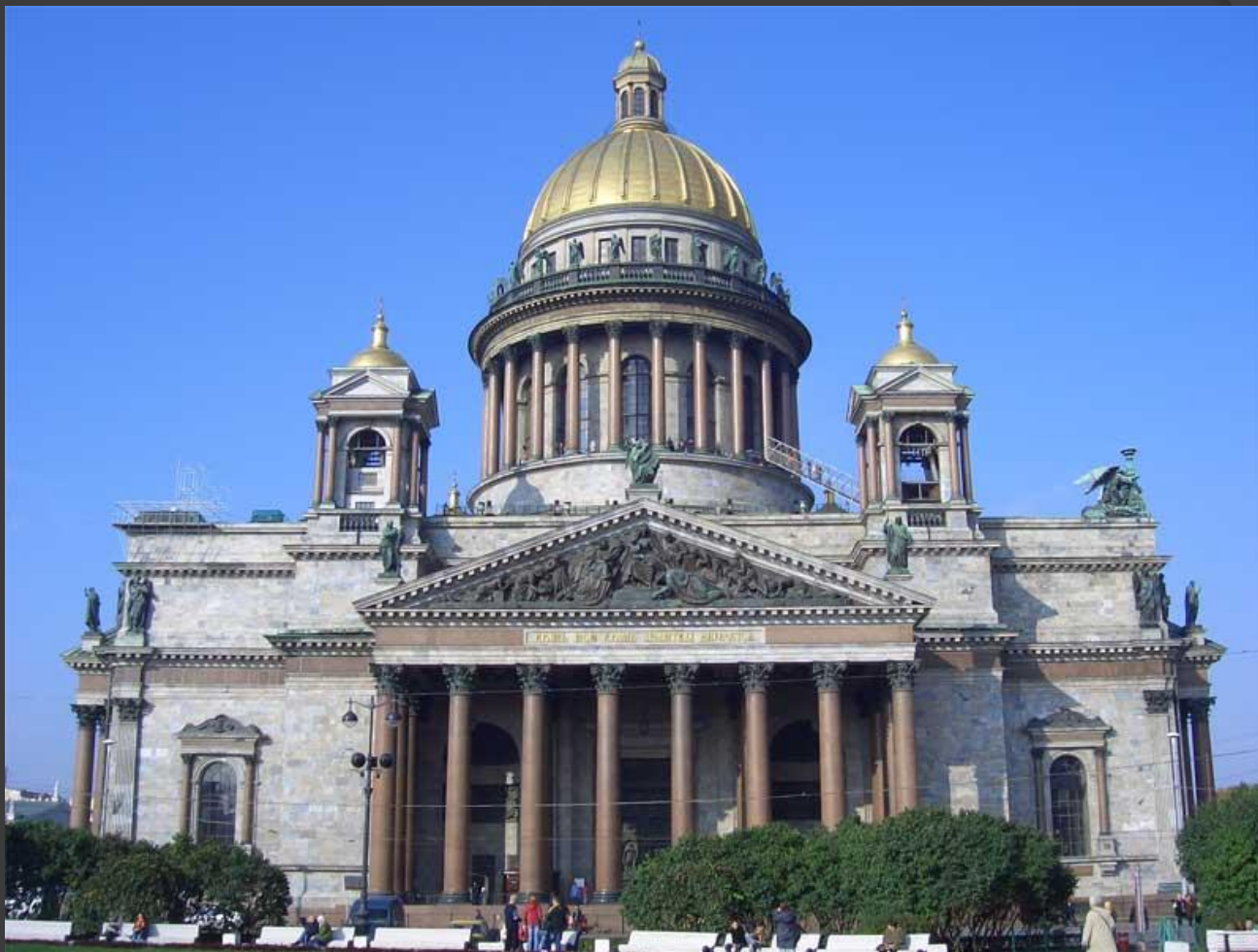
Исаакиевский собор. Санкт-Петербург. 1818-1858гг.