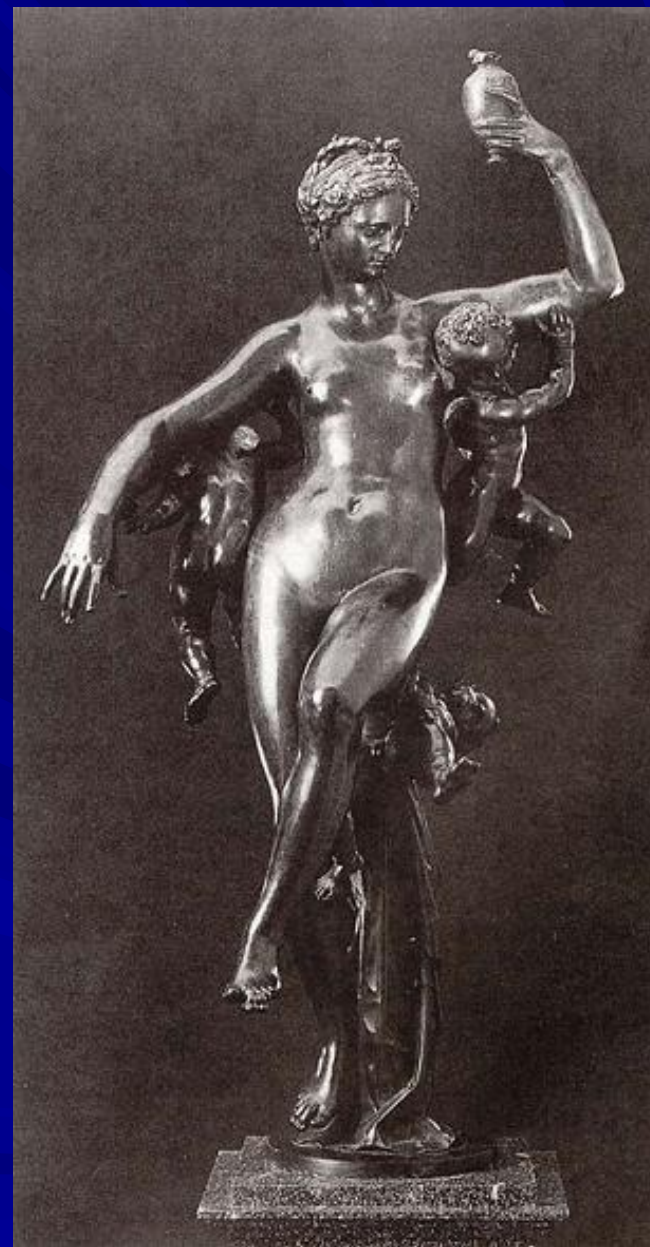
Неизвестный автор “Психея, возносимая зефирами” 1593 г.