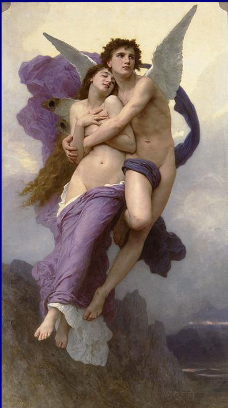
Адольф Уильям Бугро “Похищение Психеи”