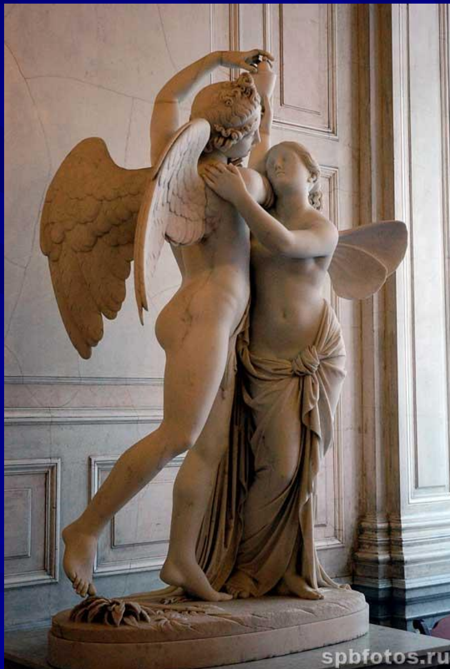
"Амур и Психея" (Эрмитаж)