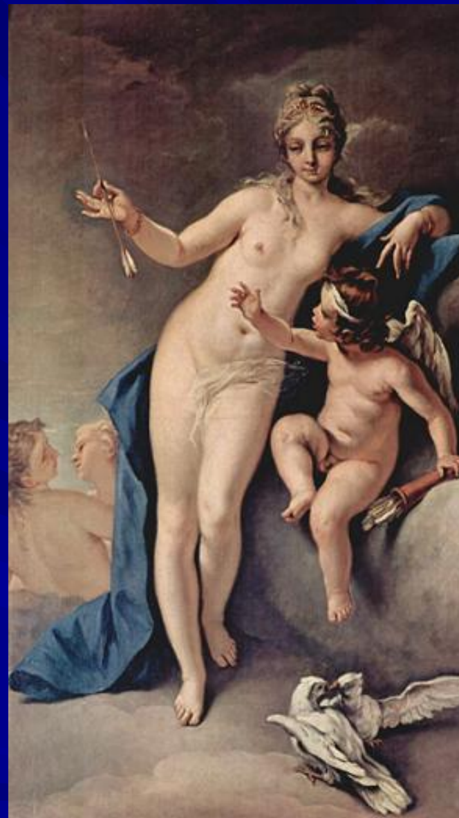
Себастьяно Ричи “Венера и Амур” 1713 г.