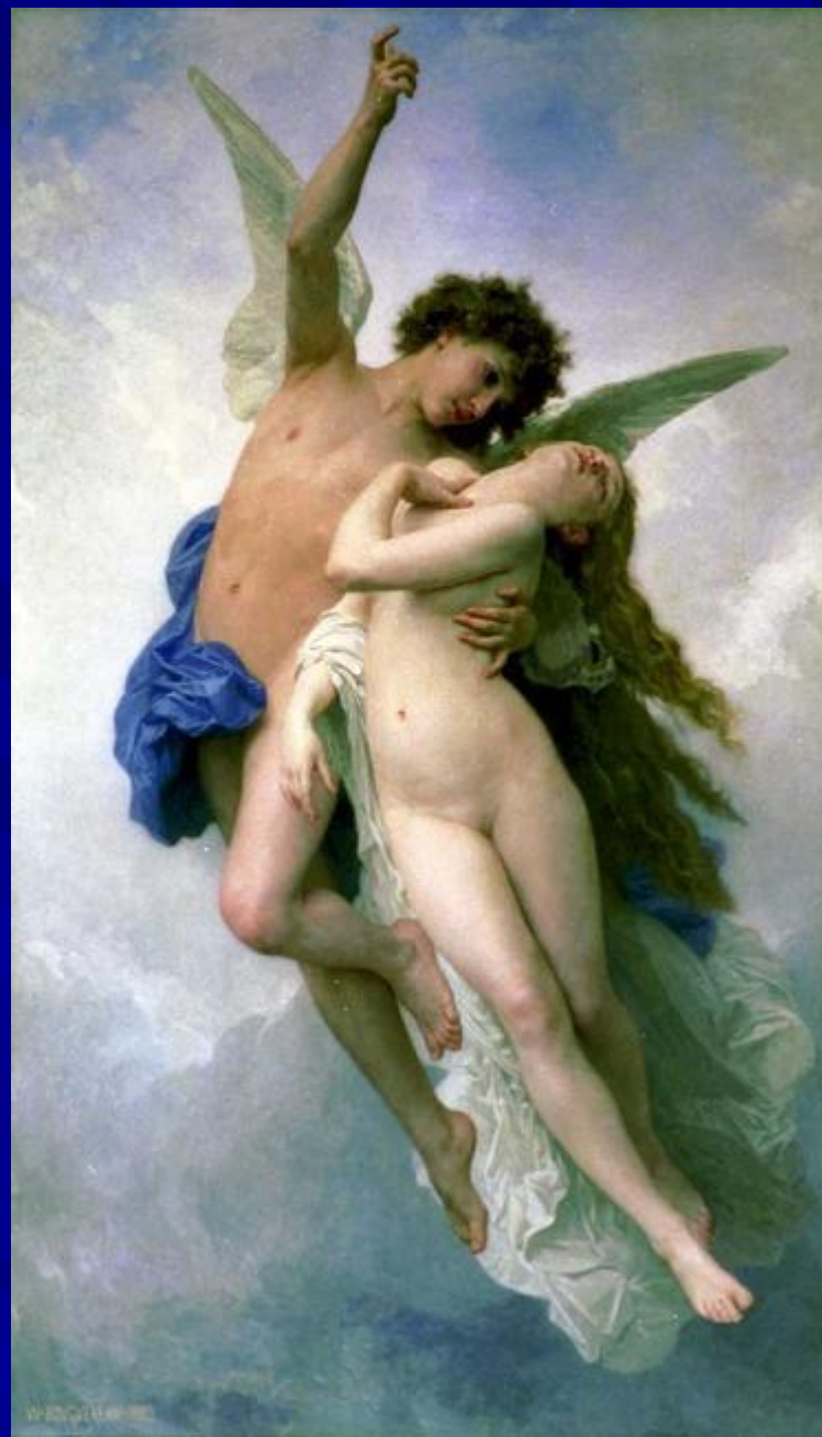
Адольф Уильям Бугро “Амур и Психея”