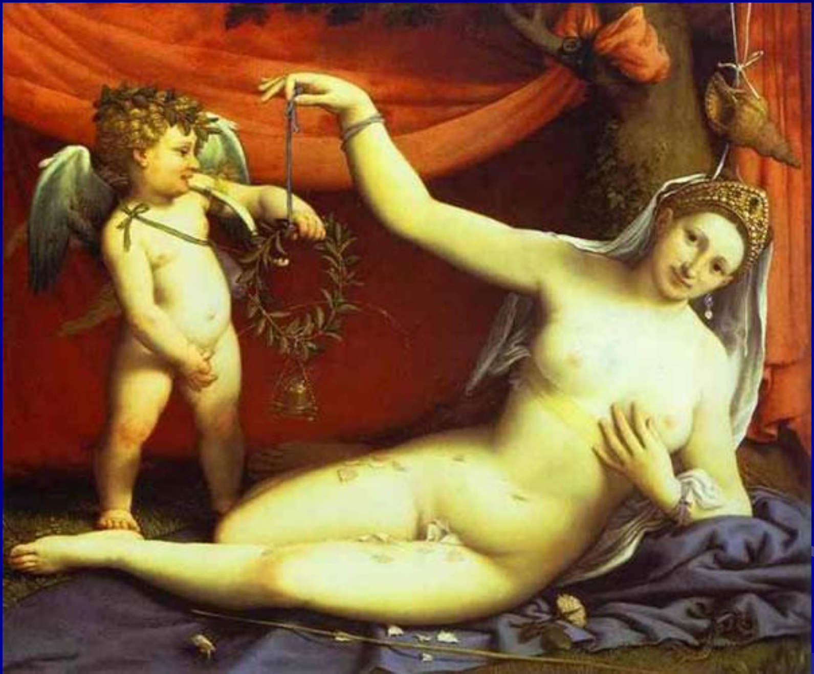
Лотто “Венера и Купидон”