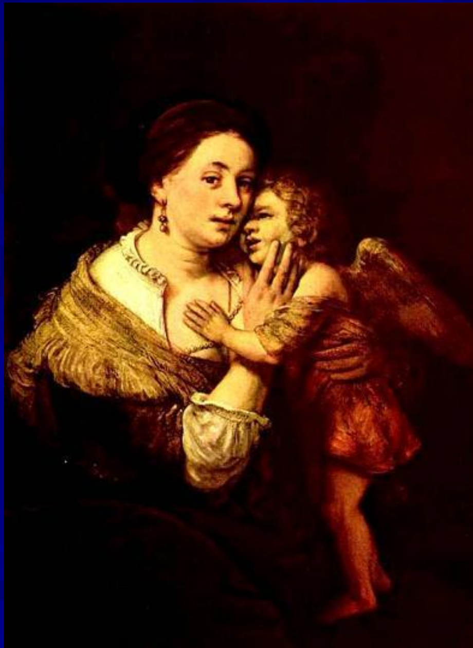
Рембрандт “Венера и Амур” 1642 г.