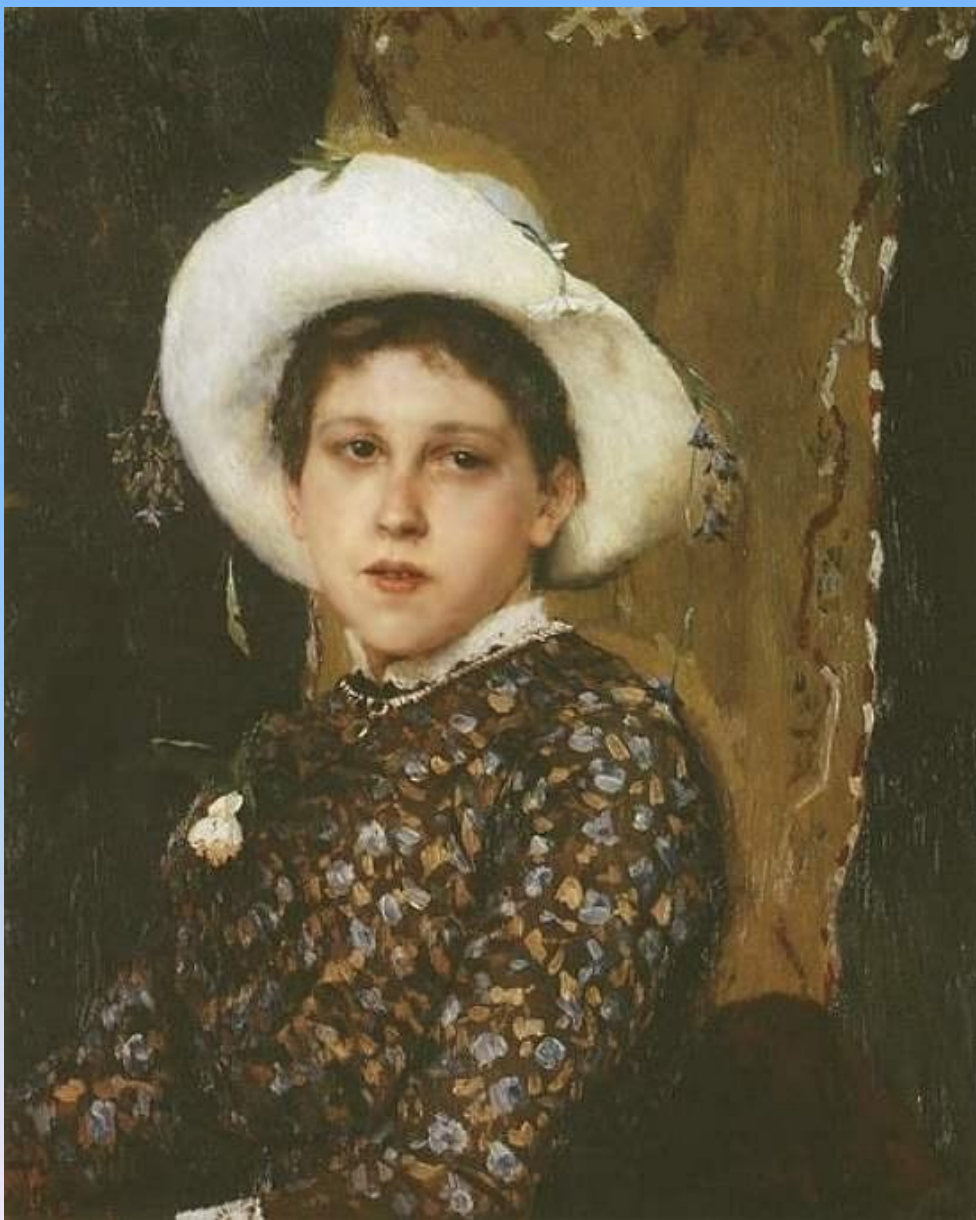
Портрет Татьяны Анатольевны Мамонтовой 1884г, холст, масло, Государственная Третьяковская галерея, Москва.