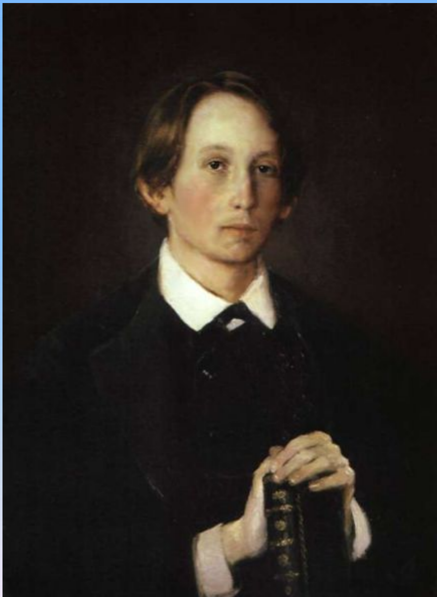
В. М. Васнецов. Портрет брата, художника Аполлинария Михайловича Васнецова. 1878. ГТГ