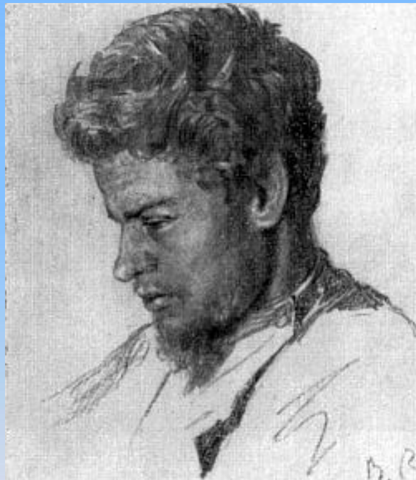
Портрет художника Максимова В. М., 1874