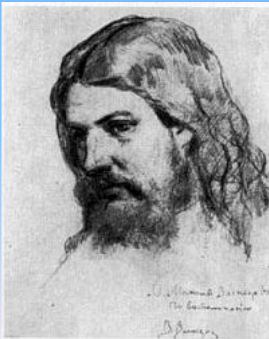
В.М. Васнецов Портрет отца М.В. Васнецова. 1870 г.