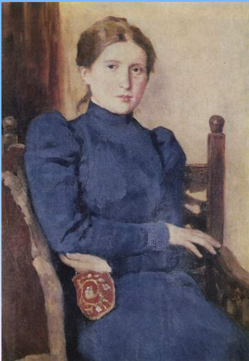
Портрет Т.В. Васнецовой 1901г, холст, масло, Дом-музей В.М. Васнецова