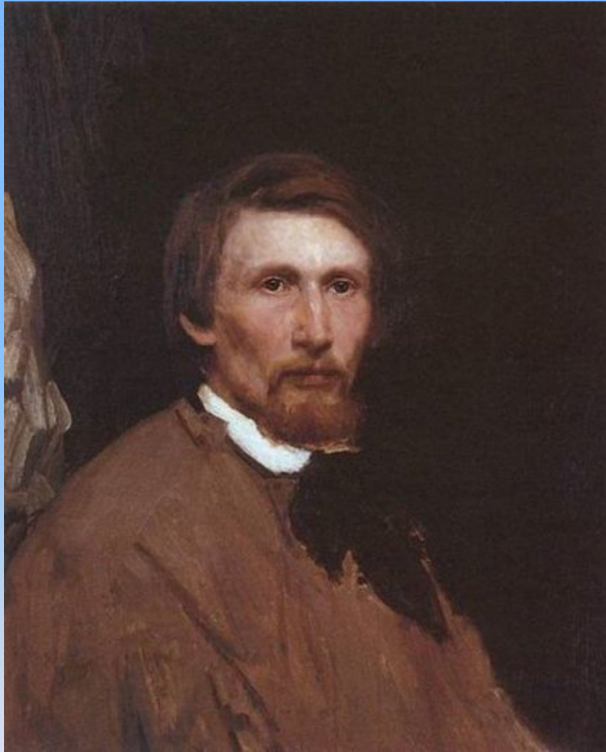
Автопортрет 1873г, холст, масло, Государственная Третьяковская галерея, Москва.

„Автопортрет"... 1873 год. Давно написан этот холст. Автору двадцать пять лет. Всмотритесь в репродукцию. Строго, немного грустно глядит на нас молодой человек. Русые волосы обрамляют худощавое лицо. Резко обозначились желваки у острых скул. Впалые щеки бледны. Но это не означает немощь или вялость. Нет. Молодой вятич силен. Это ему сказал Савва Мамонтов: „Если бы ты не был художником, из тебя бы вышел славный молотобоец".