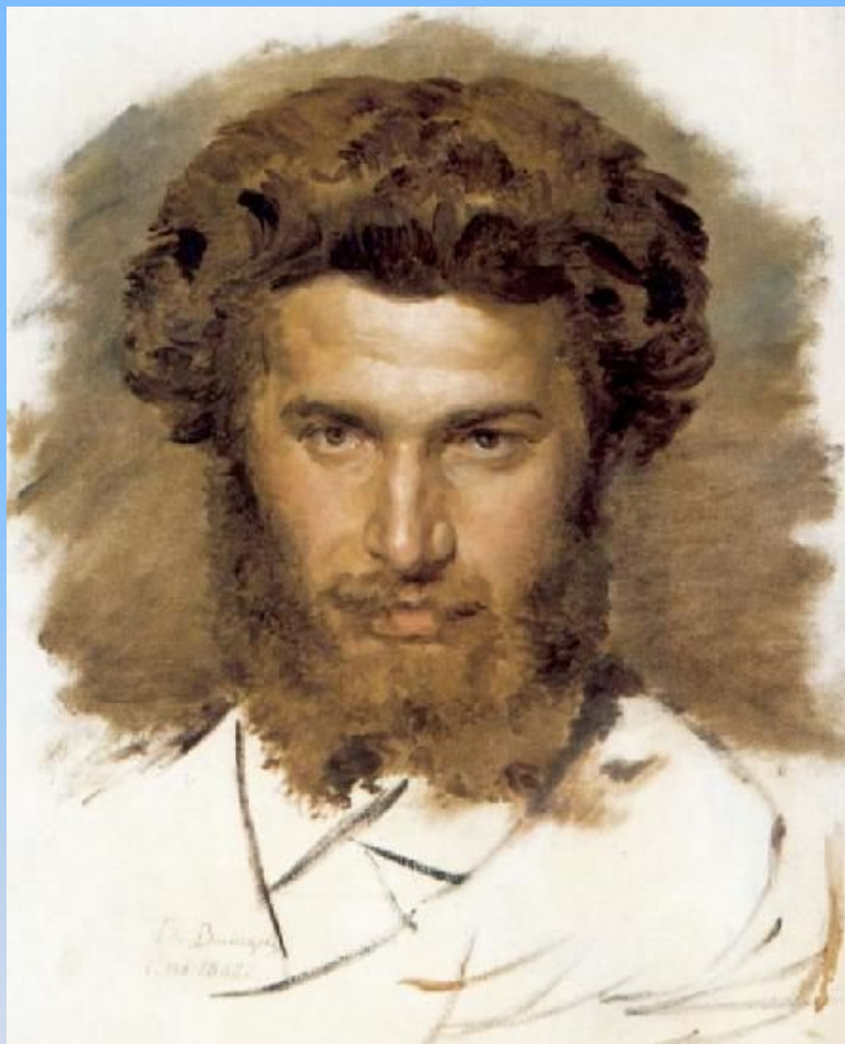
Портрет художника Куинджи А. И., 1869