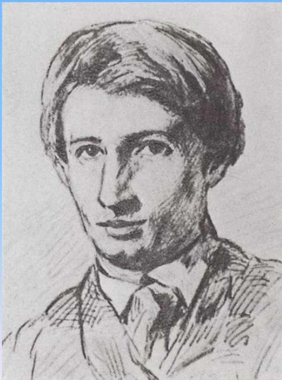
Автопортрет. 1868. Дом – музей Васнецова