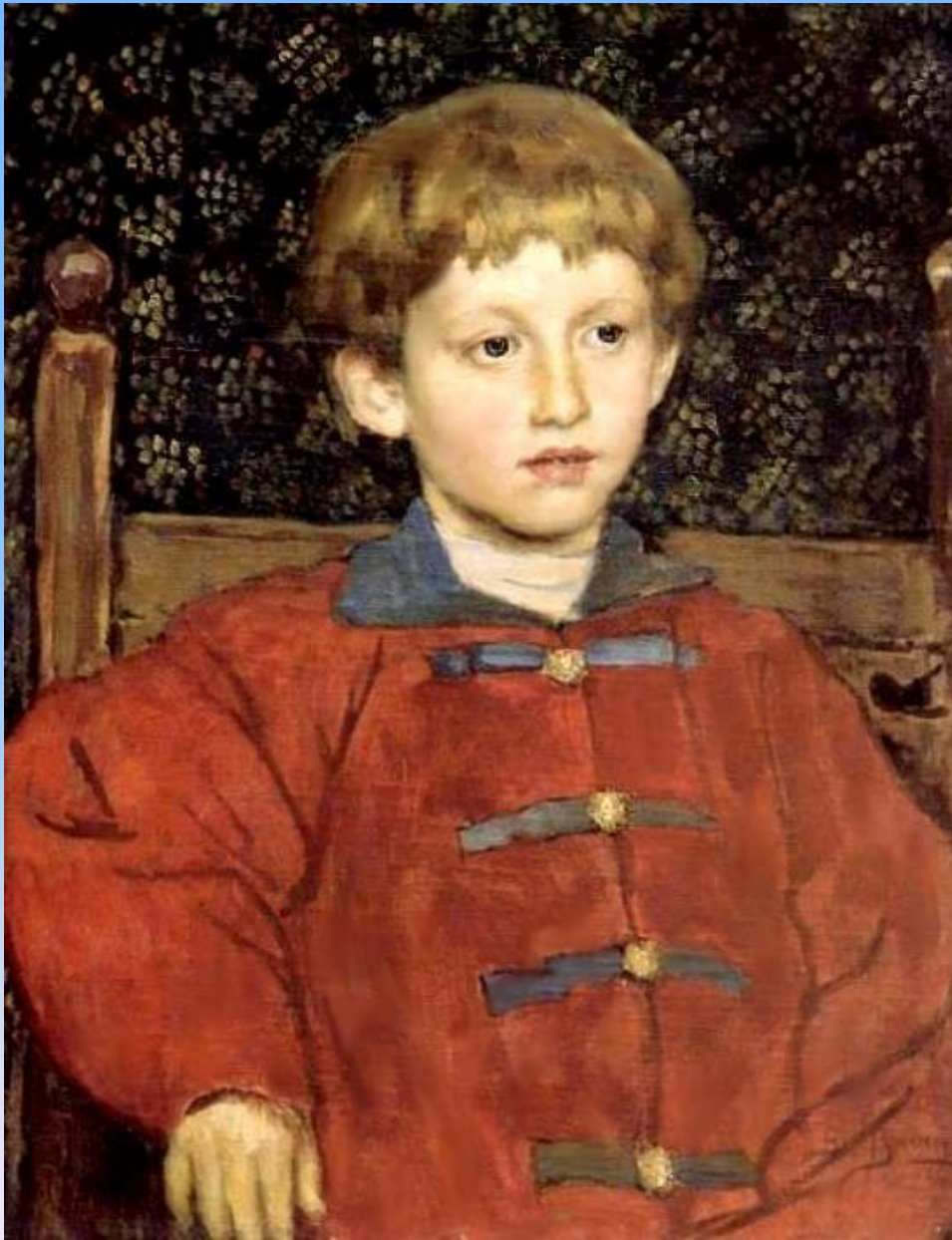
Портрет Владимира Васнецова, сына художника 1899г, холст, масло, Дом- музей В.М. Васнецова