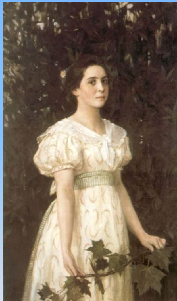
Портрет Веры Саввишны

Вятский областной художественный музей имени В.М. и А.М.Васнецовых